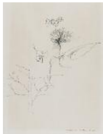
Zao WOU-KI (né en 1921). Sans titre. Encre signée et datée '51' en bas à droite. Dimensions : 30 x 22 cm.