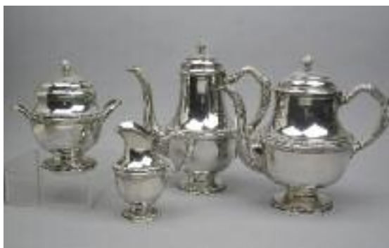
Service à thé-café en argent. Style Louis XVI. Poinçon Minerve. Poids total : 1 673 g.