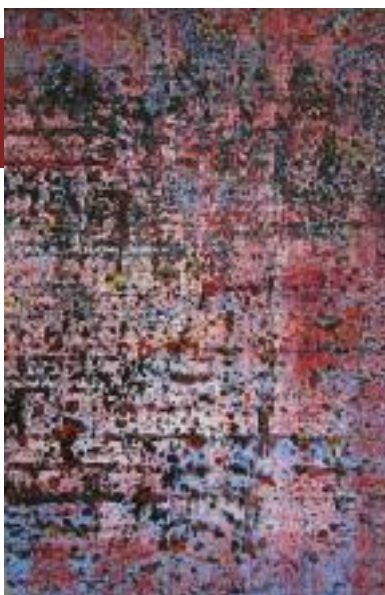
Jean-Michel PERDIGON (né en 1962) Sans titre n°782. Huile sur papier marouflée sur toile signée et datée au dos. Dimensions : 100 x 65 cm.