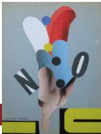
Composition surréaliste. Collage sur papier signé en bas à gauche. Dimensions : 24 x 18 cm.