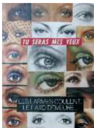
Tu seras mes yeux. Collage signé et daté '1970' en bas à gauche. Dimensions : 32 x 24 cm.

Graveur, dessinateur, peintre et poète, Jacques Maret est un artiste aux multiples facettes : cubisme, abstraction et surréalisme répondent à la diversité de son expression : eaux-fortes, papiers-collés, crayon de couleurs, pinceaux et gouaches. Cependant il s'est voulu artiste indépendant et sans étiquette et fût beaucoup pillé avant la célébrité.