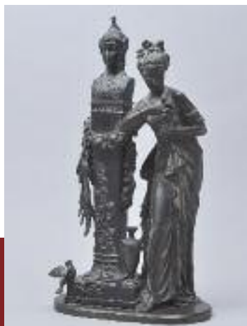
Eugène LAURENT (XIX e siècle). Groupe représentant une jeune fille devant le buste d'Athéna sur gaine. Bronze signé. Hauteur : 40 cm.