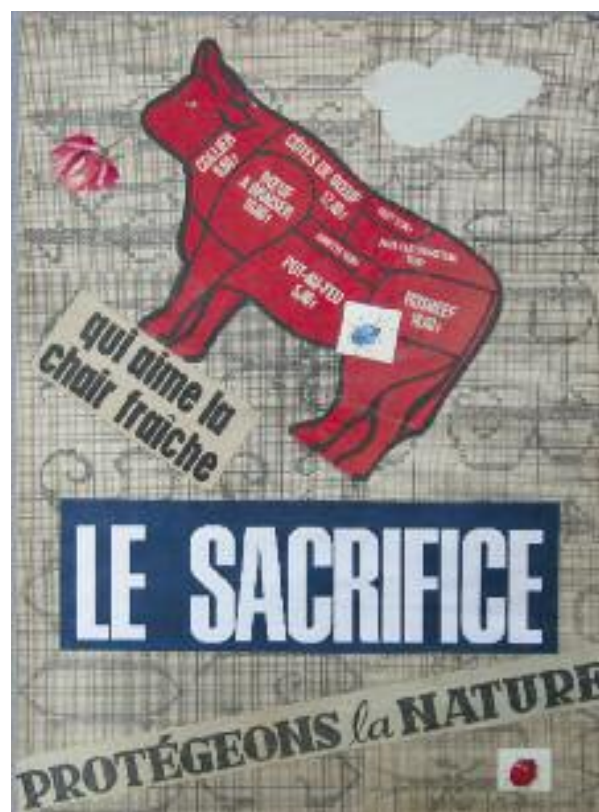
Le Sacrifice. Collage signé et daté '70' en bas à droite. Dimensions : 48 x 35,5 cm.