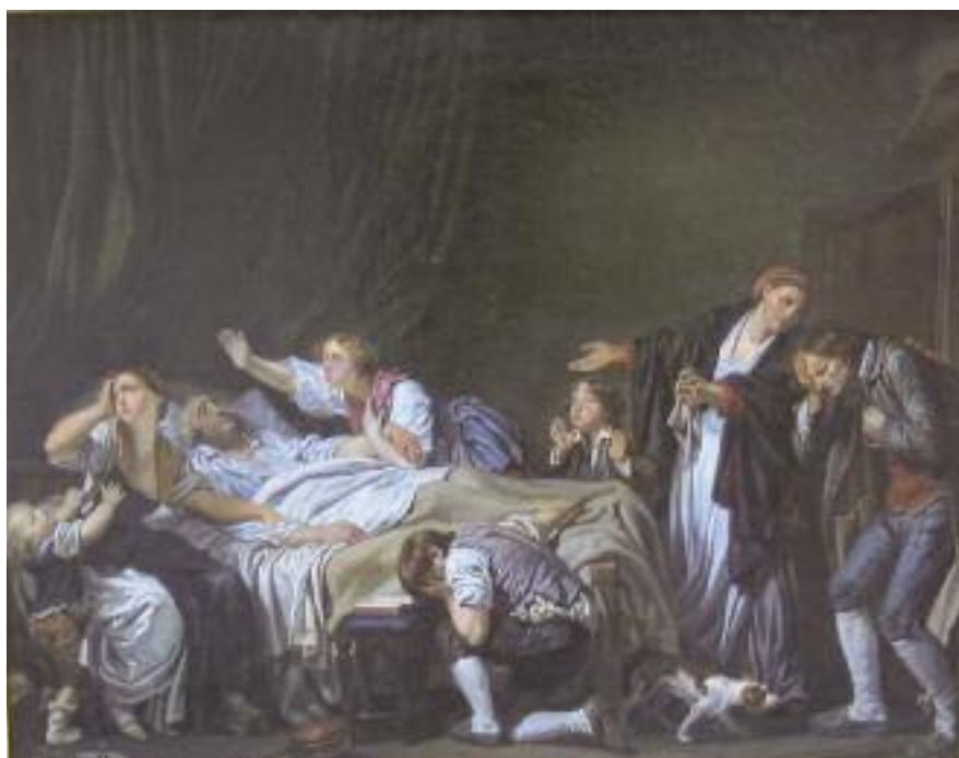
Jean-Baptiste GREUZE (1725-1805) (Ecole de)

1. La Malédiction paternelle : Le Fils ingrat.