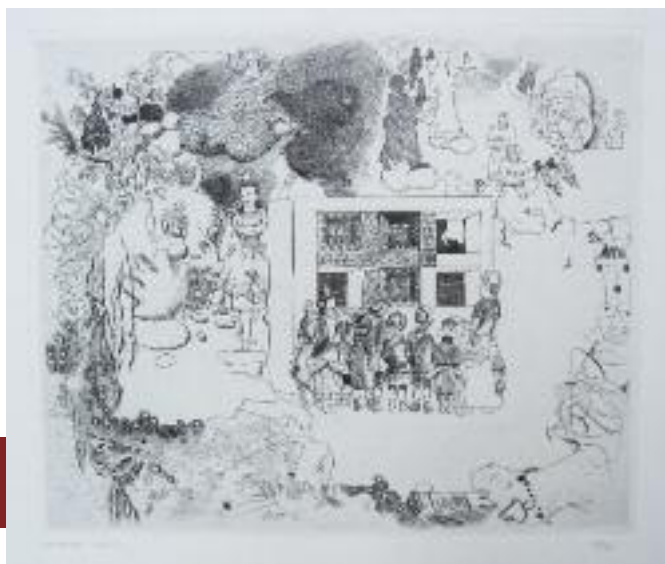
Composition. Eau-forte signée en bas à gauche et numérotée 29/50. Dimensions : 25 x 29,5 cm (sans les marges).