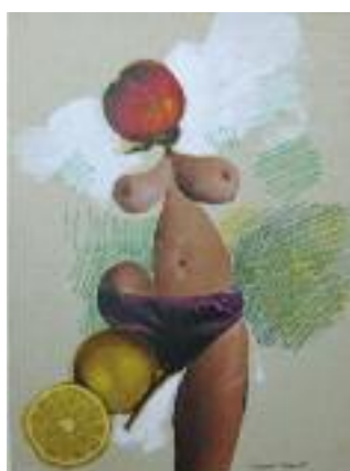
Composition surréaliste au citron. Collage, crayon et gouache sur papier signé en bas à droite. Dimensions : 24 x 18 cm. Porte au dos le cachet de la collection Maret-Pichon.