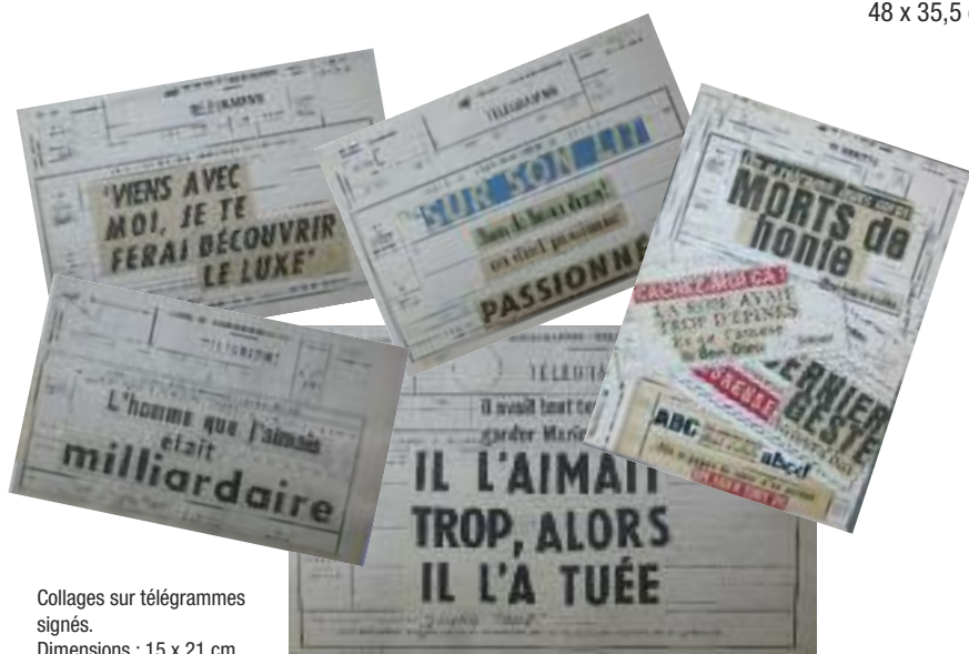
Collages sur télégrammes signés. Dimensions : 15 x 21 cm.