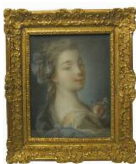
François BOUCHER (1703-1770) (Ecole de)

Portrait de jeune fille de trois-quart en buste, rose et fleurs à son corsage, un ruban bleu noué dans les cheveux.