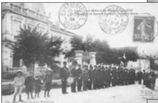
Lot n° 433