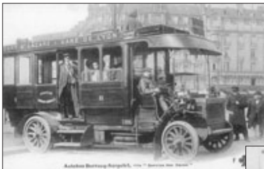
Lot n° 421