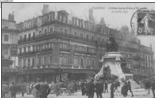
Lot n° 433