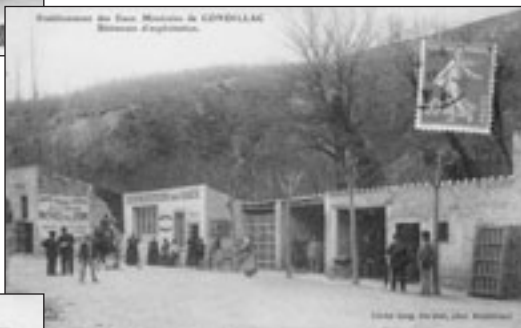
Lot n° 451