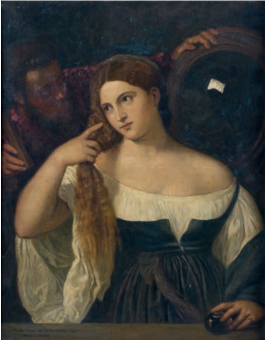
59. École du XIX e siècle