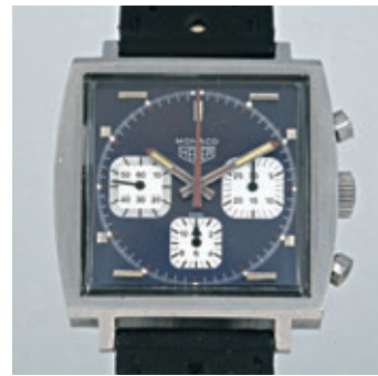
HEUER MONACO Vers 1970