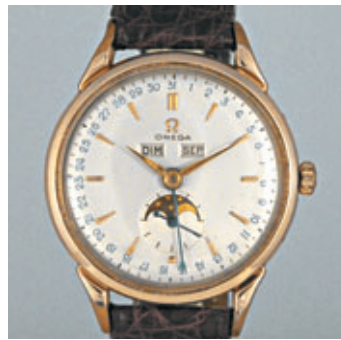
OMEGA ASTRONOMIQUE Vers 1940