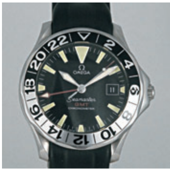
OMEGA SEAMASTER GMT Vers 2003