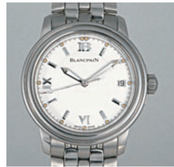
BLANCPAIN LEMAN Vers 1990