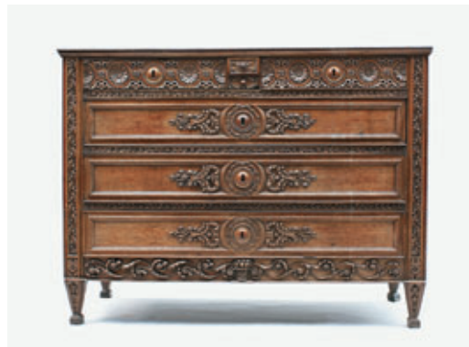
COMMODE en chêne sculpté. Travail Liégeois du XIX e siècle. 104 x 135 x 54 cm