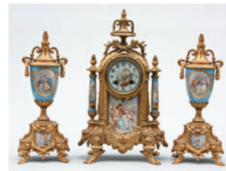
GARNITURE en porcelaine à décor de scènes peintes et bronze doré. Vers 1900. Haut. pendule : 40 cm Haut. cassolettes : 33 cm