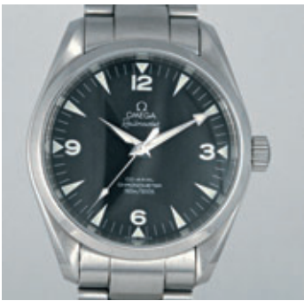
OMEGA RAILMASTER Vers 2004