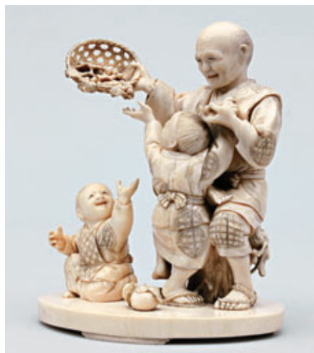
GRUPE en ivoire, signé dans une réserve rectangulaire. Japon, fin du XIX e siècle. Haut. : 14 cm

PHOTOGRAPHIES ET DÉTAILS SUPPLÉMENTAIRES SUR NOTRE SITE INTERNET : www.lombrail-teucquam.com