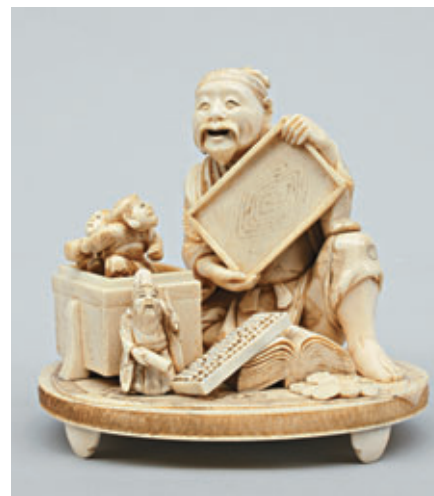
OKIMONO en ivoire. Signé Itsukomin . Japon, Époque Meiji. Haut. : 11 cm

Expositions publiques : Vendredi 5 juin de 14 h à 18 h Samedi 6 juin et 10 h à 12 h