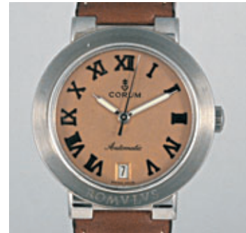
CORUM ROMULUS Vers 1990