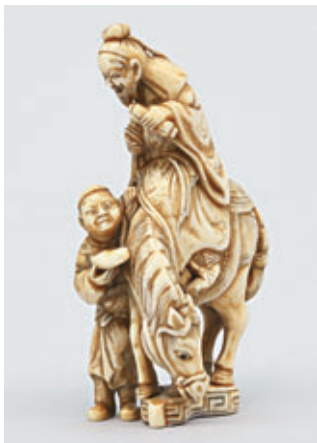
NETSUKE en ivoire, Japon, fin XVIII e -début XIX e siècle. Haut. : 7 cm

Bijoux - Argenterie - Montres bracelets - Objets de vitrine, d'art et d'ameublement - Mobilier XVIII e , XIX e et de Style