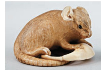
NETSUKE en ivoire, signé Mazatami , Japon, XIX e siècle. Haut. : 3 cm