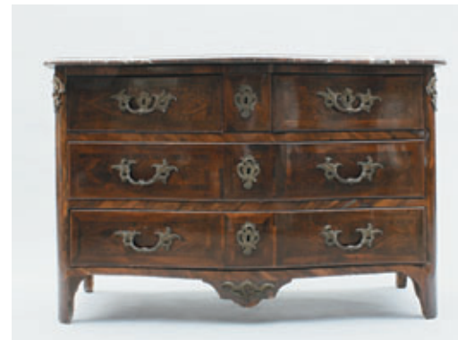
COMMODE en bois de placage, dessus de marbre, façade mouvementée, quatre tiroirs. Estampillée de Charles Chevallier reçu Maître avant 1738. XVIII e siècle. 85 x 122 x 56 cm