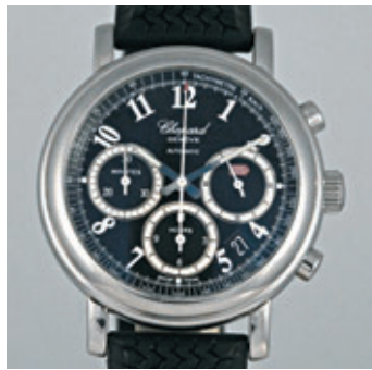
CHOPARD MILLE MIGLIA Vers 2008