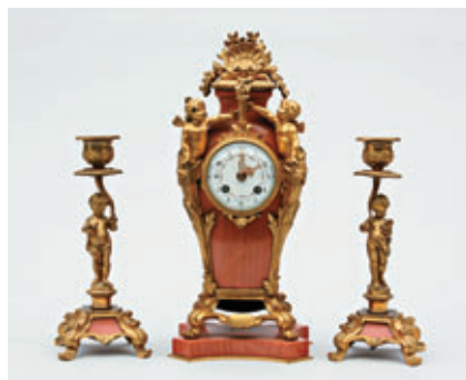
GARNITURE en marbre et bronze doré. Vers 1900. Haut. pendule : 34 cm Haut. bougeoirs : 22 cm