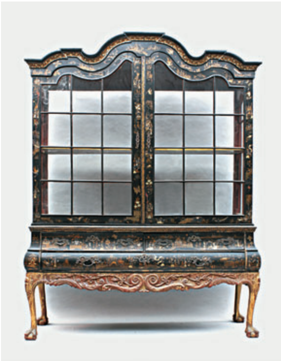
VITRINE, DEUX CORPS, en bois laqué, décor au chinois. Travail étranger du début du XIX e siècle. 220 x 173 x 55 cm