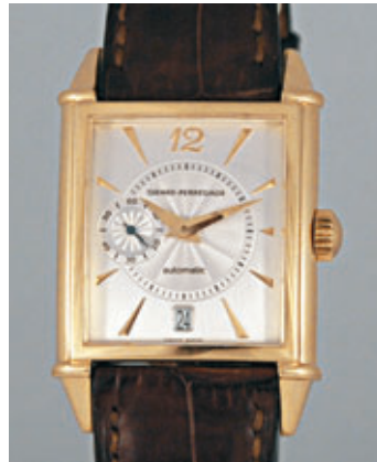
GIRARD PERREGAUX VINTAGE n° 1 Vers 2000