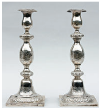
PAIRE DE BOUGEOIRS en argent, forme balustrade à décor ciselé et repoussé de frises florales. Travail russe de la fin du XIX e siècle, poinçonnée et datée 1873. Haut. : 29,5 cm - Poids : 683 g