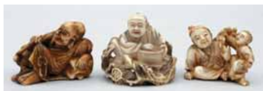
78 89 95

88 NETSUKE en ivoire représentant Shoki assis, une louche dans la main, un pot devant lui, un oni est couché à côté de lui, les yeux sont incrustés de nacre, signé. Japon, fin du XIX e siècle. 3,2 x 4 cm 150/180 € Voir la reproduction page 2