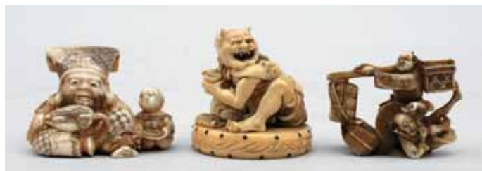
91 34 68