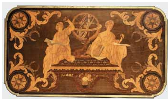
295 (détail du plateau)