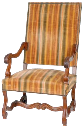
houton. Style Louis XIV. 4 cm - Prof. : 60 cm 0 €

DE NOMBREUX LOTS NON DÉCRITS SERONT INCLUS DANS LA PRÉSENTE VENTE