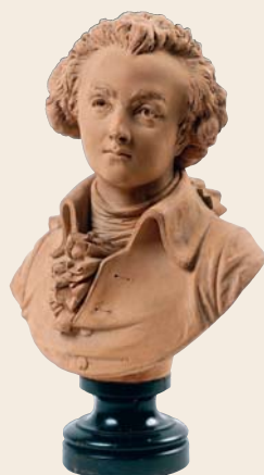
Albert-Ernest CARRIER-BELLEUSE (1824-1887) Mozart Terre cuite signée "Carrier-Belleuse", Atelier de "Carrier-Belleuse" socle bois. Haut. : 40,5 cm - Long. : 24 cm Prof. : 18 cm 4 000 / 4 500 €