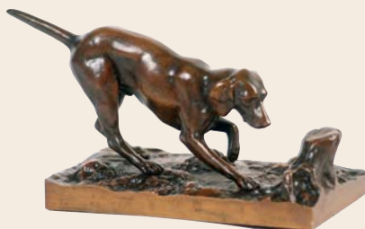
Antoine-Louis BARYE (1795-1875) Chien d'arrêt

Bronze. Épreuve ancienne signée "P.J. MÈNE". Atelier Mène. Haut. : 16,2 cm - Long. : 34,5 cm - Prof. : 13,3 cm 2 000 / 2 300 €