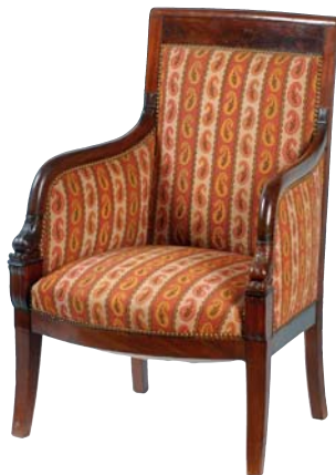
BERGÈRE en acajou - XIX e siècle. Haut. : 94 cm - Larg. : 65 cm - Prof. : 59 cm 600 / 700 €

DE NOMBREUX LOTS NON DÉCRITS SERONT INCLUS DANS LA PRÉSENTE VENTE