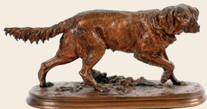
Pierre-Jules MÈNE (1810-1879) Fabio n° 1

Bronze. Épreuve ancienne signée "P.J. MÈNE". Atelier Mène. Haut. : 16,2 cm - Long. : 34,5 cm - Prof. : 13,3 cm 2 000 / 2 300 €