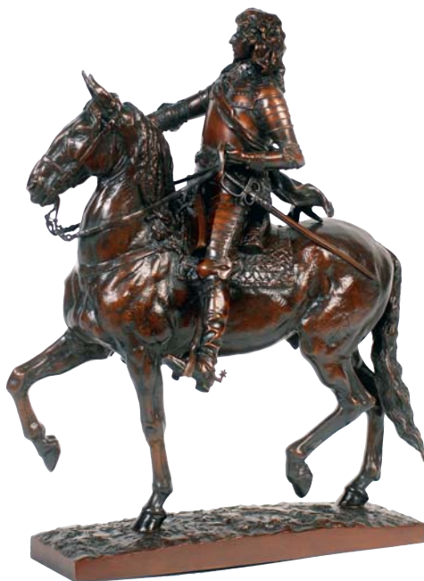
Emmanuel FRÉMIET (1824-1910) Grand Condé, 1881 Salon de 1881, Château de Chantilly. Bronze. Épreuve ancienne signée "E. FRÉMIET", atelier More n° 34. Haut. : 49 cm - Long. : 37,9 cm - Prof. : 19,3 cm 9 000 / 9 500 €