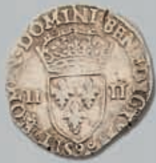
494 (du lot)