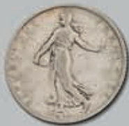
324 (du lot)