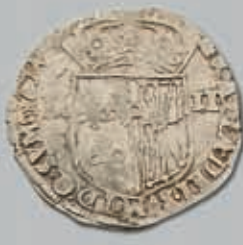
495 (du lot)