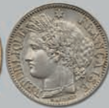
321 (du lot)