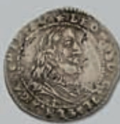
251 (du lot)