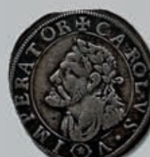
217 (du lot)