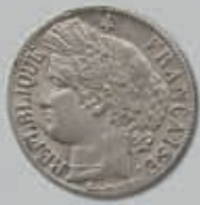
438 (du lot)