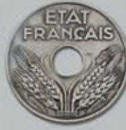
441 (du lot)