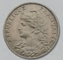
442 (du lot)