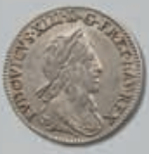
502 (du lot)