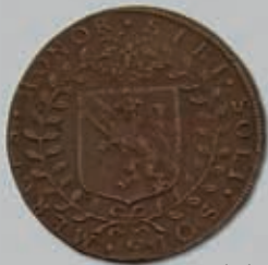
269 (du lot)