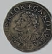
222 (du lot)