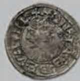
237 (du lot)