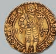
357 (du lot)