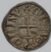
192 (du lot)