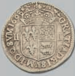
495 (du lot)