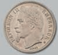
316 (du lot)