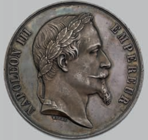
488 (du lot)