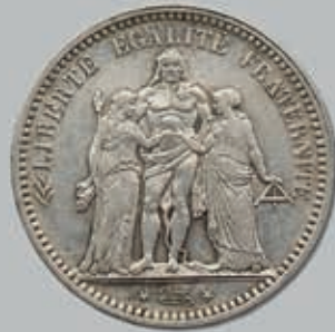
317 (du lot)