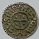
254 (du lot)