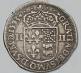
287 (du lot)