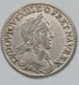
502 (du lot)