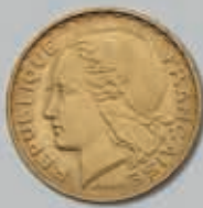
443 (du lot)