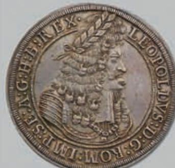
456 (du lot)