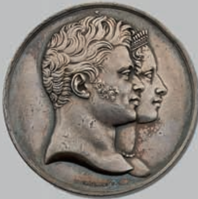
486 (du lot)