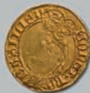
357 (du lot)