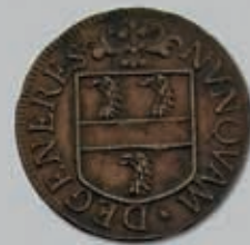
269 (du lot)