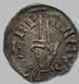
193 (du lot)