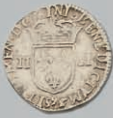
494 (du lot)