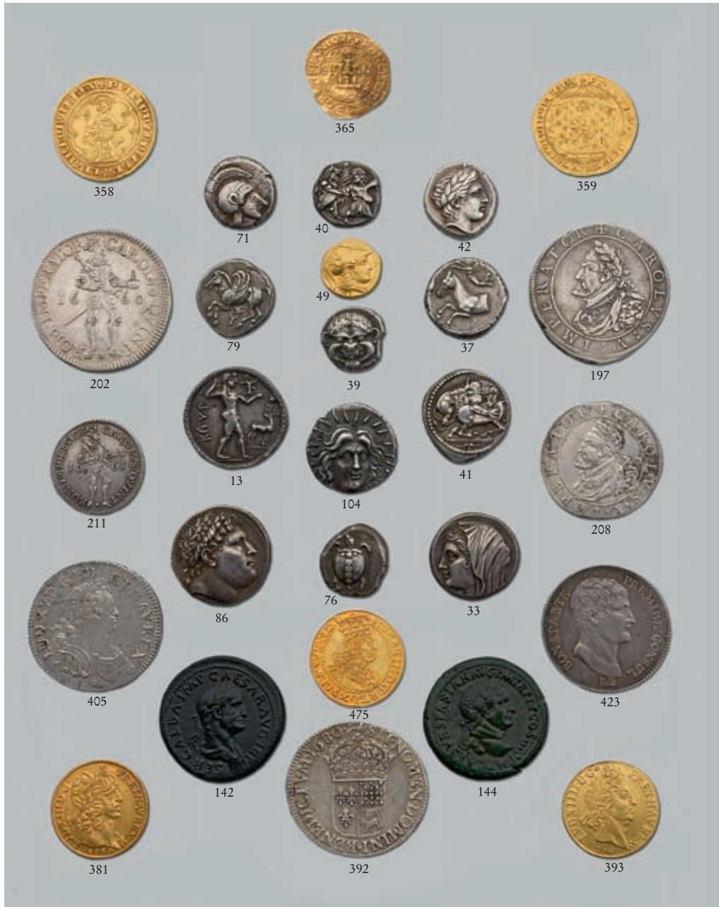
Identification des monnaies reproduites en couverture