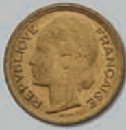
443 (du lot)