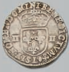
494 (du lot)