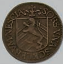
269 (du lot)