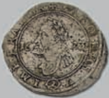
219 (du lot)