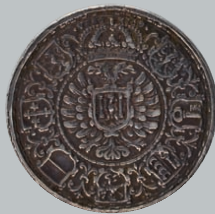
274 (du lot)