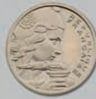
442 (du lot)