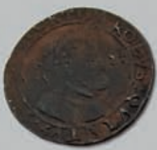
269 (du lot)