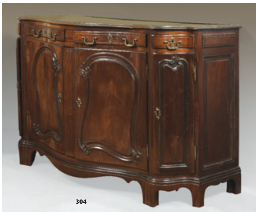
304 Buffet à hauteur d'appui en acajou massif mouluré et sculpté, la façade mouvementée ouvrant par deux portes surmontées de deux tiroirs et flanquées aux angles d'une petite porte surmontée d'un tiroir. Travail d'un port des Flandres (Dunkerque ?) de la fin du XVIIIème ou du début du XIXème siècle (Restaurations et parties refaites). H : 99 ; L : 156 ; P : 62 cm 4 000/5 000 € Voir reproduction ci-contre