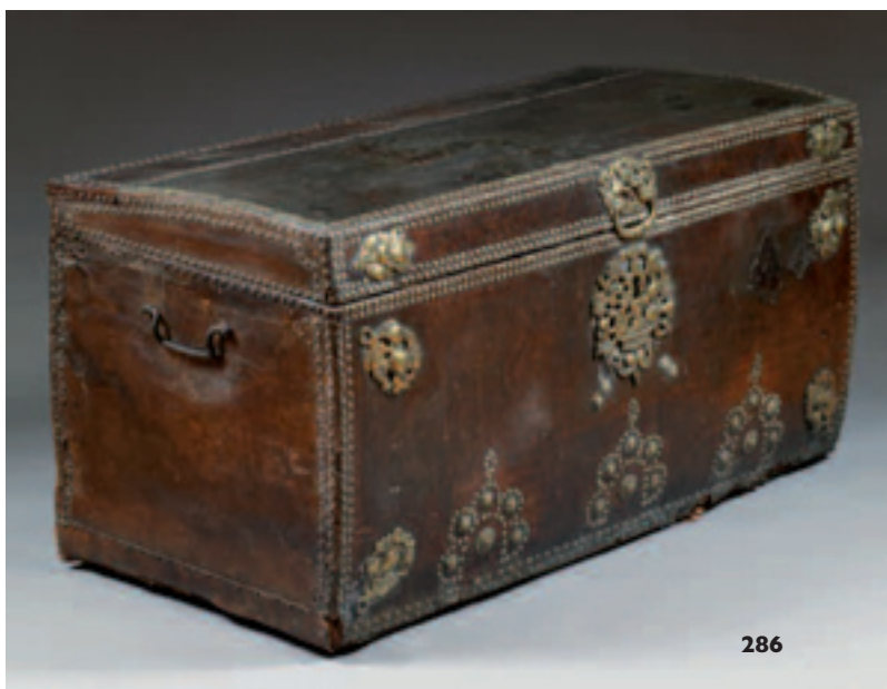
286 Malle en bois gainé de cuir fauve, ornée de filets d'encadrement cloutés et de plaques ajourés en laiton à décor de fruits et corbeilles de fruits, les côtés garnis de poignées mobiles en fer forgé. Epoque Louis XIV (accidents, manques et parties refaites). H : 53 ; L : 105 ; P : 52 cm 500/700 € Voir reproduction ci-dessous