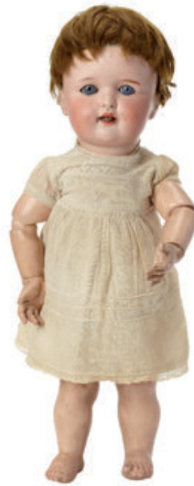
56 Bébé à tête caractérisée marquée « UNIS France 271 » (N°rare) taille 10, yeux mobiles bleus, bouche ouverte, corps articulé d'origine. H = 46 cm. 300/400 €