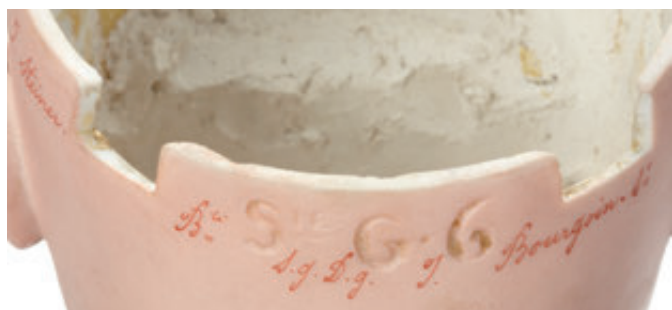
74 Très belle poupée française JN STEINER avec tête en biscuit pressé, bouche fermée, marquée en creux « Sie G6 » et à la plume « J.Steiner Bte SGDG-J.Bourgouin Scr ». yeux fixes bleus. Corps articulé d'origine marqué sur le côté gauche au tampon bleu « Le Petit Parisien » J.ST Bté SGDG-J.B Succr PARIS (accident à 1 pouce). H = 72 cm. 12 000/15 000 €