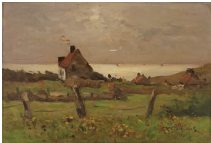
41 Gustave Achille Guillaumet (1840-1887) Paysage à la chaumière. Signé en bas à droite. 24 x 35 cm. 400/600 €