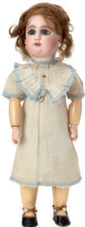
57 Poupée française , tête en biscuit bouche ouverte, marquée « JULLIEN 4 » yeux fixes bleus, corps articulé d'origine. H = 38 cm. Eclat en haut du front du au retrait de la perruque. 300/400 €