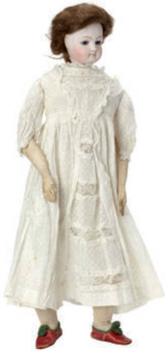
55 Poupée de mode de type « Parisienne » tête en biscuit pressé, bouche fermée, yeux fixes bleus, collerette en biscuit, sans marque, corps d'origine en peau, avec articulations à goussets, robe et chaussures anciennes. H = 58 cm. 1 800/2 500 €