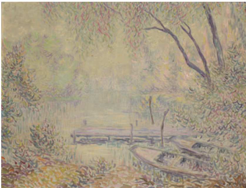
34 Ecole moderne Saules pleureurs en bord de rivière. Huile sur toile. Non signée. 50 x 65 cm. Porte un n° 8 sur le châssis. 500/700 €

Exposition : Galerie D. Rothschild, Exposition François Bonvin, Mai 1886, 3 rue Scribe à Paris. (étiquette au dos du panneau).