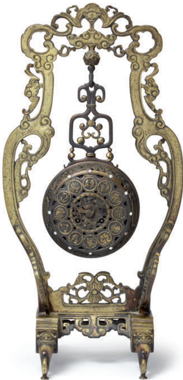
169 Attribuée à Edouard LIEVRE probablement pour l'Escalier de Cristal. Pendule portique en bronze à patine vernie rouge et rechapée or à décor chinoisant, à sonnerie sur gong, les aiguilles en forme de dragon. Elle repose sur quatre pieds formés d'une trompe d'éléphant jaillissant de la gueule d'un monstre. Vers 1880 (petits manques). Hauteur : 71 - Larg. 35 cm. 2 500/3 500 €