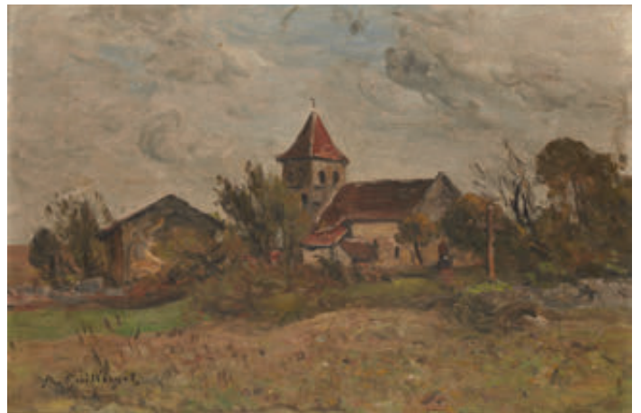
40 Gustave Achille Guillaumet (1840-1887) Église dans un paysage. Huile sur panneau. Signé en bas à gauche. 24 x 35 cm. 400/600 €