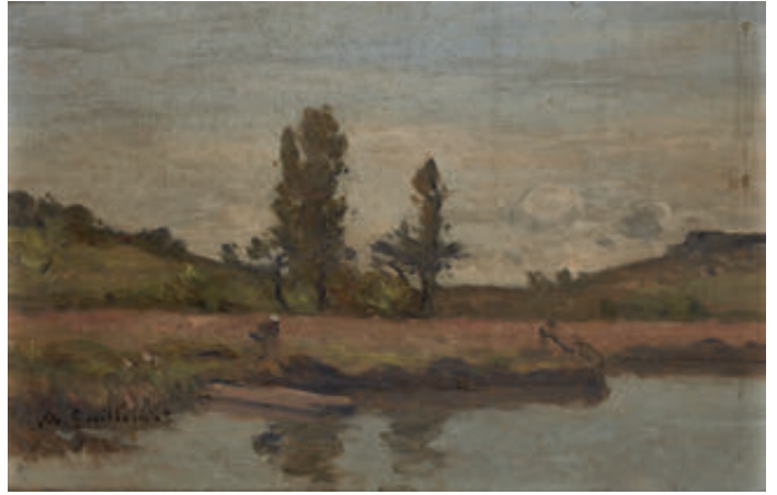
38 Gustave Achille Guillaumet (1840-1887) Femme au bord d'un étang. Huile sur panneau. Signé en bas à gauche. 24 x 35 cm. 400/600 €