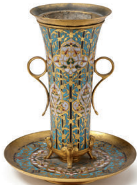
170 Ferdinand BARBEDIENNE (1810-1892) Vase cornet à deux anses à présentoir attachant, en bronze doré et émaux cloisonnés à décor floral polychrome dans des réserves sur fond turquoise. Il pose sur quatre pieds griffe. Vers 1880. Signé. Hauteur : 24 Diam. 19 cm. 300/500 €