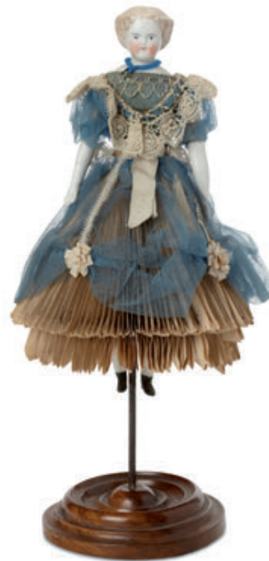
58 Poupée 19 e « Diseuse de bonne aventure » avec tête buste, bras en biscuit, yeux peints, montée sur socle en bois tourné. La robe d'origine abritant le jeu de papier questions réponses pour prédiction de l'avenir. H = 27 cm. A signaler un petit trou au sommet du crâne permettant de la tenir en suspension. 400/500 €