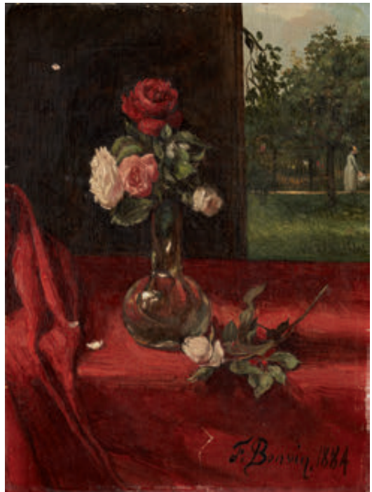
33 François BONVIN (1817-1887) Vase de roses sur la nappe rouge, 1884. Huile sur panneau, signée en bas à droite et datée 1884. 18,5 x 14 cm. 300/500 €