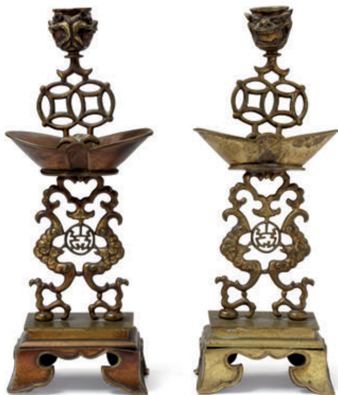
171 Paire de bougeoirs en bronze ajouré à patine vernie rouge à décor chinoisant. Fonte de SUSSE FRERES vers 1880/1900 (un peu tordus). Hauteur : 31 cm. 400/600 €