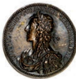
N° 23 du lot