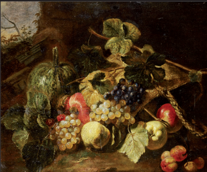
PACE (école de). Huile sur toile. 60 x 80 cm