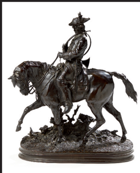
MENE. Bronze 1874. H : 62 cm