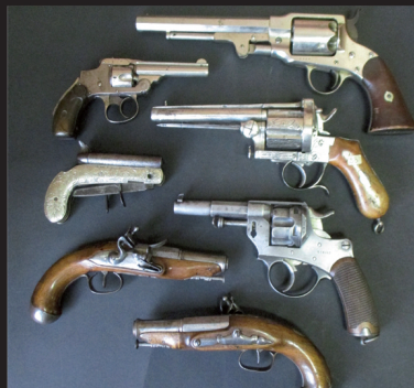
Collection de revolver.