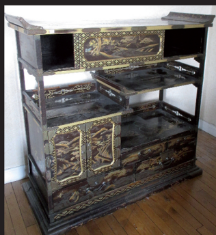
Cartonnier. H : 181 - L. : 91 P. : 42 cm