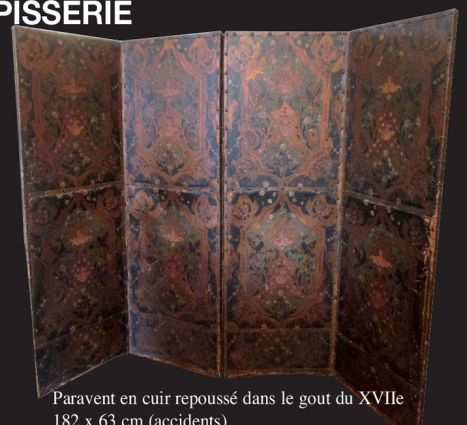
Paravent en cuir repoussé dans le goût du XVIIe 182 x 63 cm (accidents)

EXPERTS • TABLEAUX ANCIENS : P. DUBOIS 01 45 23 12 50 - TABLEAUX XIXe ET MODERNES : CABINET CHANOIT 01 47 70 22 33 • EXTRÊME ORIENT : P. ANSAS et A. PAPILLON 01 42 60 88 25 OBJETS D'ART ET MOBILIER Cabinet QUERE BLAISE 06 78 62 87 55 • MILITARIA : A. LOUOT 01 47 05 33 62 • ICÔNES : L. MANIC 06 07 75 10 77