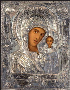
Saint Petersburg 1782. 21.5 x 25.5 cm