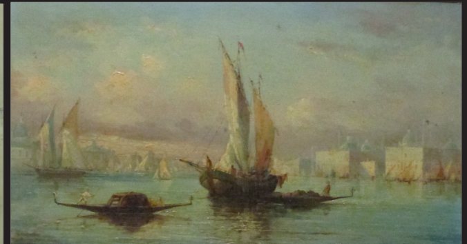
D'une paire d'huile sur panneau. Ecole du XIXe. 22 x 41 cm