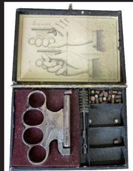
Rare pistolet coup de poing LE CENTENAIRE