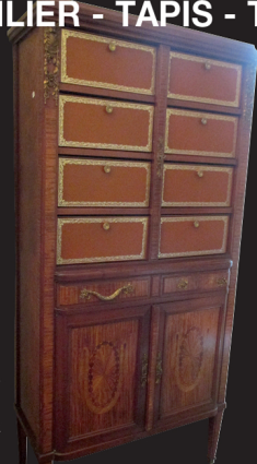
Cabinet Chanoit 01 47 70 22 33