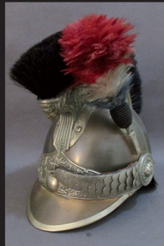
Casque de gendarme à pied 1913