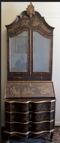
Commode scriban travail anglais XIXe. H : 155 L. 103 P. 96 cm