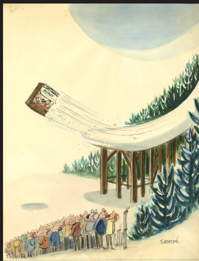
Sempé : contrôle départ dessin en couleur 24 x 32cm