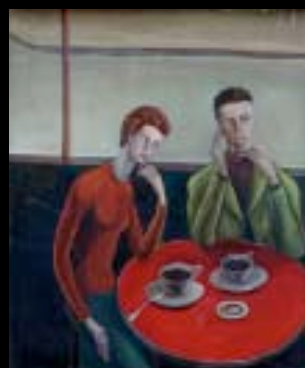
119 "Autour d'un café" Huile sur toile, cachet 73 x 60 cm