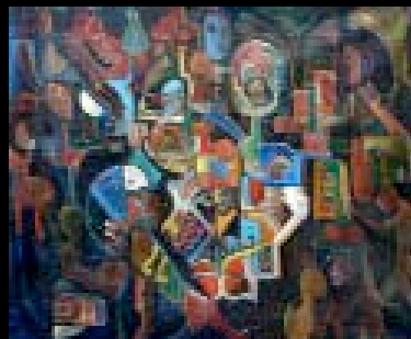
83 "Chasseurs de lions" HST, titré et signé au dos 54 x 65 cm