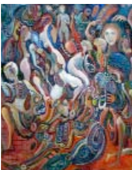
96 " Mai en 1968" Huile sur toile cachet, titré et daté au dos 73 x 60 cm

En 1992, il réalise les fresques de l'église de Serrières en Saône et Loire, illustrant sur 100 m2 la vie du Christ et un jugement dernier riche d'une vision très personnelle, sorte de testament pictural.