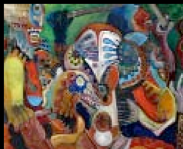
115 "Combat de guerriers" Huile sur toile, cachet 60 x 73 cm