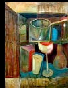
18 "Nature morte à la po" Huile sur toile, cachet 65 x 54 cm