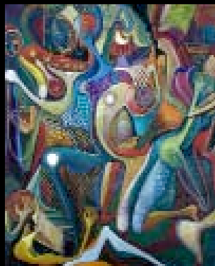
11 "Le sacre du printemps" Huile sur toile, Monogramé, titré au dos 81 x 65 cm