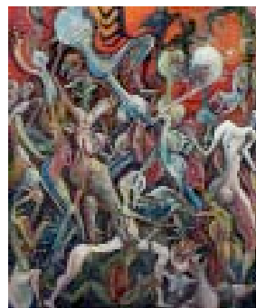
109" Ere quinquenaire" Huile sur toile Cachet, titré au dos 73 x 60 cm