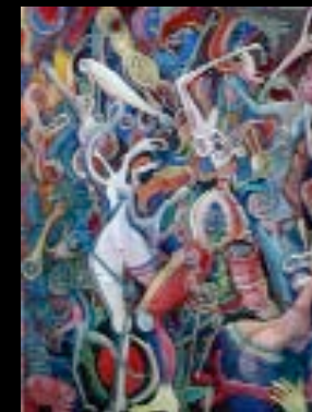
26 "La danse des corps" Huile sur toile, cachet 81 x 65 cm