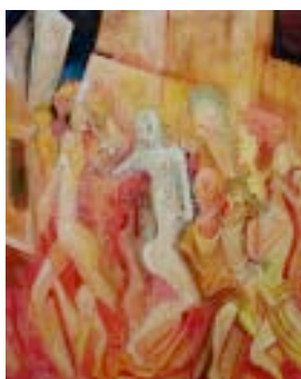
25 " L'enfer" Huile sur toile, cachet, 81 x 65 cm