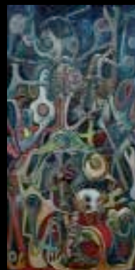
112 "Créatures de rêves" Huile sur toile, cachet, titré et daté 1970 au dos 100 x 49,5 cm