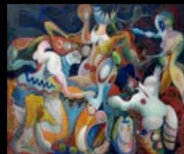
63 "La danse" Huile sur toile, cachet 60 x 73 cm