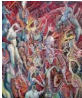
32 " Composition féérique" Huile sur toile signé en bas à gauche 65 x 54 cm

Liste sur demande et catalogue en ligne sur internet : http://www.drouot.com