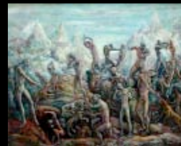
14 "Les hommes aux prises avec les loups" Huile sur toile, cachet 65 x 81 cm