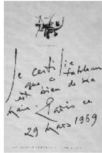
Figure au dos de l'œuvre