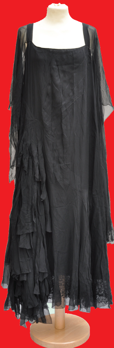
M27 - Chanel