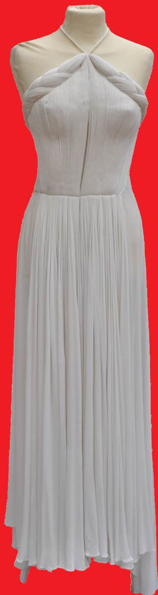
M91 - Grès

MODE VINTAGE - BIJOUX COUTURE - ACCESSOIRES DENTELLES - LINGE