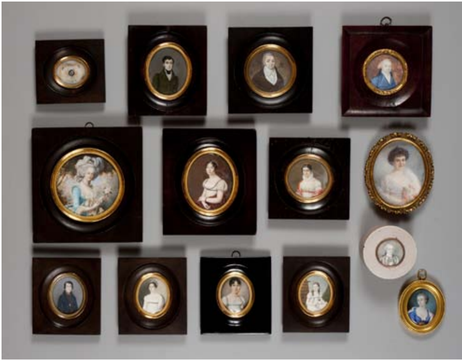
Collection de miniatures