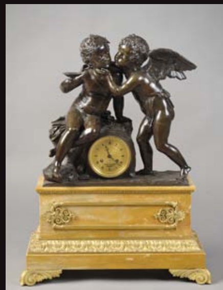
Cupidon et Bacchus, XIXe