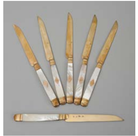
Bijoux, montres, objets d'art et de vitrine