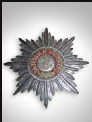
Ordre d'Alexandre Nevski