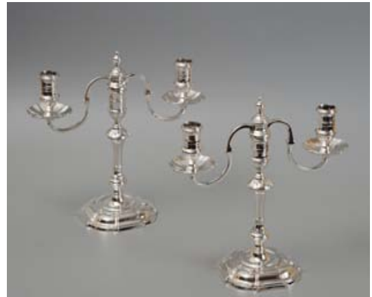
Argenterie, XVIIIe et XIXe