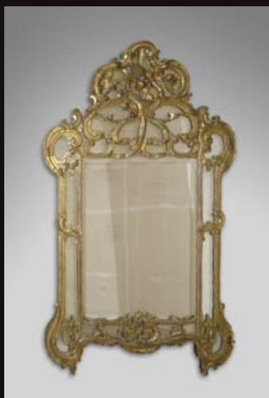
Miroir à parecloses XVIIIe

VENTE INAUGURALE de NOËL DIMANCHE 09 DÉCEMBRE 2012 à 15h