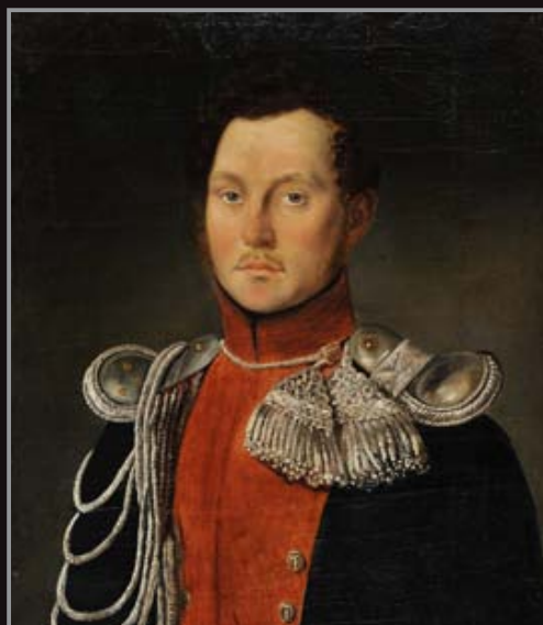
Portrait d'officier daté 1836