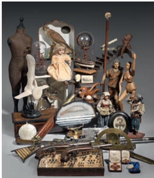
VENDREDI 6 JUIN, SALLE 15 CABINETS DE CURIOSITÉS.