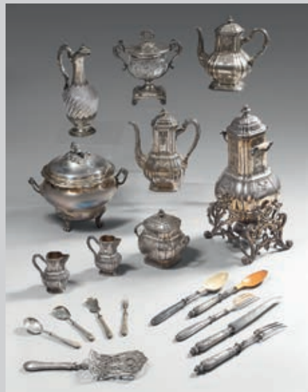
VENDREDI 24 JUIN, SALLE 8 ARGENTERIE, OBJETS DE VITRINE ET MONNAIES.