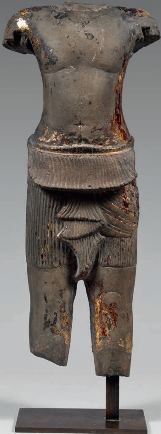
215. Buste d'homme debout en grès sculpté à traces de laque or, la taille ceinte d'un smpot plissé légèrement mouvementé avec un pan retourné sur la ceinture, dont se prolonge la double chute descendant jusqu'à la limite inférieure du vêtement à l'entre cuisse. Période Khmère, ANGKOR VAT, XIIème siècle. Haut. : 52 cm. 5.000/6.000