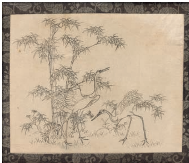
253. Ensemble de sept petites estampes, oiseaux et fleurs. Japon, époque MEIJI (1868-1912). Encadrées sous verre.