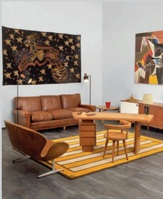
LUNDI 16 JUIN, SALLES 10 ET 16 ARTS DÉCORATIFS DU XXÈME SIÈCLE.