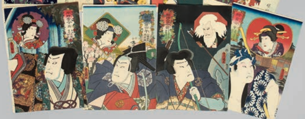
271. Ensemble de onze dont six oban tate-e de la série Kenyu fujo kagami , miroir de femmes sages et courageux, représentant des jeunes femmes et samourai. Kuniyoshi (1797-1861). 400/600 Voir la reproduction.