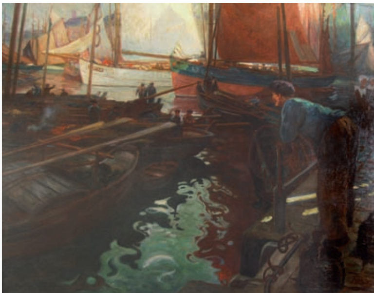
64. Paul RUTY (1863-?). Le port des Sables d'Olonne. Huile sur toile signée en bas à droite. 132 x 162 cm. 5 500/6 000 €