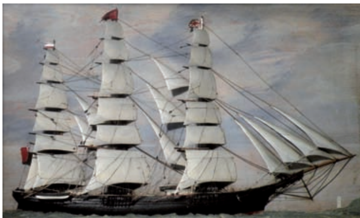
166. Demi-coque voilée sous vitrine, présentée en diorama. Trois mâts carré sous grande voilure, coques et voiles en bois sculpté et peint. Art populaire maritime, 19 e siècle.