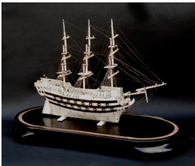
97. Maquette en os, ivoire et textile. Vaisseau de 34 canons sous grément dormant (restauré). 19 e siècle. Longueur : 31 cm, hauteur : 24 cm. Globe en verre sur socle en bois noirci. 8 000/10 000 €

C'est au père d'Albert, Léon Seville que la Marine Nationale demanda de dessiner un bateau pour le service de la rade de Toulon. Le résultat n'était guère différent du moure de pour alors utilisé, pincé à ses extrémités, Bien que marqué par des lignes d'eau plus fines et une étrave tulipée, six hommes restaient nécessaires à sa manoeuvre. Cette œuvre rend hommage à la qualité d'architecte naval de Léon Seville.