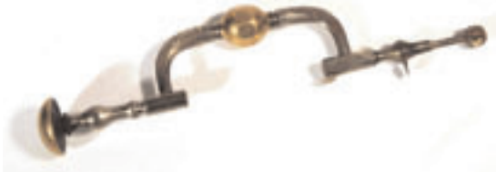
172 - Trépan en ébène et fer forgé. France, début 19ème siècle. 150/200 €