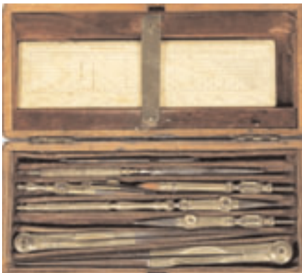
221 - Coffret d'instruments techniques en laiton et ivoire. Sur trois étages : compas et tire-lignes, règles parallèles en ébène et laiton. Coffret signé W. H. HARLING à Londres, Angleterre C.1900. Coffret en acajou. 4,5 x 11 x 22 cm. 200/250 €