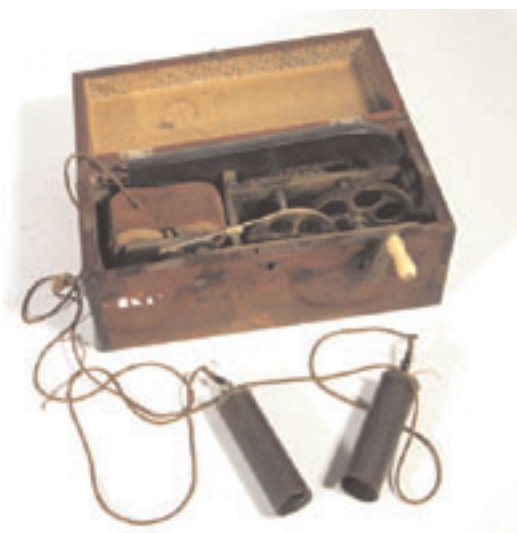
171 - Machine magnéto-électrique à usage médical. Coffret en acajou avec accessoires. Milieu 19ème siècle. 150/200 €