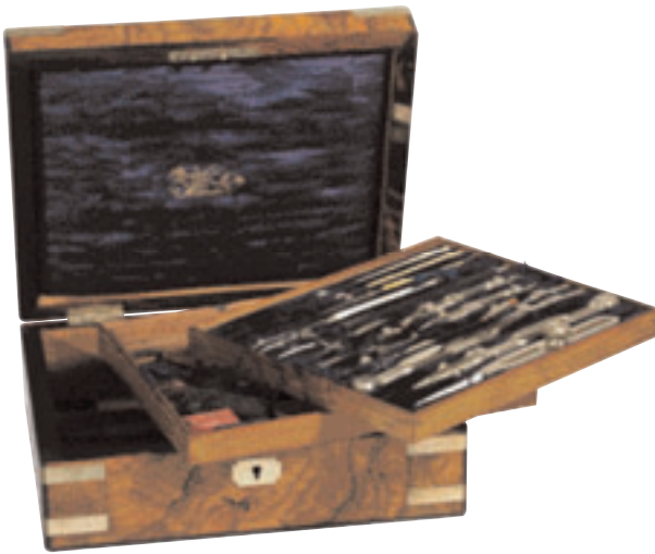
218 - Coffret d'instruments de dessin technique en eternum et ivoire. Trois étages dont : compas, compas de réduction, tire-lignes ... couleurs pour lavis, règles en ivoire. Coffret en loupe corné en métal et incrusté de filets en ébène. Signé Stanley à Londres, Angleterre C.1900. 7 x 18 x 21 cm. 400/500 €