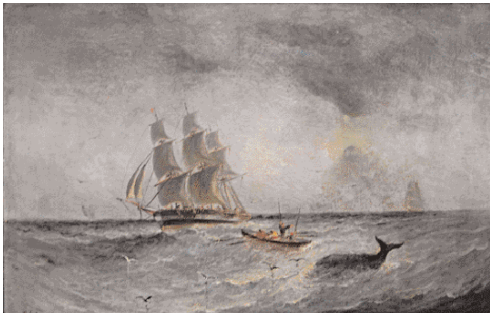
139 - Paul SEIGNON (19ème siècle) Baleinier sur les lieux de chasse. Huile sur toile signée en bas à gauche. 54 x 80,50 cm. 3 000/3 500 €