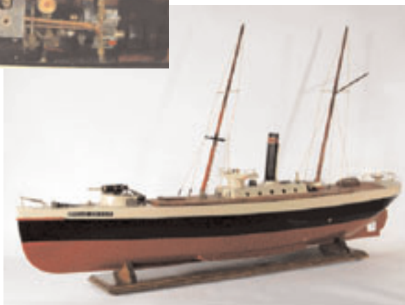
142 - Maquette de navire baleinier Queen Helga en bois peint. Modèle navigant équipé d'une machine à vapeur vive. Longueur : 113 cm. 1 500/2 000 €