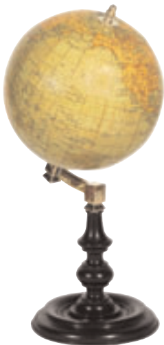
92 - Globe terrestre. Monture inclinée sur un pied en bois noirci. Signé G. THOMAS à Paris. Circonférence 12 cm. Hauteur : 24 cm. 250/300 €