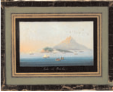
76 - Ecole napolitaine vers 1900. Iles de la Baie de Naples. Deux gouaches formant pendant titrées "Isola de Procida" et "Isola de Nicita". Chaque, 8 x 12 cm. 400/500 € la paire