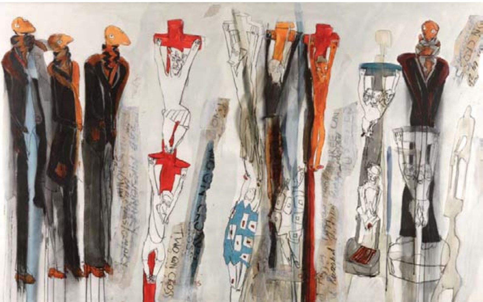
24 - Berry Bickle, Hommage to Zephania Tshuma , 1994, 130 x 180 cm, huile, encre, collage et aquarelle sur papier, signée.