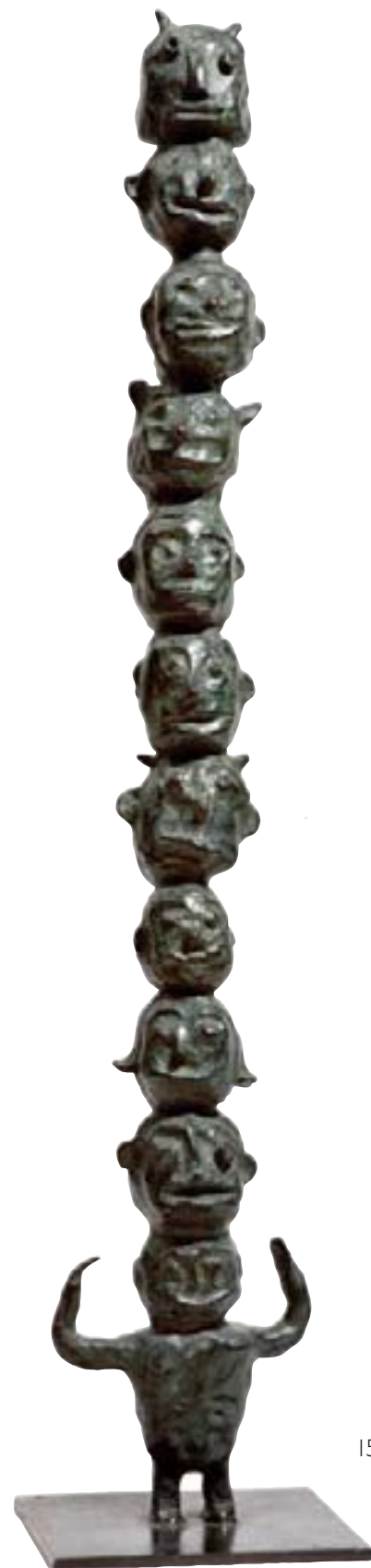
14 Totem de têtes , épreuve bronze 95 x 19 cm, signée à la base.