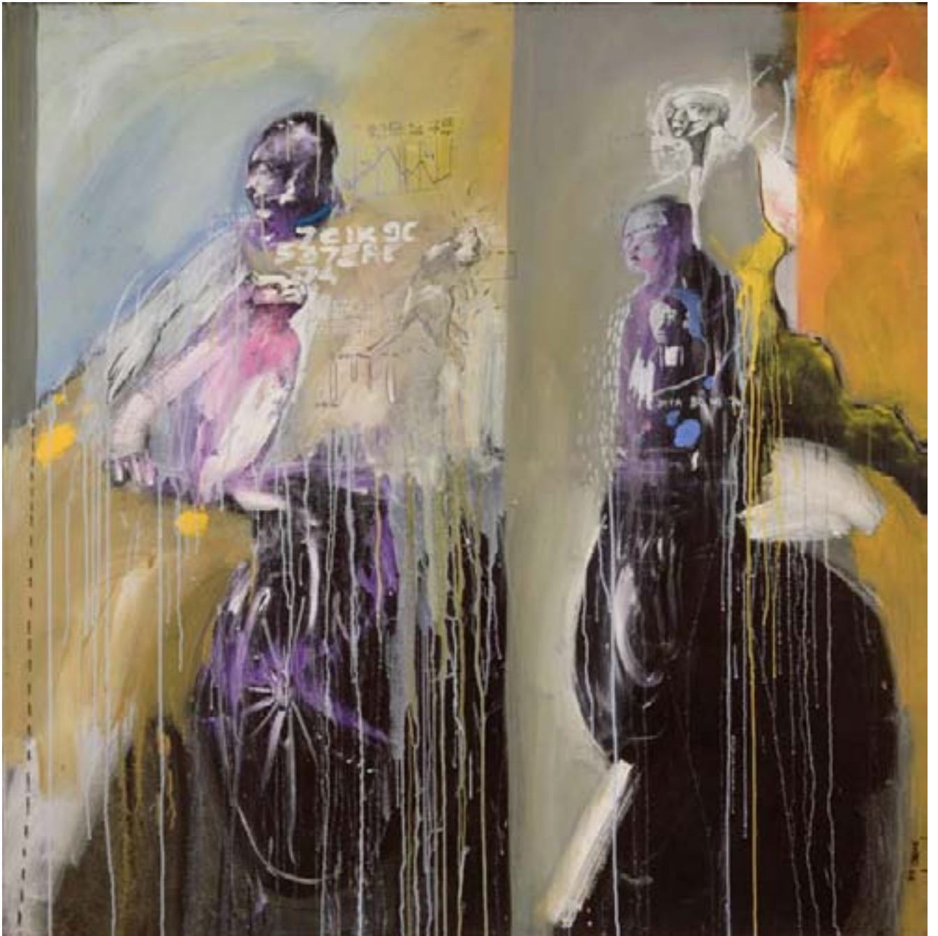
47 - Soly Cissé - Renaissance, 150 x 150 cm