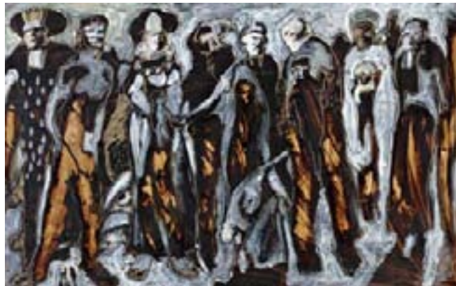
46 - Soly Cissé, Les Visiteurs, Crayon et fusain sur papier 79 x 105 cm