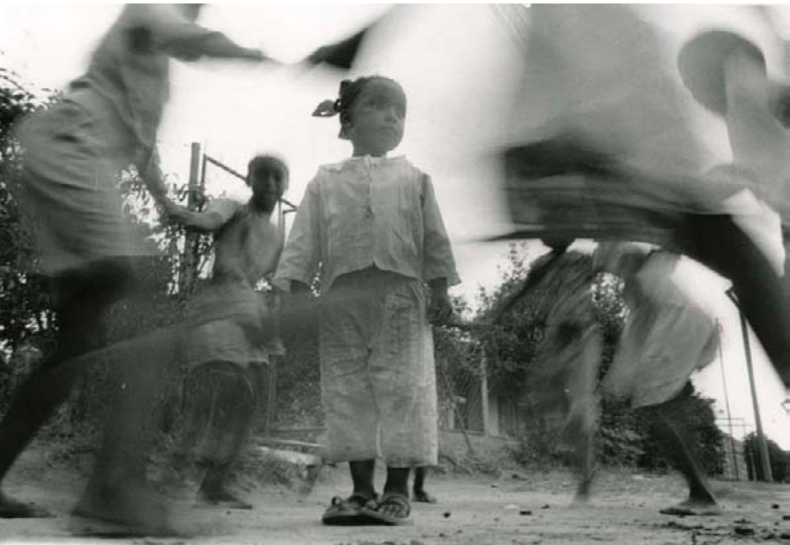
64 La ronde , tirage unique n&b, sur PVC, 75 x 50 cm

Diplômé de l'école Polytechnique de photographie d'Harare. Calvin Dondo cherche l'identité urbaine des gens, dans leurs vêtements, leurs gestes, leur façon de traverser la rue, dans les constructions, dans leurs regards, leurs peurs. Beaucoup de gens, regardants et regardés. Free- lance depuis 10 ans, il photographie la ville, de la périphérie au centre, théâtre de la vie au quotidien.