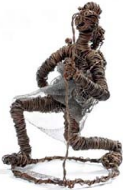
25 Mother and Child Métal et matériaux divers h. 45 cm 26 Refugees Métal et matériaux divers h. 90 cm 27 Travelling mother métal et matériaux divers h. 30 cm 28 On his way home métal et matériaux divers h. 48 cm Sculptures signées sur la base