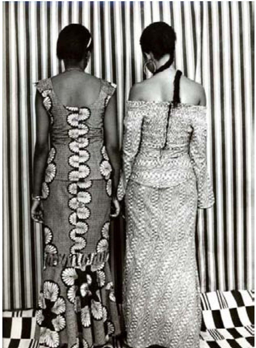
106 - Malick Sidibe, Vue de dos