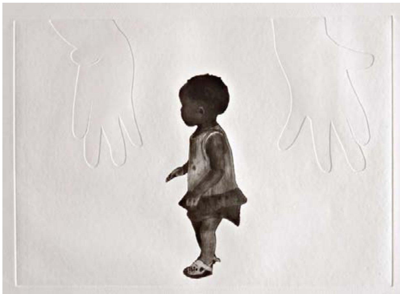
97 Thakana , encre sur papier, 40 X 50 cm, exemplaire unique signé, 2004

Centre national de l'Estampe et de l'art imprimé, Chatou, France, 2003