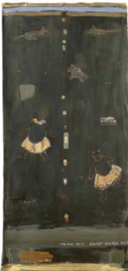
34 Tableau noir n° 05 acrylique et pigments sur bois, 2002, 165 cm x 98 cm