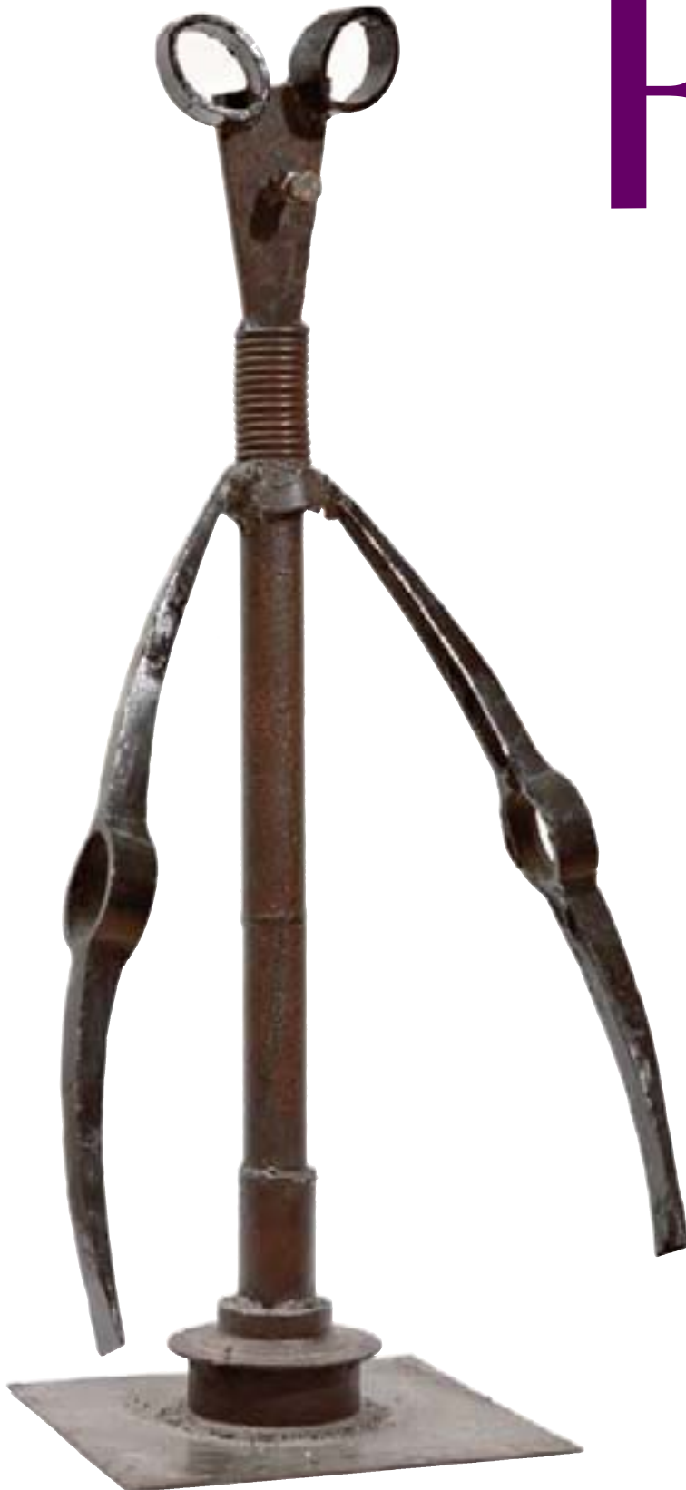
63 Mumuyé 95 x 40 cm Métal Signée à la base

R ichard dit « Buddy » Di Rosa est un autodidacte, il ne se limite ni à un pays ni à un savoir faire artistique. Curieux de tout, il s'intéresse aussi bien à la statuaire africaine qu'à la beauté plastique des femmes, au génie de la récupération qu'aux objets rituels. Buddy séjourne plusieurs fois en Afrique entre 1997 et 2001.