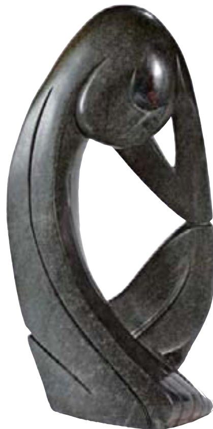
83 Thinker, 2005, serpentine, signée