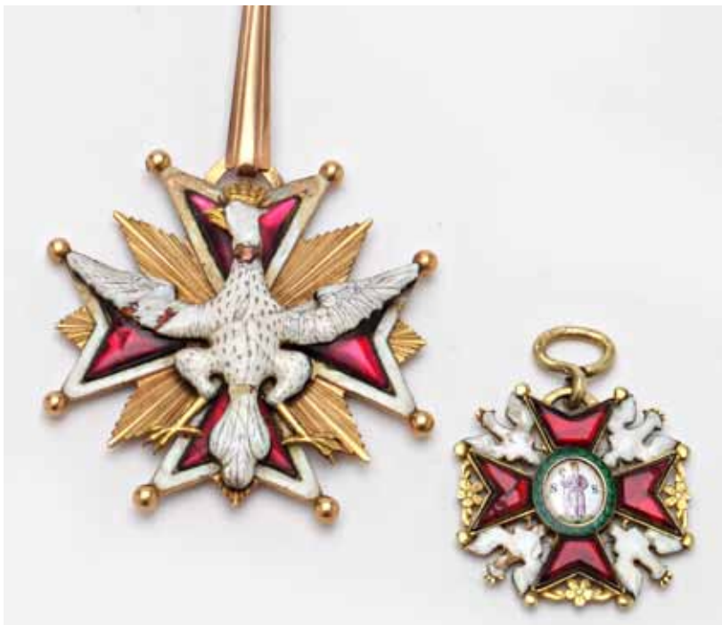
97 - 98