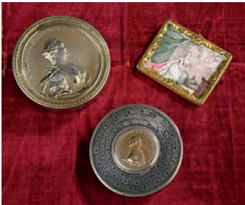
105, 106, 107