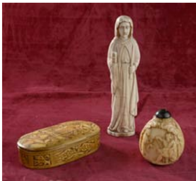
161, 162, 163

163 - PULVÉRIN en ivoire sculpté représentant d'un côté le meurtre d'Abel par Caïn et, de l'autre, la reine de Saba devant Salomon, dans un entourage feuillagé. (usures, bec verseur remplacé par un bouchon). XVII e siècle. H. 5 cm 600/800