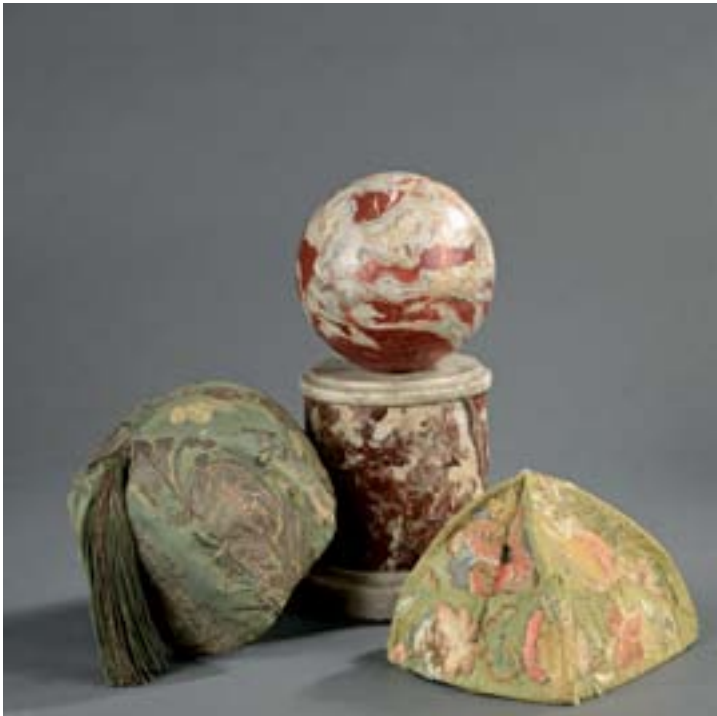
194, 193, 195

193 - PORTE-PERRUQUE en marbre incarnat turquin, il repose sur un socle cylindrique mouluré de marbre blanc. XVIII e siècle.