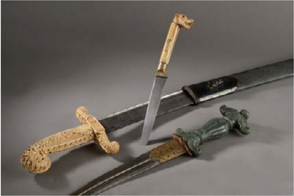
101, 102, 100

100 - POIGNARD, jambiya à monture sculptée de palmes. Lame courbe en acier damassé à arête centrale, au talon incrusté d'or d'un damier meublé de rosettes et tiges fleuries. Poignée en jade vert céladon sculptée en forme de balustre foliée, ornée de palmes achevées en volutes à la base et au sommet et coiffée d'un bouton. Fourreau en bois sombre à garniture en métal doré.