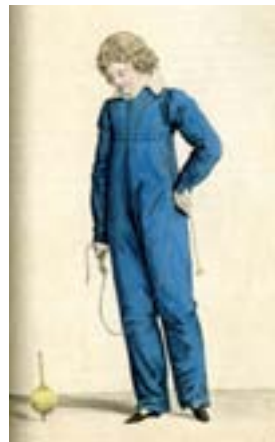
Journal des Dames et des Modes , 1813. Costume parisien, pl. n° 1350

202 - COSTUME DE GARÇONNET, vers 1810-1820, costume d'allure martiale dit à la matelot en ratine rouge. Veste à manches courtes et col rabattu à petits revers garnie de lignes de boutons grelots métalliques à la façon d'un dolman. Boutons sur la taille retenant le pantalon et sur les hanches pour fermer deux fentes profondes, doublure dans un petit façonné soie. (quelques trous et taches).