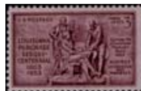
Timbre postal américain édité pour le 150 e anniversaire de la cession de la Louisiane figurant Marbois, Monroe et Livingstone signant l'accord.