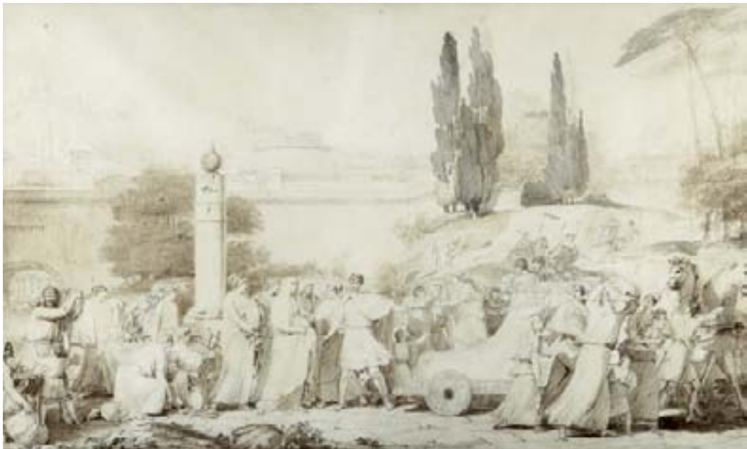
14 - Victor Maximilien POTAIN (1760-actif jusqu'en 1798) Tibère présentant au Sénat les fils de Germanicus Fabius faisant monter les vestales dans son char Lavis brun et gris sur trait de crayon noir, quelques retouches de plume et encre brune. Signés et datés 1793 en bas à gauche. 53,5 x 88,5 et 53,5 x 86 cm 10 000/12 000

EXPOSITION : Salon de 1793. Victor Maximilien Potain fut Grand Prix de Rome en 1785.