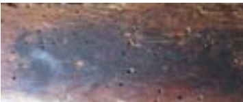
Marque des Tuileries sous la Restauration.

236 - FAUTEUIL à dossier plat en bois mouluré, accotoirs en coup de fouet, pieds cambrés.