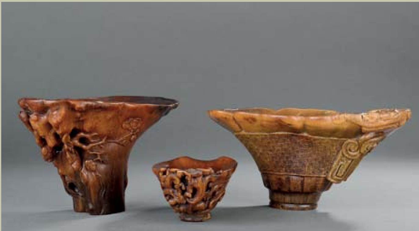
Coupes libatoires en corne de rhinocéros sculptée, Chine, XVII e et XVIII e siècles.

Vente le 14 décembre 2013, Drouot salle 9