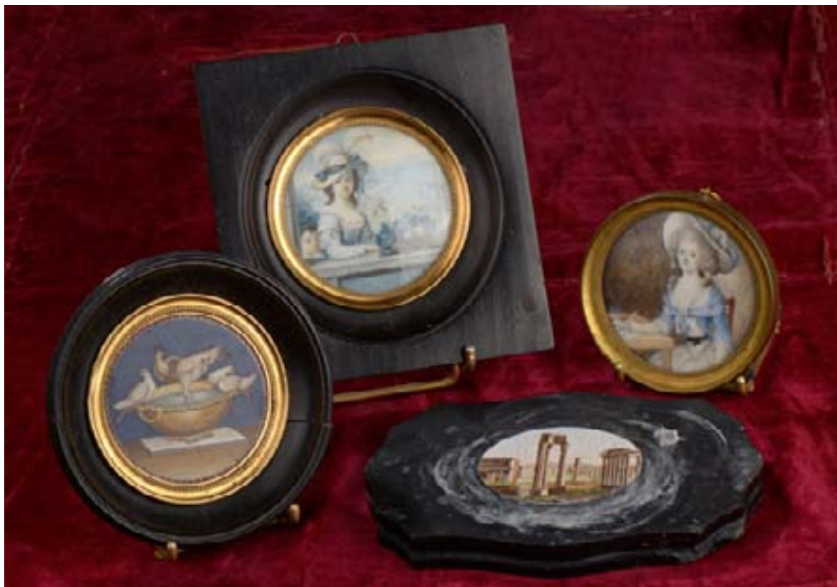
187, 188, 189