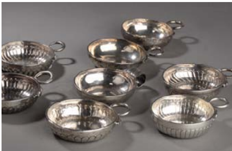
114 à 117