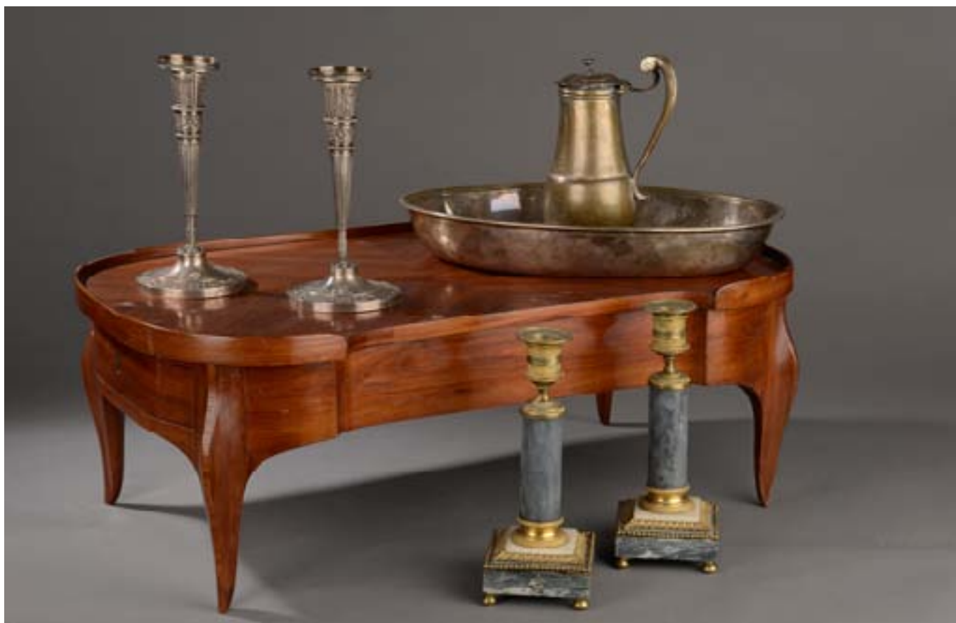
174, 175, 176, 177

174 - PAIRE DE FLAMBEAUX en argent, le fût en carquois cannelé. Ils reposent sur une base ronde ornée d'une frise de rosaces alternées de foudres.