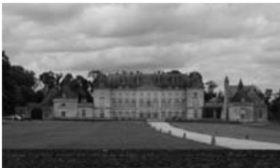
Château de Montgeoffroy

245 - COMMODE en placage de bois de rose dans un encadrement d'amarante. Elle ouvre en façade à trois tiroirs à léger ressaut central ; pieds cambrés. Dessus de marbre rouge des Flandres.