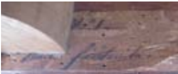
Étiquette de livraison du XVIII e siècle : "N o 1. huit fauteuils."