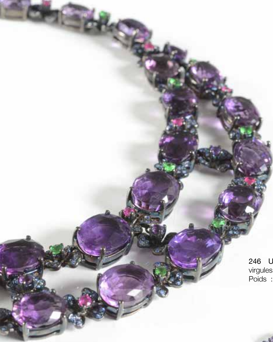
246 Une paire de bracelets en or jaune 18 K, ciselés de motifs en virgules. Poids : 81,50 gr 1 500/1 800 €