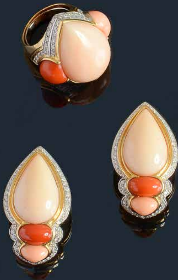
130. REPOSSI. Demi-parure en or jaune 18K comprenant : une bague ornée d'un corail cabochon peau d'ange taillé en goutte, épaulé de deux cabochons, l'un de corail rouge, l'autre de corail rose, la monture soulignée de lignes de diamants ; une paire de clips d'oreilles assortis. Signée. Poids brut : 53,9 g