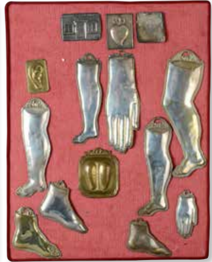
221. Collection de 80 Ex voto en metal argenté découpé et repoussé. XIX e siècle Présenté sur 5 plateaux en velours cramoisi. 1 500/2 000 €