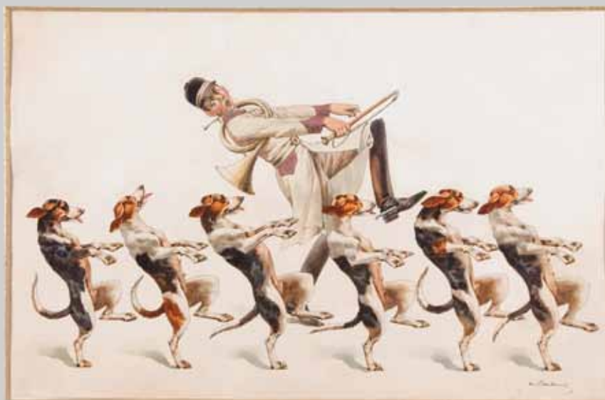
LA DANSE DE CAKE-WALK