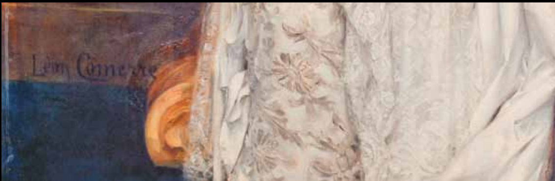
Détail de la signature