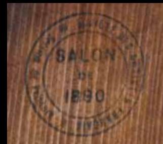
Tampon au dos du châssis