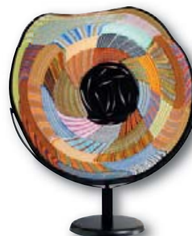
128. M. SCHIAVON Black Tribe , H : 75 cm, L : 65 cm.