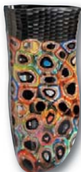
134. M. SCHIAVON Flowers , H : 46 cm, L : 23 cm.