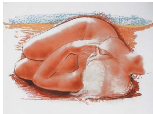
51. Baigneuse , 50 x 65 cm.

Artiste français d'origine italienne, il fut à la fois sculpteur, dessinateur et graveur. Après des études aux Arts Décoratifs de Nice, il intègre les Beaux Arts de Paris. Chaque jour, il dessinait d'après des modèles vivants souvent à la sanguine, toutes les études lui permettaient de mieux analyser les volumes. Volti a consacré sa vie à célébrer la femme : « ce qui m'intéresse c'est moins la femme que son architecture... ». Une première rétrospective de son œuvre a lieu à Paris en 1957 et il est honoré d'un musée-fondation à Villefranche-sur-Mer. De plus, ses sculptures figurent sur la place de nombreuses villes françaises telles que Paris, Angers, Orléans et de nombreux musées internationaux.