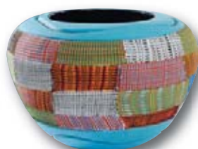
123. M. SCHIAVON Black Tribe , H : 21 cm, Diam : 28 cm.