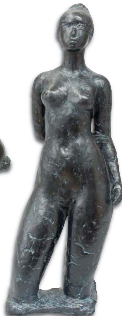
53. Femme au chignon , 55 x 18 x 13 cm.