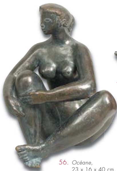
56. Océane , 23 x 16 x 40 cm.