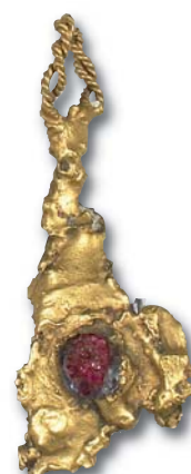
115. CONSTANTIN Cyril, Pendentif sculpture.