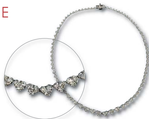
151. Collier or gris à motif de cœurs en chute sertis de diamants (8 cts env.).