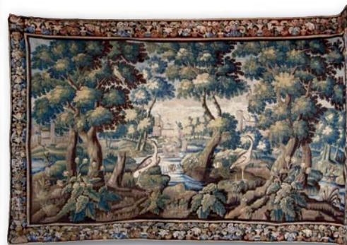
206. Très importante tapisserie d'Aubusson : Verdures animées de volatiles et château dans la perspective, 280 X 480 cm.