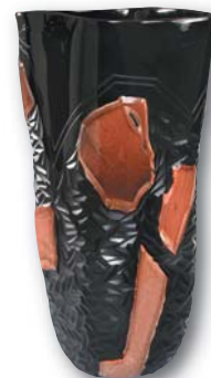
135-1. M. SCHIAVON Aventurina , H : 50 cm, Diam : 28 cm.