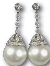
150. Paires de pendants d'oreilles sertis en pampille d'une perle de culture de 17 de diam. Et diamants.