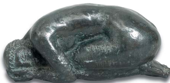
57. Pierra , 32 x 16 x 12 cm.