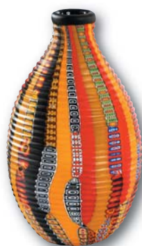
135-2. M. SCHIAVON Black Tribe , H : 24 cm, Diam : 14 cm.