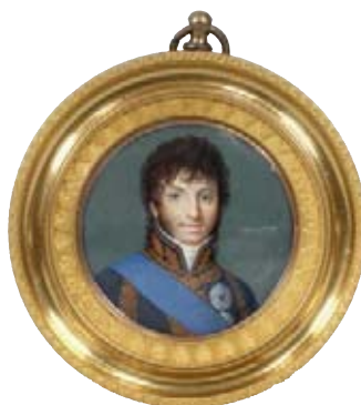
173. GRIFONE dit Griffon Ulisse (actif vers 1808-1835) Murat, roi de Naples.