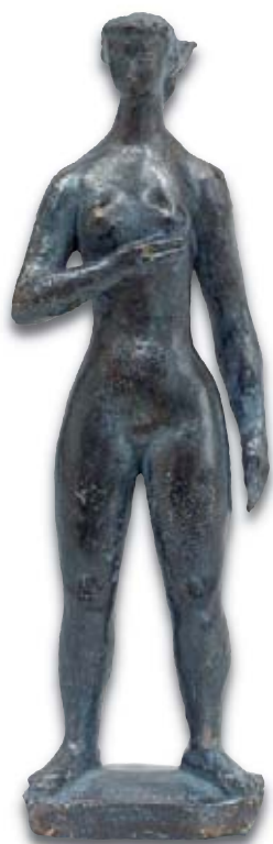
54. Nu debout , H : 32,5 cm.