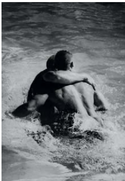
62. Fred GOUDON (1965) Aqua , Tirage argentique 1/8 – 40 x 30 cm.