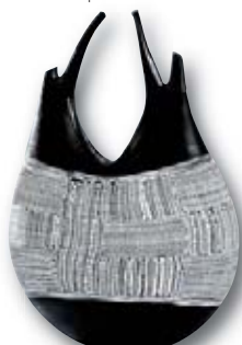
127. M. SCHIAVON Africa , H : 48 cm, L : 33 cm.