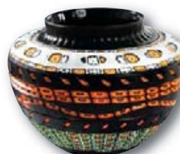
133. M. SCHIAVON Spirali , H : 48 cm, L : 29 cm.