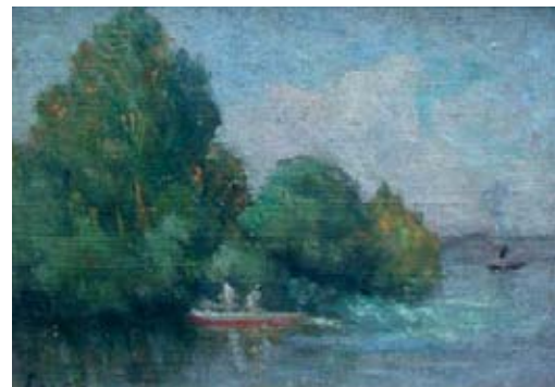
22. Maximilien LUCE (1858-1941) Barque en bord de Seine , Huile sur toile, 24 x 33 cm.