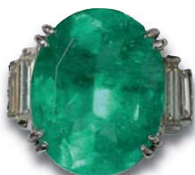
152. Bague émeraude de 14 cts env. épaulé de diamants baguettes.