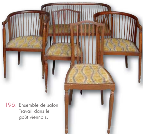
196. Ensemble de salon Travail dans le goût viennois.