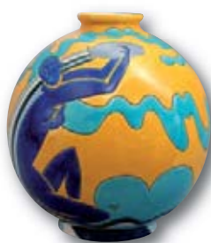
191. LONGWY Boule coloniale Verseau, H 38 cm.