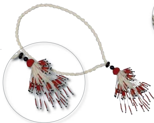
139. Sautoir de perles de cultures d'eau douce tressées rehaussé d'un pompon en corail, onyx et perles.