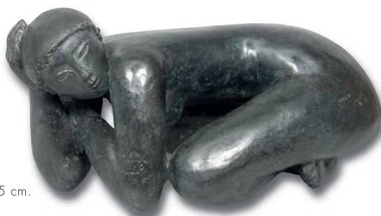
55. Grenouillère , 28 x 48 x 65 cm.