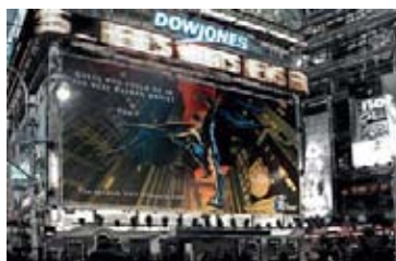
68. Dominique OBADIA (XX e XXI e ) Batman , Dibond et plexi 1/3, 120 x 76 cm.