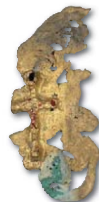
106. CONSTANTIN Cyril, Pendentif.