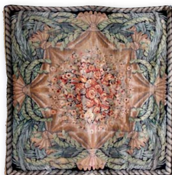
207. Tapis Art-déco à décor géométrique sur fond vieux rose, 245 x 250 cm.