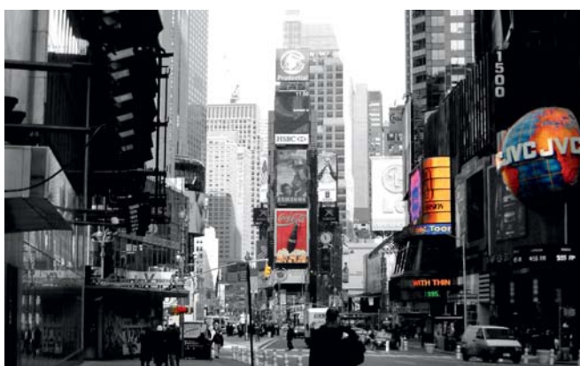
69. Dominique OBADIA (XX e XXI e ) Time Square , Dibond et plexi 1/3, 120 x 76 cm.