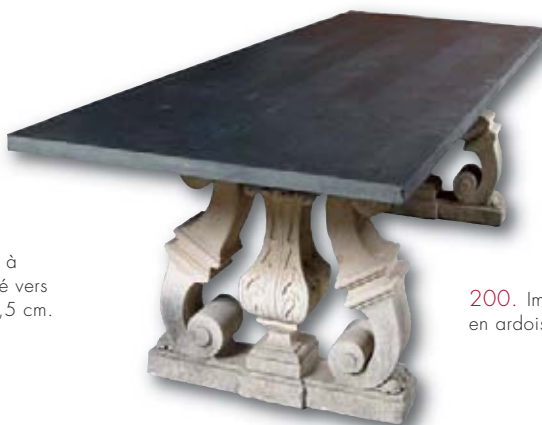
200. Importante table en ardoise et pierre.