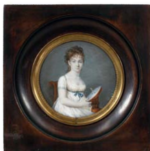
175. LOUSIERS S (active à la fin du XVII e siècle) Jeune femme assise de 3/4 droite.