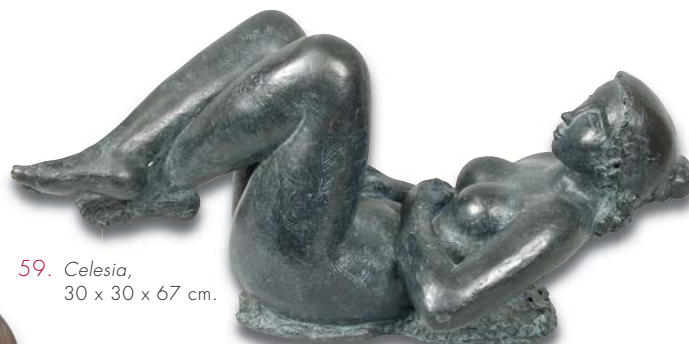
59. Celesia , 30 x 30 x 67 cm.