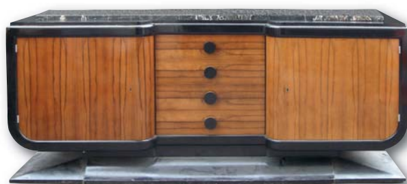
198. Buffet bas en bois teinté et placage de zébranob 98 x 228 x 53 cm.