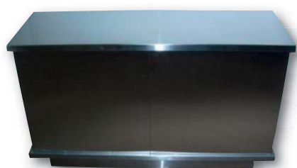
197. Paul LEGEARD Meuble à musique en acier brossé vers 1970, 75 x 127 x 44,5 cm.