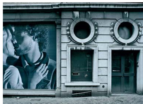
65. Didier LAFLEUR Couple-hublot .