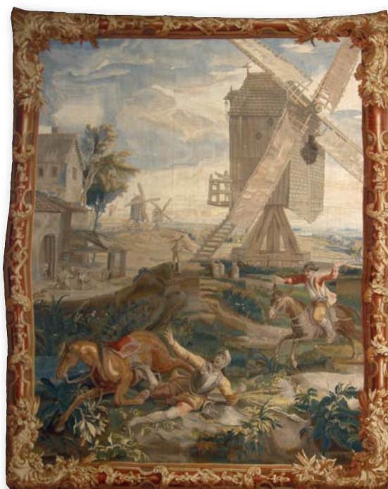
205. Rare et importante tapisserie de Bruxelles, d'après le roman espagnol de Miguel de Cervantes Saveria : L'histoire de Don Quichotte de la Mancha. Début XVIII e siècle, 330 x 200 cm.