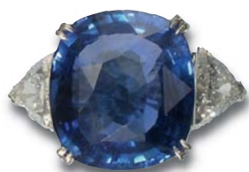
156. Bague saphir de Ceylan de 15,21 cts épaulé de deux diamants troida (1,8 cts).