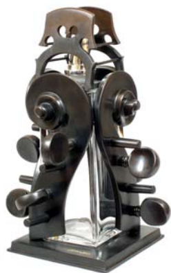
31. ARMAN (1928-2005) Cristal de Baccarat, bronze , Fonte Bocquel, H : 27 cm.