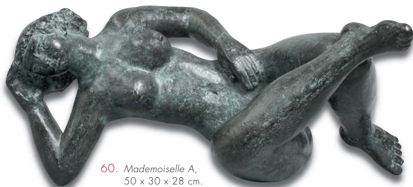
60. Mademoiselle A , 50 x 30 x 28 cm.