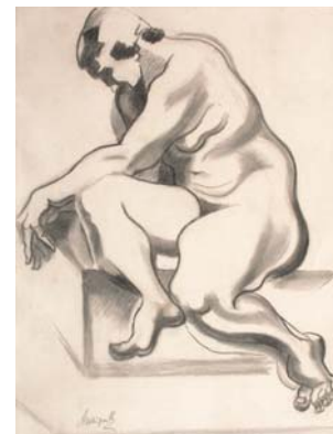
06. ARCHIPENKO Alexander (1887-1914) Nu de profil , 57 x 42 cm.