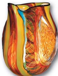
135. M. SCHIAVON Arlecchino , H : 40 cm, Diam : 23 cm.