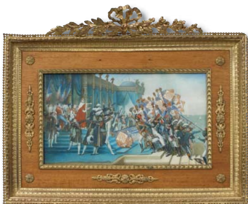
174. École Française vers 1860 Serment de l'armée après la distribution des aigles par l'Empereur le 5 décembre 1804, d'après David.