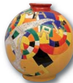
193. LONGWY Boule coloniale Paris, H 38 cm.