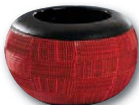
122. M. SCHIAVON Black Tribe , H : 20 cm, Diam : 27 cm.

Exceptionnel ensemble d'œuvres de Massimiliano SCHIAVON, né en 1971 à Murano.