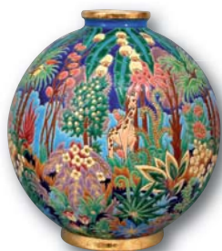
192. LONGWY Boule coloniale Amazonie, H 38 cm.