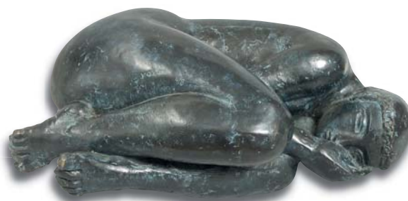
58. Femme couchée , 54 x 32 x 22 cm.