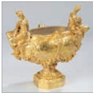
JARDINIÈRE en bronze doré à motifs de femmes et gerbes de blé. (base postérieure). Napoléon III. 50 x 54 x 32 cm