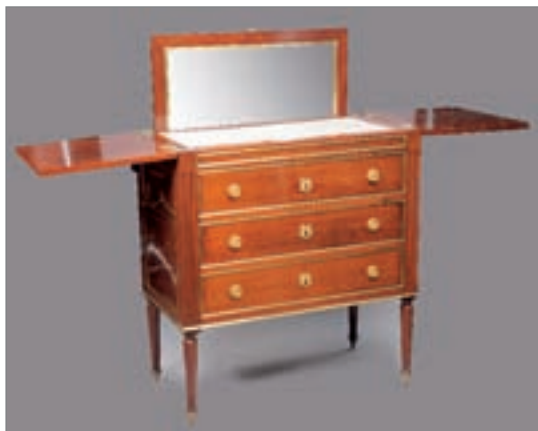
COMMODOE ECRITOIRE formant coiffeuse d'homme en acajou à filets de cuivre, ouvrant par trois tiroirs, le premier découvrant un casier et quatre tiroirs, le dessus ouvrant par deux plateaux découvrant un marbre blanc et un miroir coulissant.