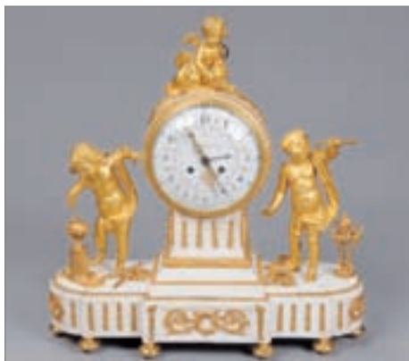
PENDULE aux « Amours géomètres » en marbre et bronze doré. Début XIX ème . 55 x 55 x 16 cm