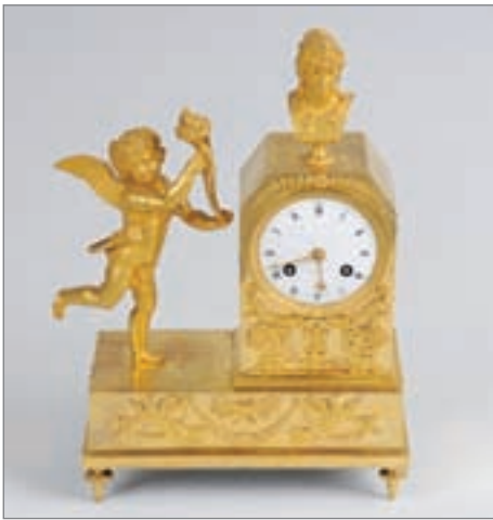
PENDULE en bronze doré à décor d'angelot et buste de femme. Début XIXème Siècle. 33 x 25 x 10 cm.