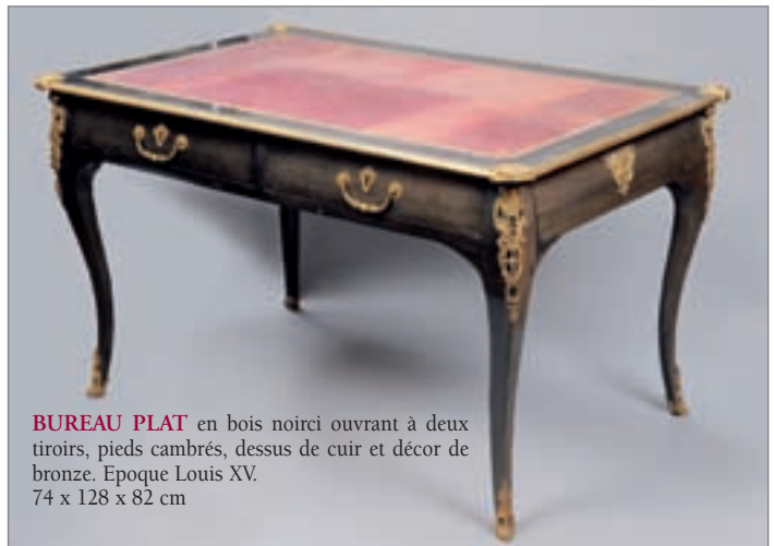
BUREAU PLAT en bois noirci ouvrant à deux tiroirs, pieds cambrés, dessus de cuir et décor de bronze. Epoque Louis XV. 74 x 128 x 82 cm