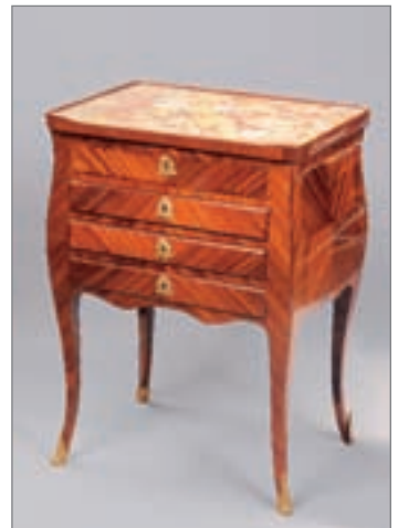
PETITE TABLE CHIFFONNIÈRE en marqueterie satinée, ouvrant à trois tiroirs, plateau de marbre d'Alep ouvrant et dissimulant deux casiers à portes, reposant sur quatre pieds cambrés. Epoque Louis XV. 74 x 55 x 40 cm