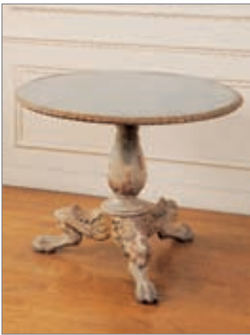
GUÉRIDON TRIPODE en bois doré et rechampi, plateau à contour sculpté, dessus de verre, pieds griffes. Travail ancien Italien. Ht : 68 cm, diam : 84 cm 2 500/3 000 €