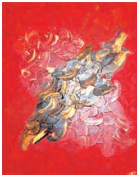
SOUSSANA CORINNE (ECOLE XXÈME SIÈCLE) : « Emotion Florale ». Acrylique sur toile. 100 x 80 cm. 2 800/3 000 €