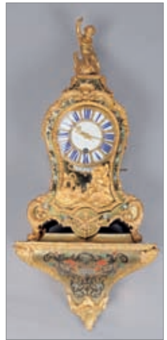
PETIT CARTEL D'APPLIQUE en marqueterie Boule à décor floral et incrustations. Cadran émaillé signé "Furet à Paris", sonnerie. Epoque Louis XV. Hauteur totale : 81 cm