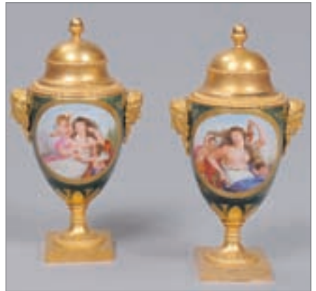
PAIRE DE VASES couverts Médicis en porcelaine polychrome et bronze doré à décor de femmes et têtes de Minerve. Epoque Restauration. Haut. : 27 cm. 1 200/1 500 €