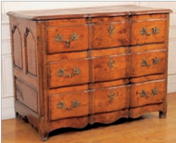
TRÈS BELLE COMMODE en noyer à façade arbalète ouvrant par trois tiroirs. Travail du XVIIIème siècle (restaurations). 100 x 131 x 68 cm 3 000/3 500 €