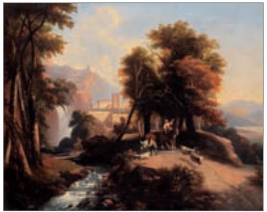
ECOLE FRANÇAISE DU XIXÈME SIÈCLE : « Berger et son troupeau devant un paysage de cascade ». Huile sur toile. Porte une signature en bas à droite : E. Roumens. 46 x 56 cm 800/1 000 €