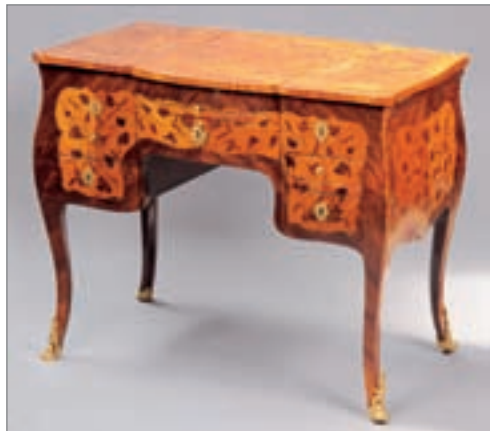
COIFFEUSE à caissons en marqueterie de bois de rose et violette et bois de bout, garniture de bronze doré.

Estampillée JLF Delorme, Epoque Louis XV.