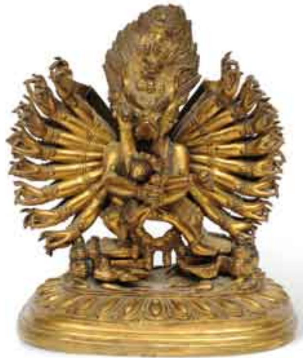
51 GROUPE EN BRONZE ciselé, doré représentant un Lama assis sur le lotus. Tibet, XV e -XVI e siècle. H_24,5 cm 3 000 / 5 000 € Provenance : collection privée.