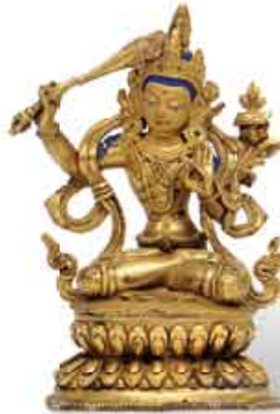
54 DEUX STATUETTES en bronze doré et laqué or Manjusri assis tenant une épée et tara assise. Tibet (petit accident). H_15 cm 3 000 / 5 000 € Provenance : collection privée.