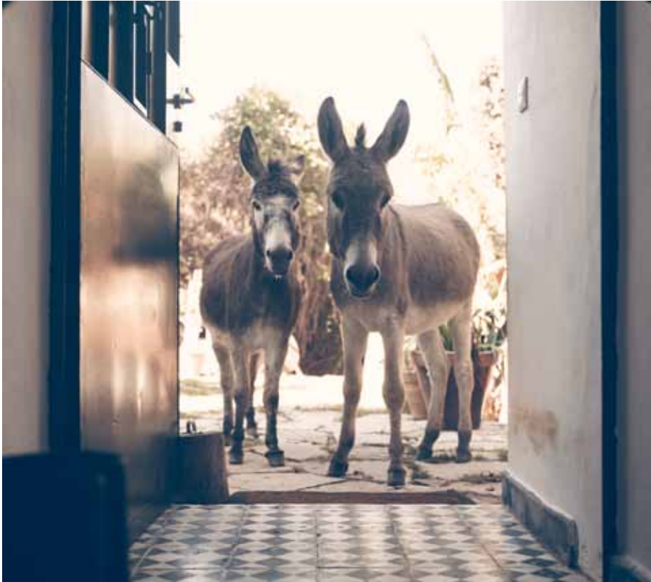
Iris and General Geranium, 2009 C-Print H 30 x L 40 cm