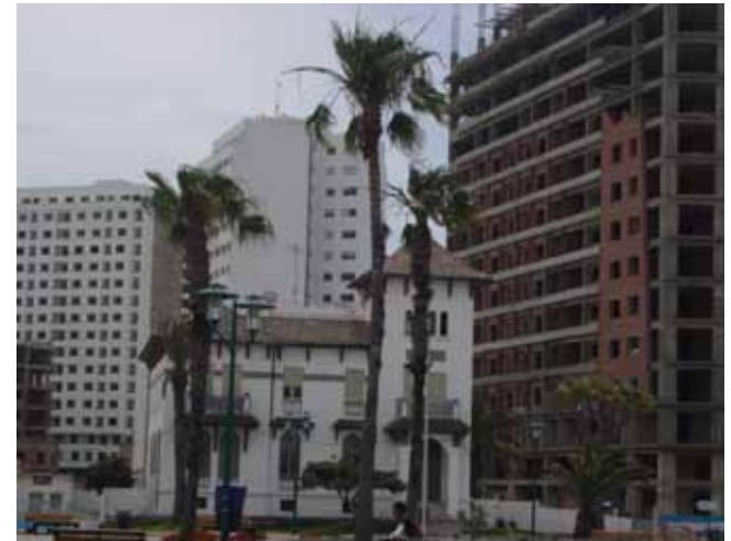
Résistance, 2008 C-Print H 20 x L 26 cm