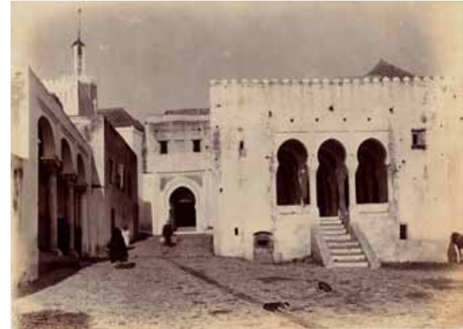
La place de la Casbah, Tanger, Maroc, circa 1890 -1900 Vintage print on gelatin chloride paper, stamped by the artist on print verso H 17,2 x L 23,8 cm