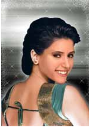
International Woman from Tangier, juin 2011 Digital C-Print Edition 1/8 H 50 x L 40 cm