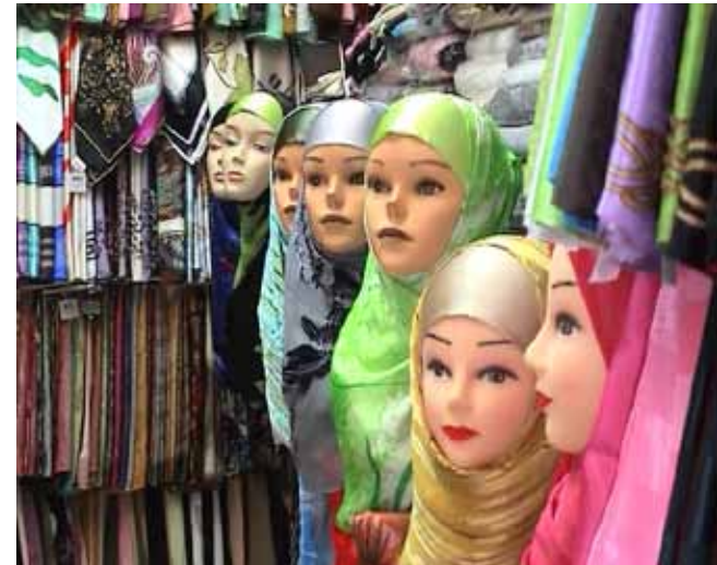
Dans la médina de Tanger, octobre 2010 C-Print Tirage unique H 30 x L 40 cm 300 / 400 euros