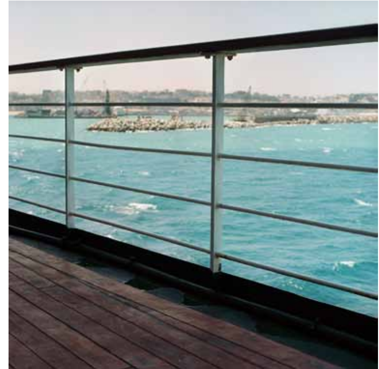
Tanger vu du bateau, arrivée avec mon père, 2005 C-Print H 15 x L 15 cm