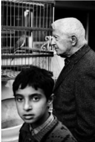
Paul Bowles, Tanger, 1991 Gelatin Silver Print H 30 x L 24 cm