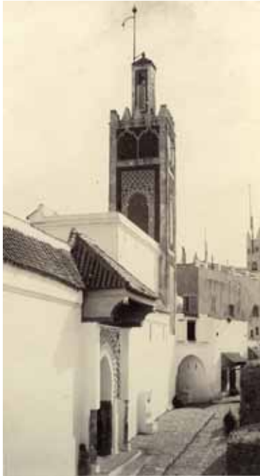
La Grande Mosquée de Tanger, circa 1880 Vintage albumen print H 21 x L 11,5 cm