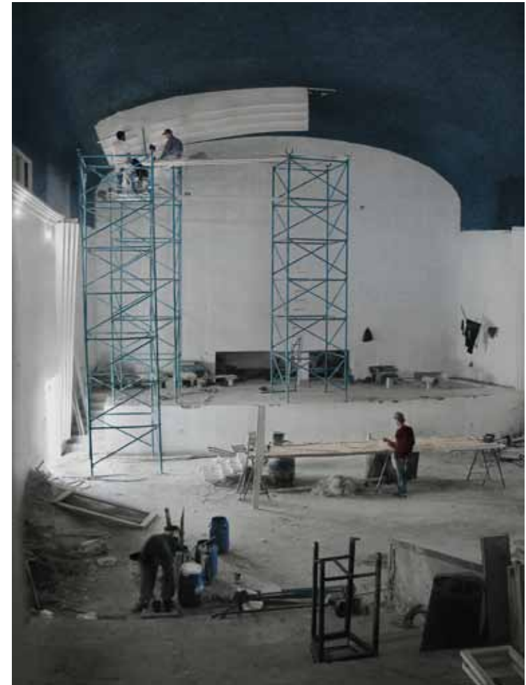
Cinéma Rif Tanger, L'arche, 2006 C-Print, Nylon latex coated Edition 1/3 H 150 x L 110 cm