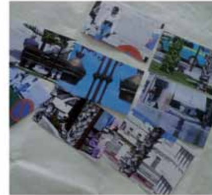
Place du 9 avril, vue du Cinéma Rif, juin 2011 Digital Print, coated paper H 50 x L 40 cm