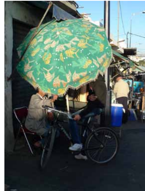
Untitled, 2010 C-Print H 51 x L 39 cm