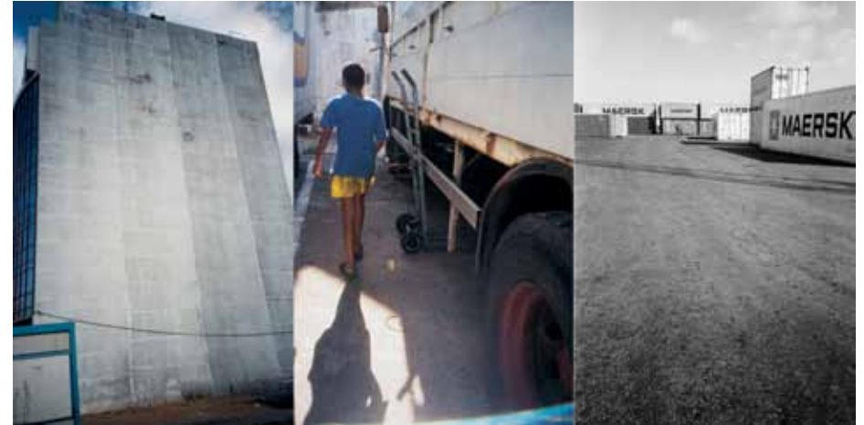
Tanger, juin 2001 Photographs and montage realised during the workshop by Yto Barrada, Anais Masson and Maxence Rifflet with the NGO Jeunes Errants (Marseille) and Darna (Tangier) Unique Print H 33 x L 86 cm