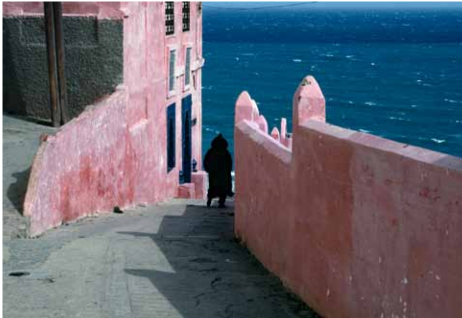
Vent d'Est à Tanger, 1995 Inkjet C-Print H 30 x L 40 cm