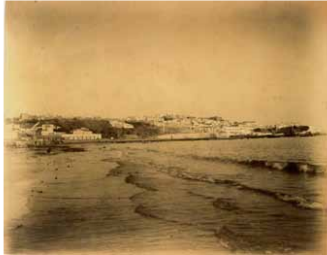
Tanger, vue prise depuis la baie, Maroc, circa 1880 Vintage albumen print, stamped by the artist on print verso H 18,7 x L 23 cm