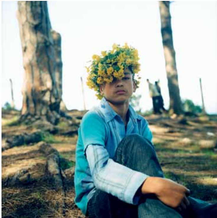
Oxalis Crown (Couronne d'Oxalis), 2006 C-Print Edition AP 1/2 H 125 x L 125 cm