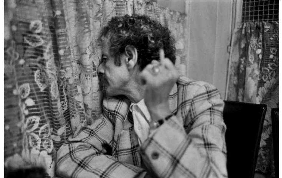
Mohamed Choukri, Tanger, 1987 Fine Art Pigment Print, printed 2011 Edition 1/8 H 24 x L 36 cm