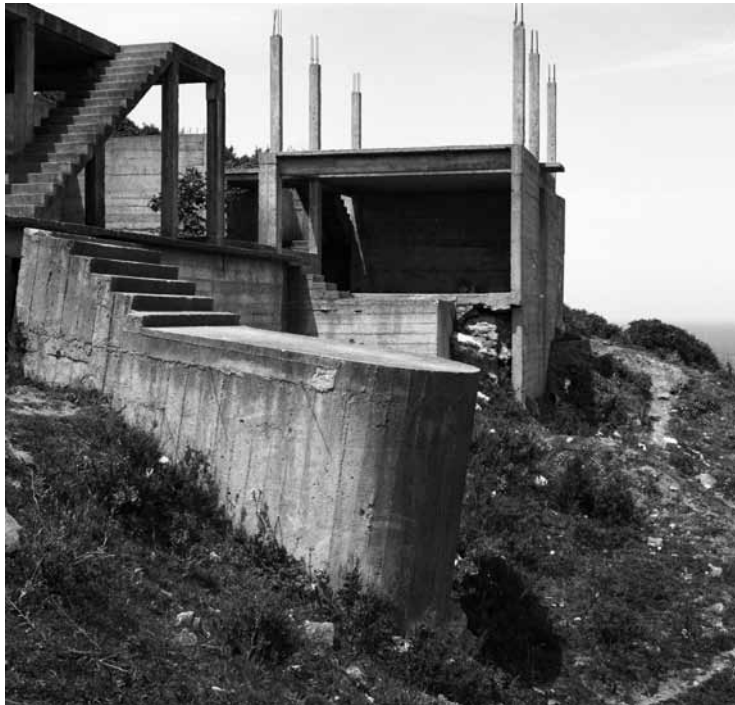
Sans titre, Tanger, avril 2001 Gelatin Silver Print Edition 1/1 H 98 x L 85 cm