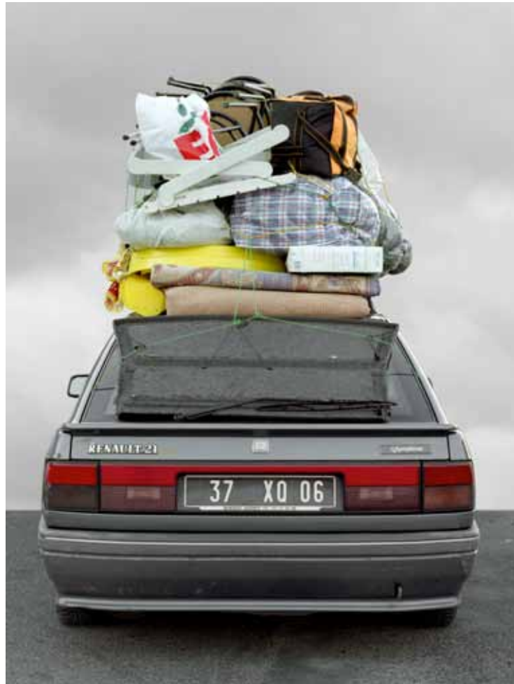
Cathedral Cars / Voitures cathédrale 37 XQ 06, 2009 C-Print Edition 2 / 50 H 40 x L 30 cm 200 / 300 euros