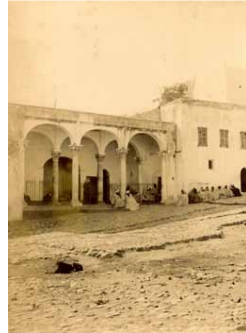
La Cour de justice, place de la Casbah, Tanger, Maroc, circa 1880 Vintage albumen print, location and titled on print verso H 21,1 x L 15,4 cm