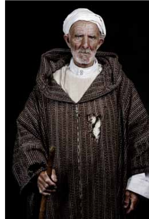
Les Marocains, Moussem de Moulay Abdessalam, 2010 C-Print Edition 3/7 H 92 x L 61 cm