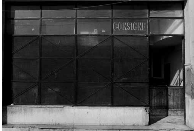
La consigne, avenue d'Espagne, Tanger, 2004 Gelatin Silver Print, Artist Print Edition 1/5 H 30 x L 40 cm