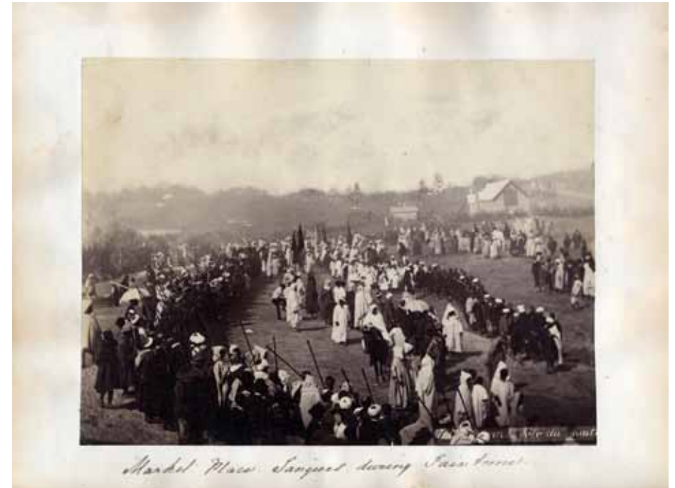
Market Place, Tangier, Morocco