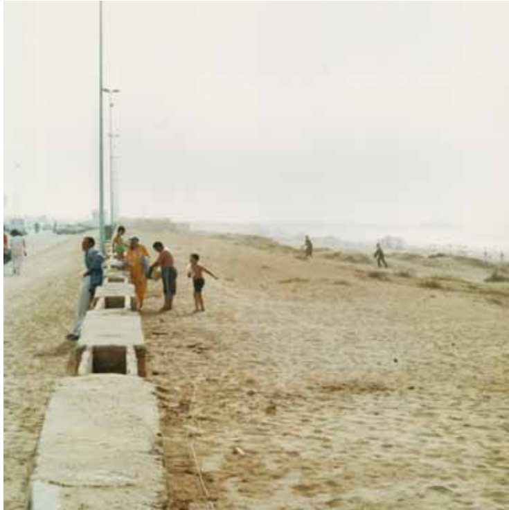
Il n'est de Terre #8, 2001 C-Print Edition 1/3 H 49 x L 49 cm