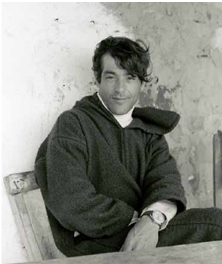
Mohammed M'Rabet Inkjet print on archival paper, printed 2008 for the book Spirits of Tangier Edition 1/5 H 40 x L 35 cm