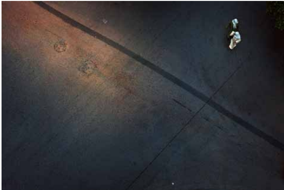
Ladies, 2009 C-Print Edition AP H 66 x L 91 cm