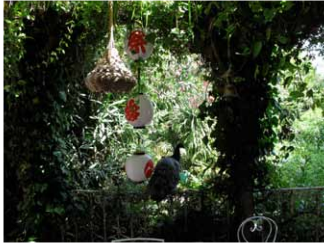
Dar Kharoubia, mai 2009 C-Print H 30 x L 40 cm 150 / 200 euros