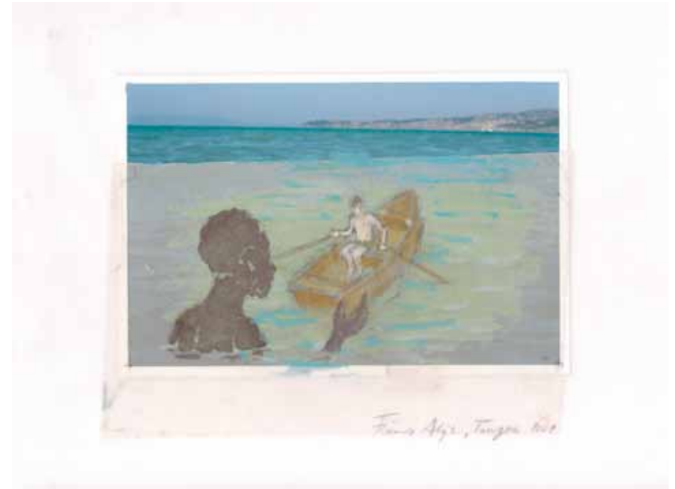
Don't cross the bridge until you get to the river, 2007 Pencil and oil on photograph and tracing paper Edition 1/1 H 25 x L 32 cm