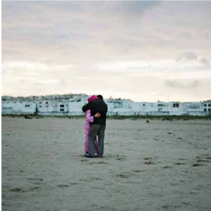
Tanger, avril 2011 C-Print Edition 1/5 H 60 x L 60 cm