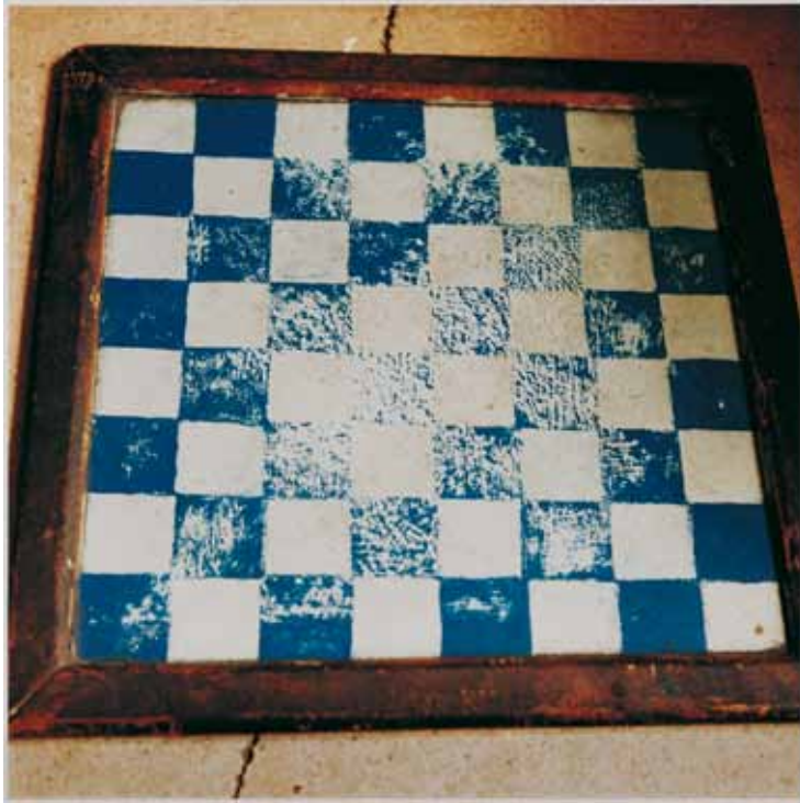
Tanger, 1997 (from Le Cartographe) C-Print Edition 2/10 H 80 x L 80 cm