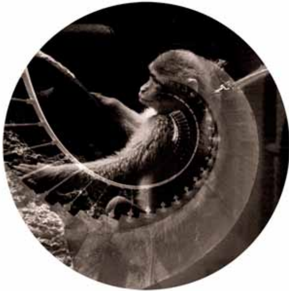
Hercule, juin 2011 C-Print Edition 1/1 H 40 x L 50 cm