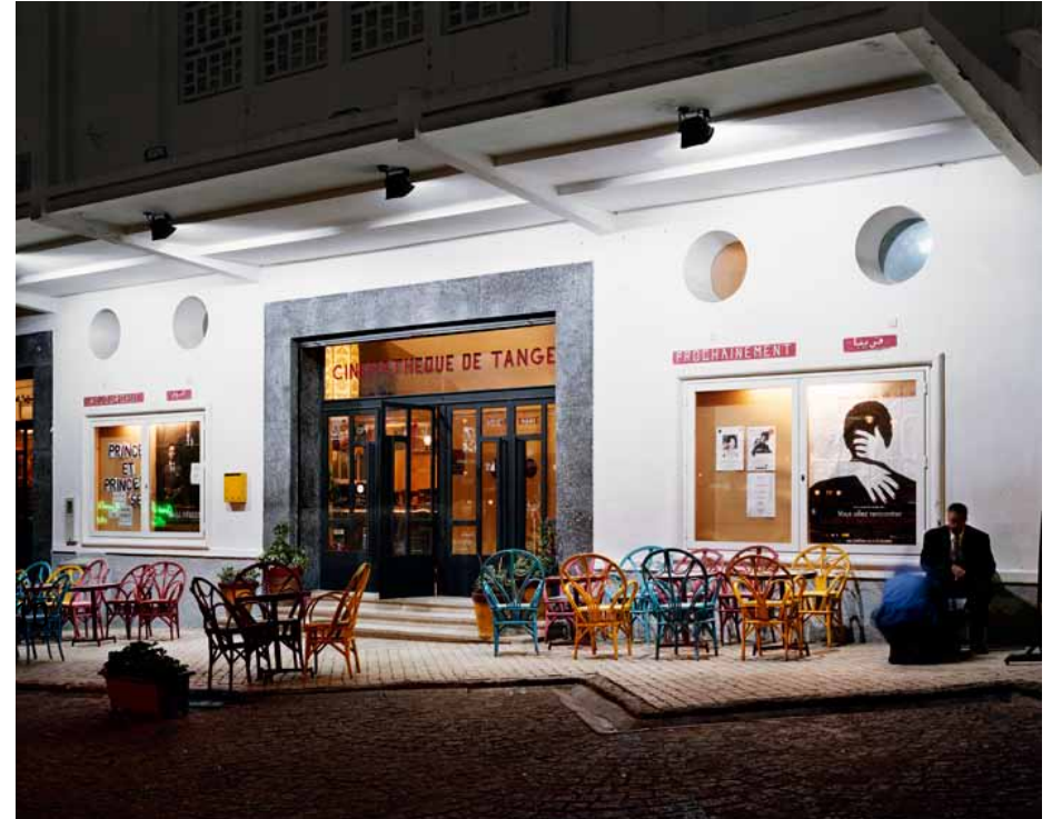
Cinémathèque de Tanger, 2010 C-Print Edition 1/5 H 50 x L 60 cm