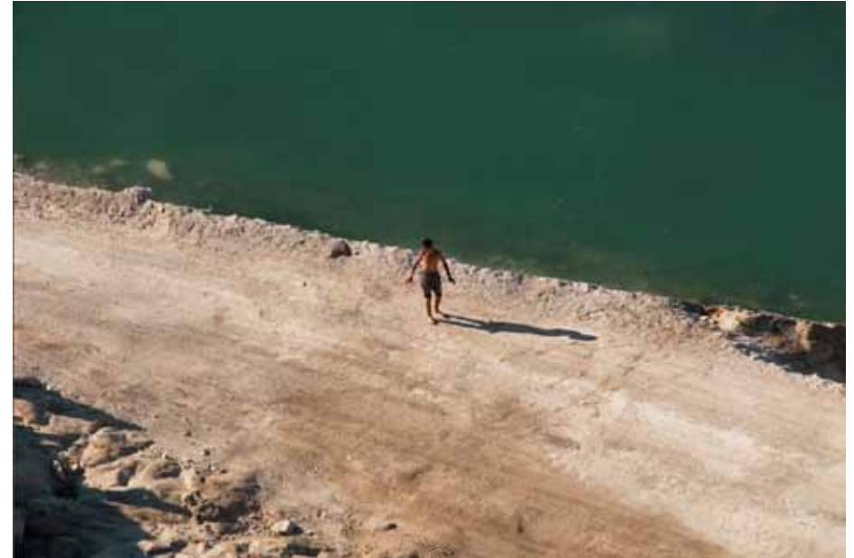
Incident, série Détroit, Tanger 2008 Inkjet Print Edition 1/3 H 60 x L 80 cm