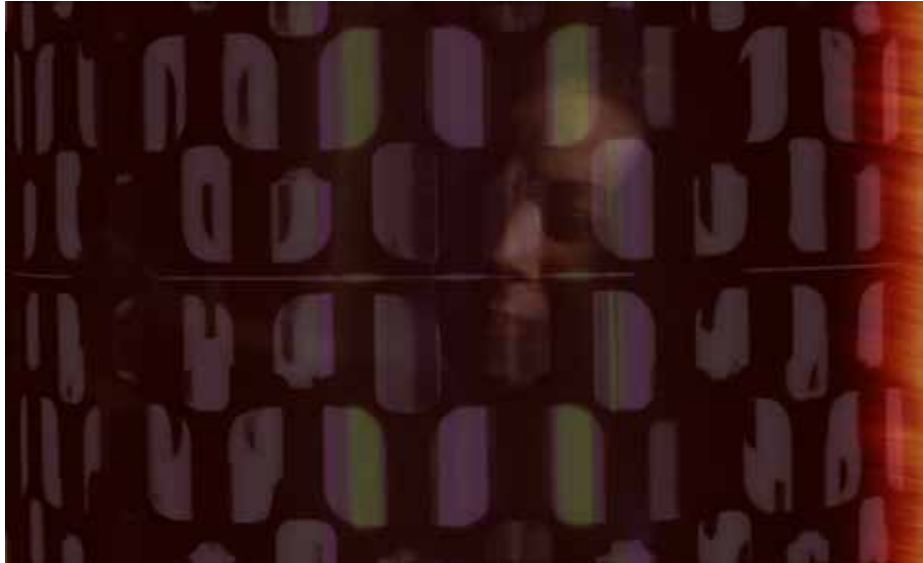
Subject report dazzling light of unearthly brilliance and colour, 2011 Digital photographic print on somerset paper Edition 1/3 H 40 x L 60 cm