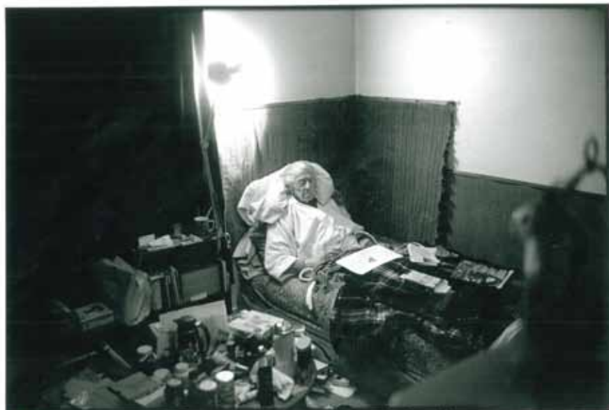
Tanger, 1997, Paul Bowles