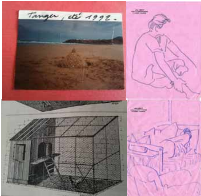
Tangier 1992 / 2010 Drawings and photographs H 45 x L 42 cm