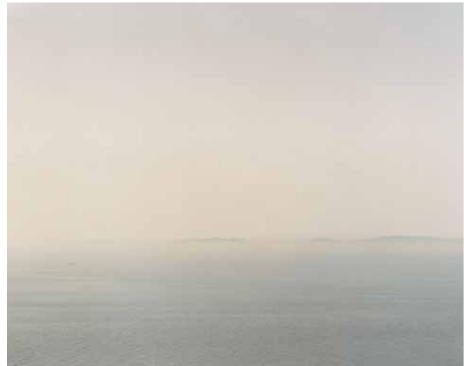
Fig. 95, View of Europe from Africa, Tangier, Morocco, 2007 C-Print Edition 1/5 H 76 x L 100 cm 2000 / 3000 euros