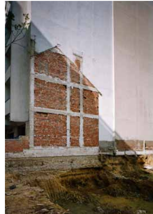
L'empreinte de Tanger, 2006 C-Print Edition 3/7 H 80 x L 60 cm