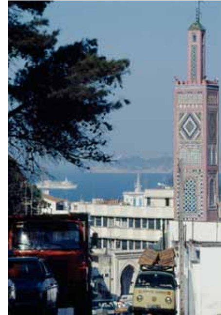
Sans titre, juillet 2000 C-Print Edition 1/10 H 40 x L 30 cm