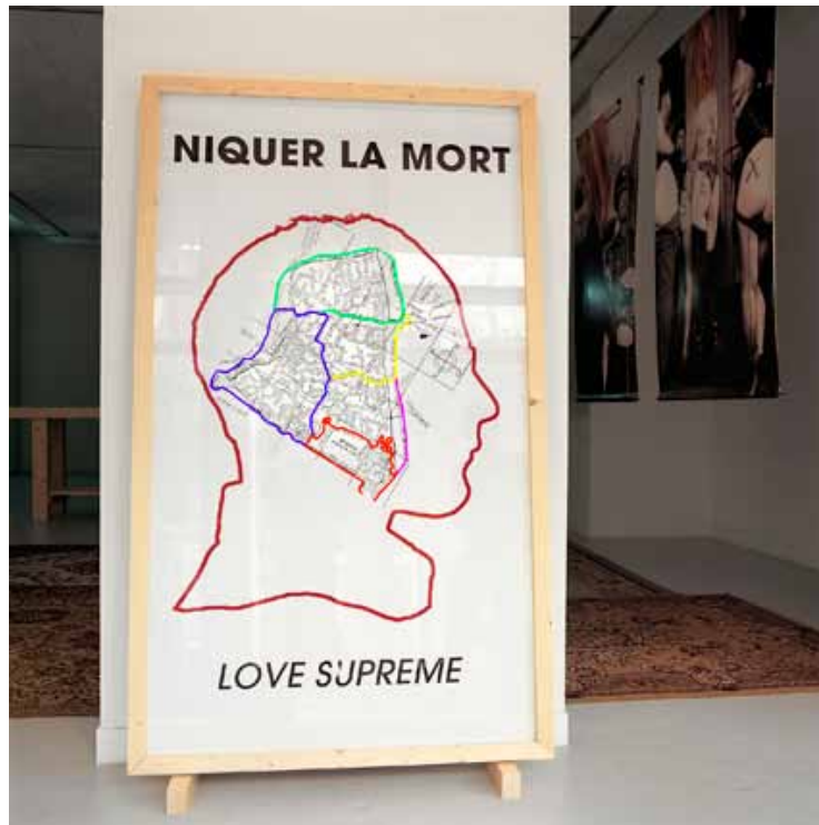
Lovesupreme, 2011 C-Print H 40 x L 40 cm 1500 / 2000 euros