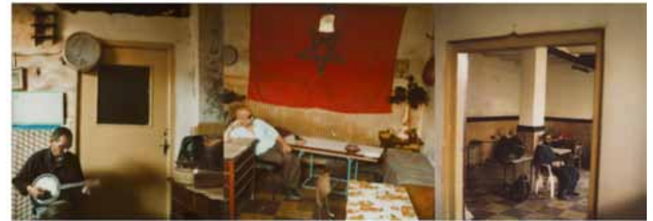
Untitled, 2009 C-Print, original Polaroid, triptyque composite H 20,32 x L 60,96 cm