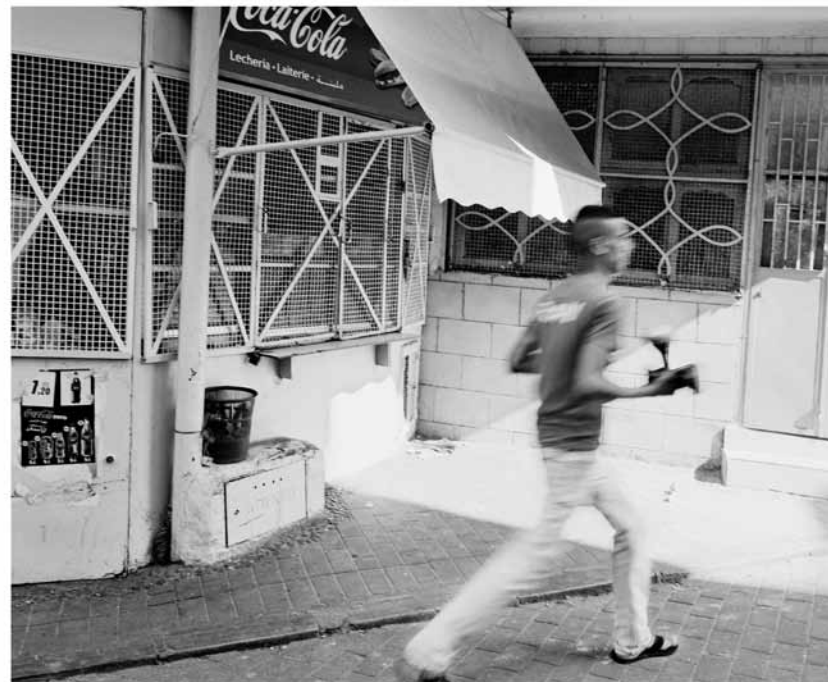
In the Petit Socco, Tangier, 2010 Ink-jet print on watercolor paper, with varnish Edition AP H 25 x L 30 cm