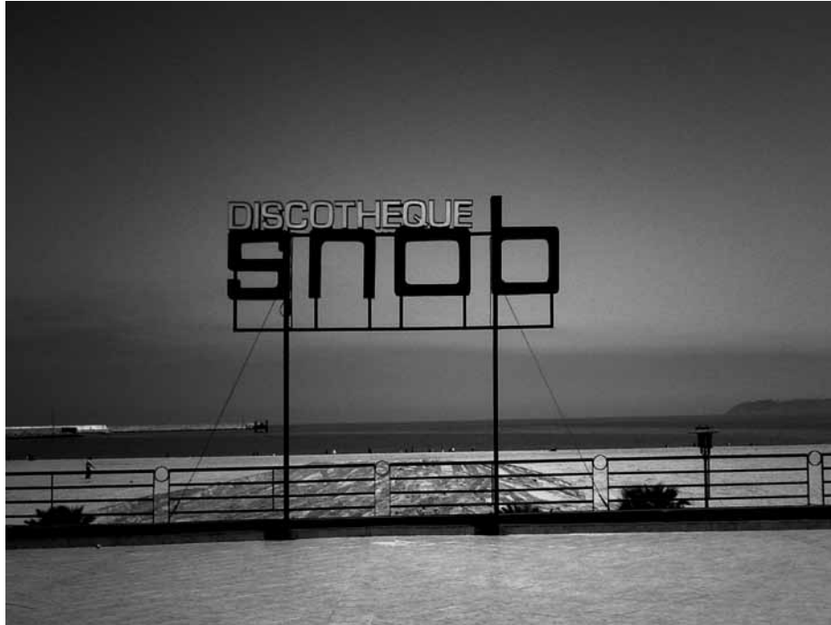
Discothèque Snob, 2010 C-Print inkjet - Baryté Edition 1/5 H 30 x L 40 cm