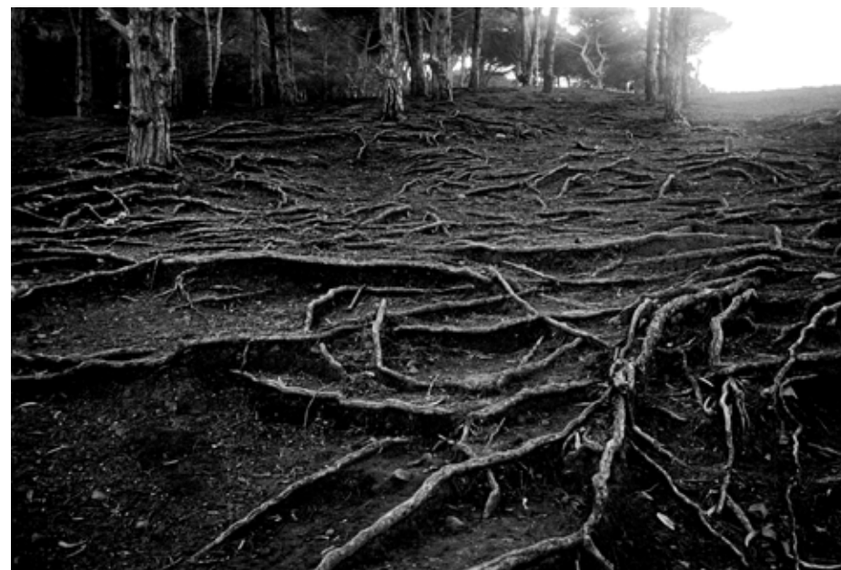
Les Racines du Ciel, janvier 2009 C-Print H 40 x L 50 cm