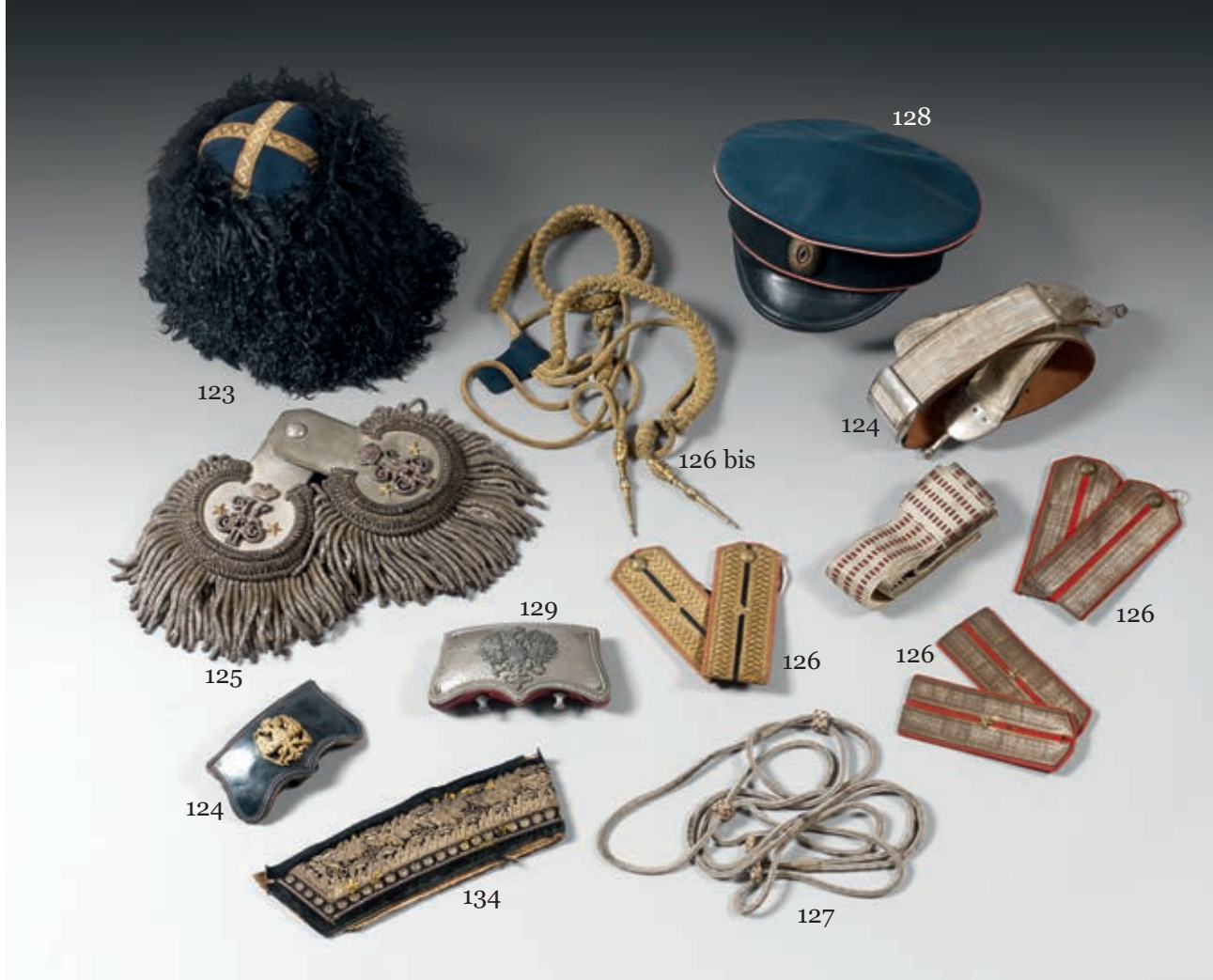
123 à 134