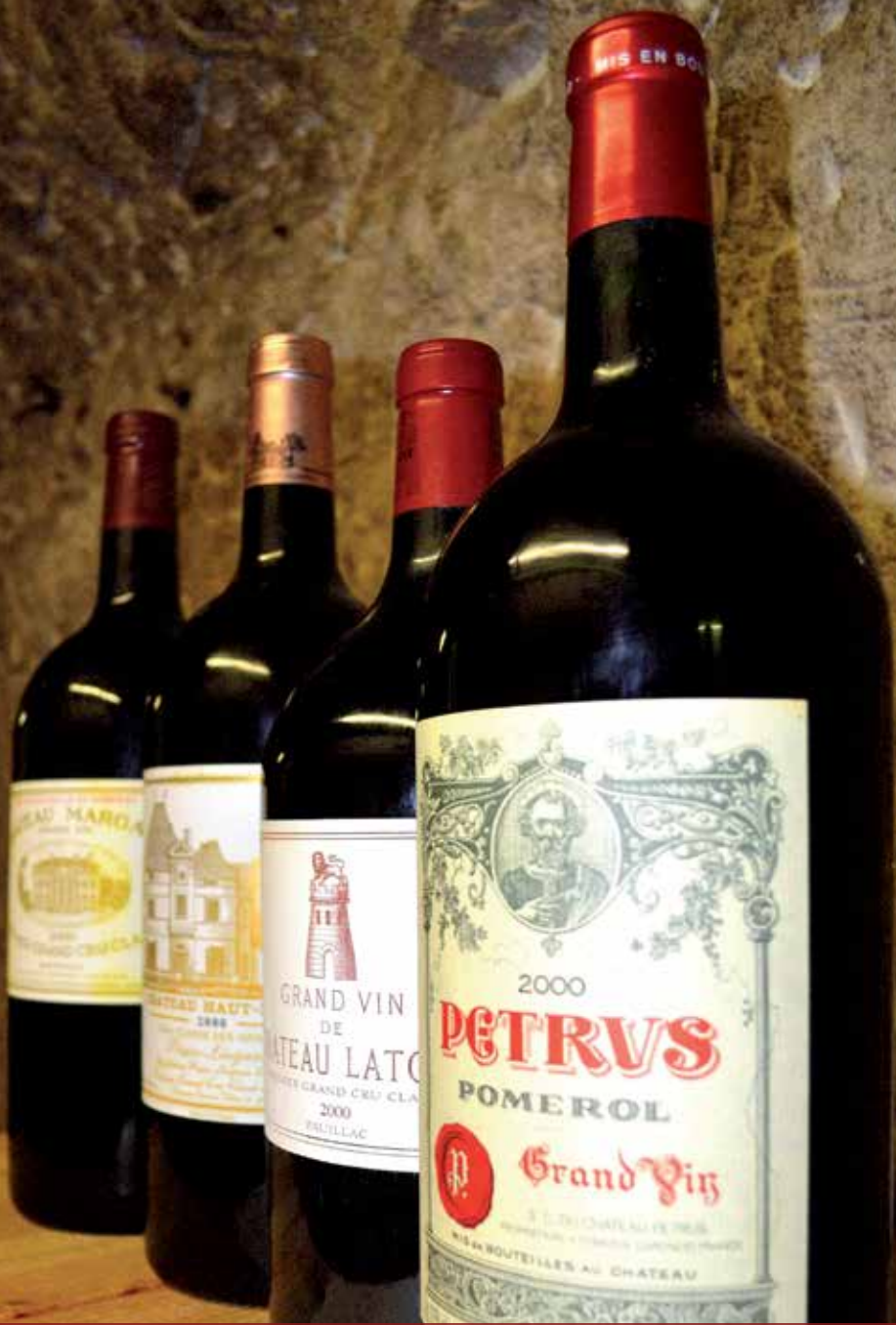
Lot 402 : CAISSE CARRE D'AS DUCLOT 2000 (Doubles Magnums) : 1 PETRVS ; 1 CHÂTEAU LATOUR ; 1 CHÂTEAU HAUT BRION ; 1 CHÂTEAU MARGAUX. Estimation: 15 000 / 17 000 €