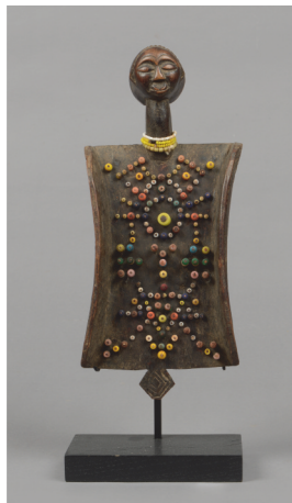
Zaire, Luba - H.: 29 cm