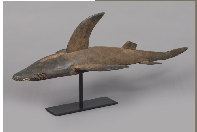
Nigeria, Ijo - L.: 92 cm