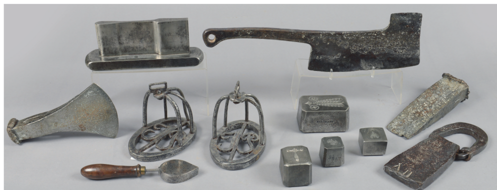
Fer forgé et coulé