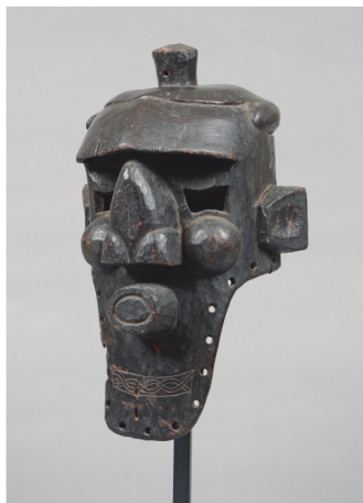
Zaïre - H.: 44 cm