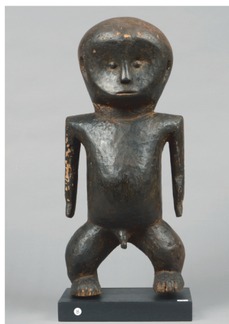
Zaire, M'Bala - H.: 57,5 cm