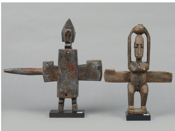
Mali, Dogon - H.: 40,5 et 37,5 cm