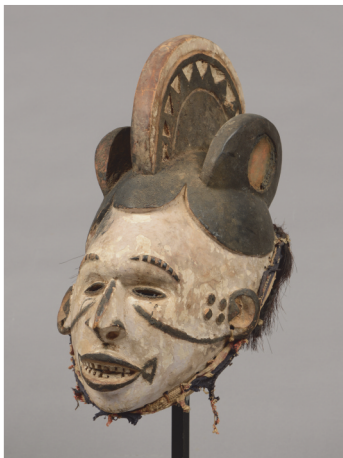
Nigeria, Idoma - H.: 40 cm