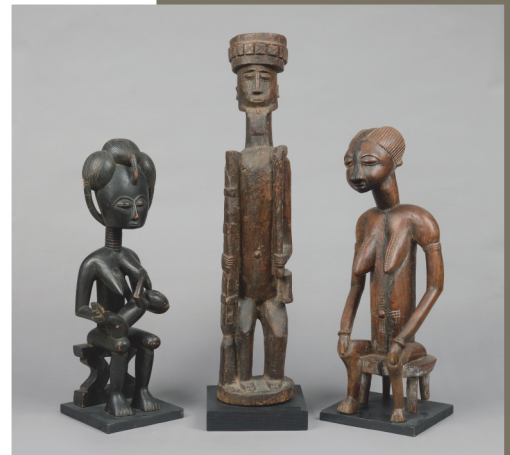
Côte d'Ivoire? - H. 55 cm; Mali, style Dogon - H.: 73 cm; Ghana - H.: 58 cm