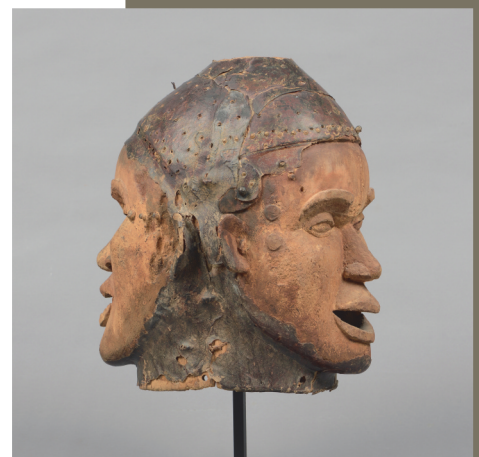
Nigeria, Eko - H.: 39 cm