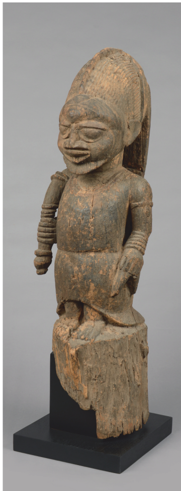
Nigeria, Yoruba - H.: 90 cm