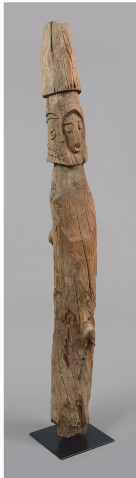
Ethiopie, Konso - H.: 142 cm