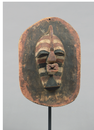
Zaïre, Songye - H.: 29 cm