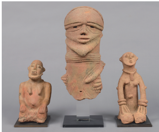
Mali, style Djenne - H.: 22,5 cm; Nigeria, Sokoto - H. 34 cm; Mali, style Bankoni - H.: 26 cm