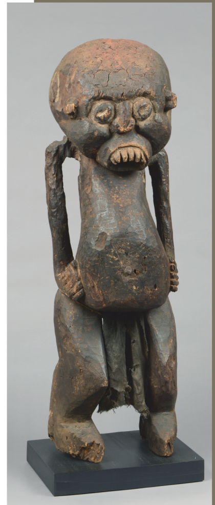
Cameroun - H.: 92,5 cm