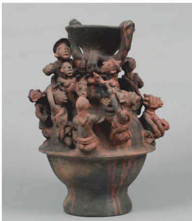
Bénin, Borgou - H.: 47 cm