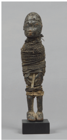
Bénin, Fon - H. 25 cm