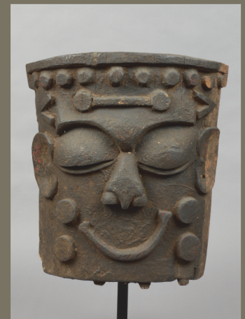
Nigeria, Eket - H.: 82 cm