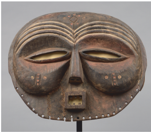
Zaire - H.: 48 cm