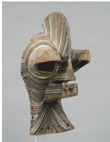
RDC, Songye - H.: 56 cm