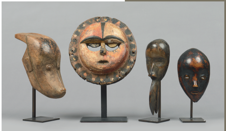
Côte d'Ivoire, Gouro - H. 16 cm; Nigeria, Eket - H.: 17 cm; Côte d'Ivoire, Dan Maou - H.: 17,5 cm; Côte d'Ivoire, style Dan - H.: 12,5 cm