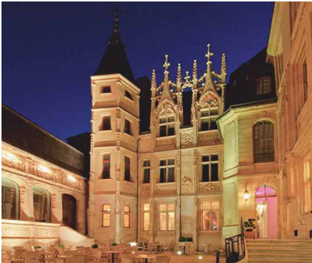
Hôtel de Bourgtheroulde 15, place de la Pucelle 76000 ROUEN