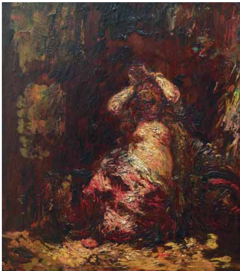
111. Adolphe Joseph Thomas MONTICELLI (1824 – 1886)