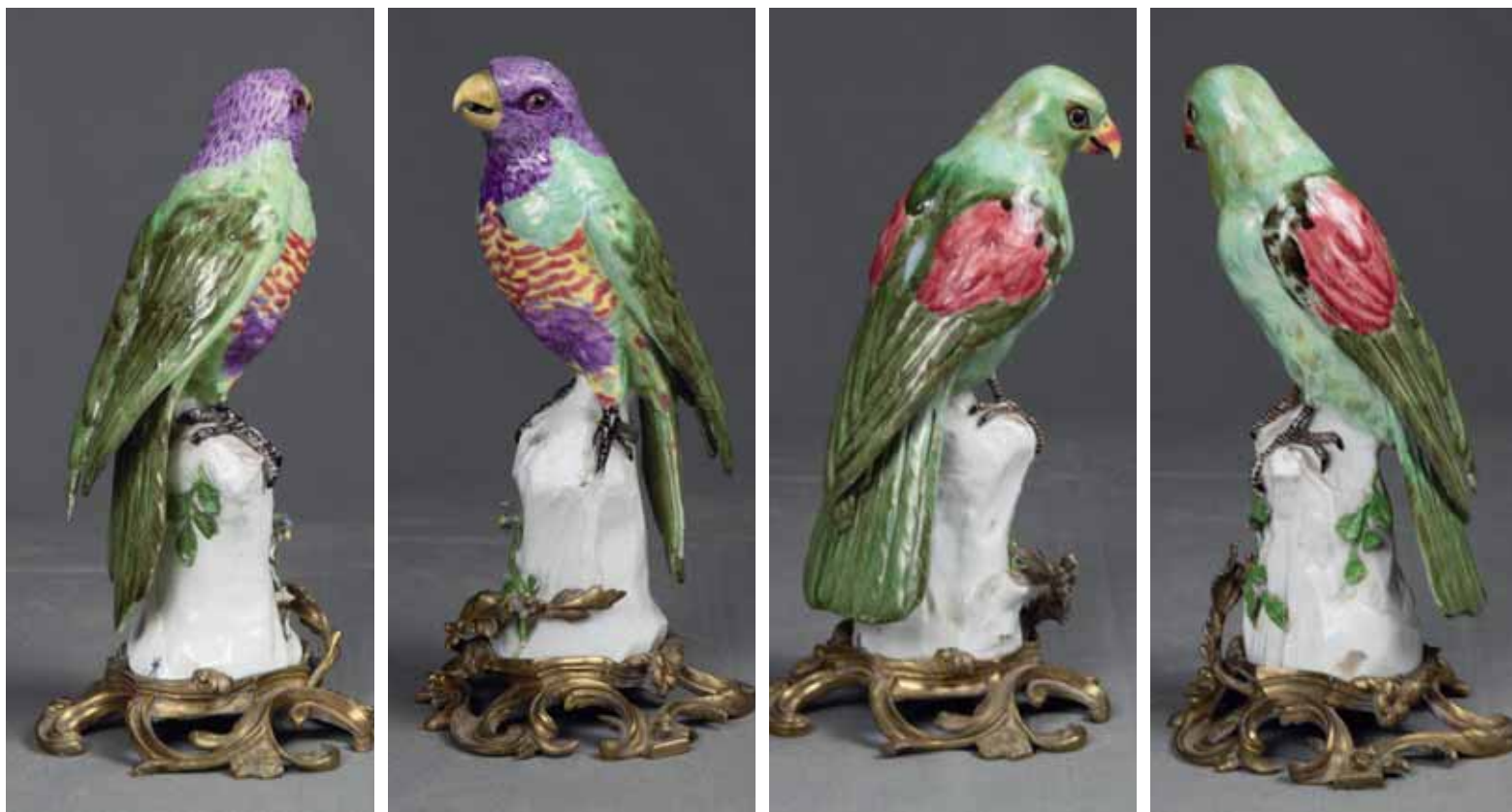
138. SAMSON - Deux oiseaux en porcelaine polychrome. Monture en bronze doré ciselé. Marqué " ES ". H. : 35 cm 1 800 / 2 500 €