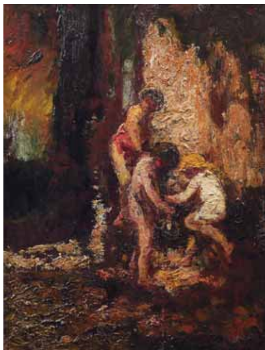
112. Adolphe Joseph Thomas MONTICELLI (1824 – 1886)