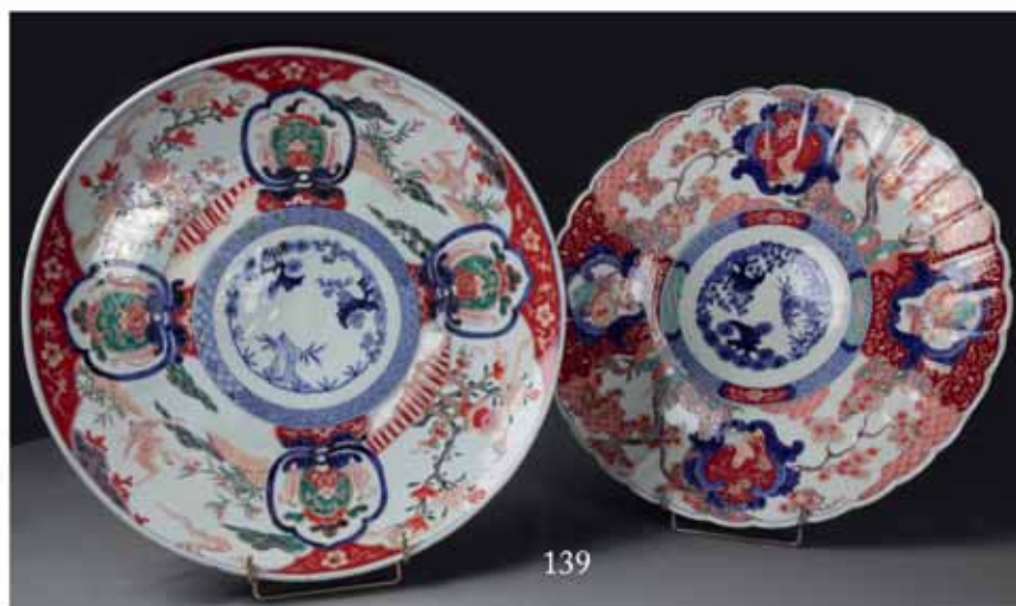
139. JAPON - Deux plats IMARI.