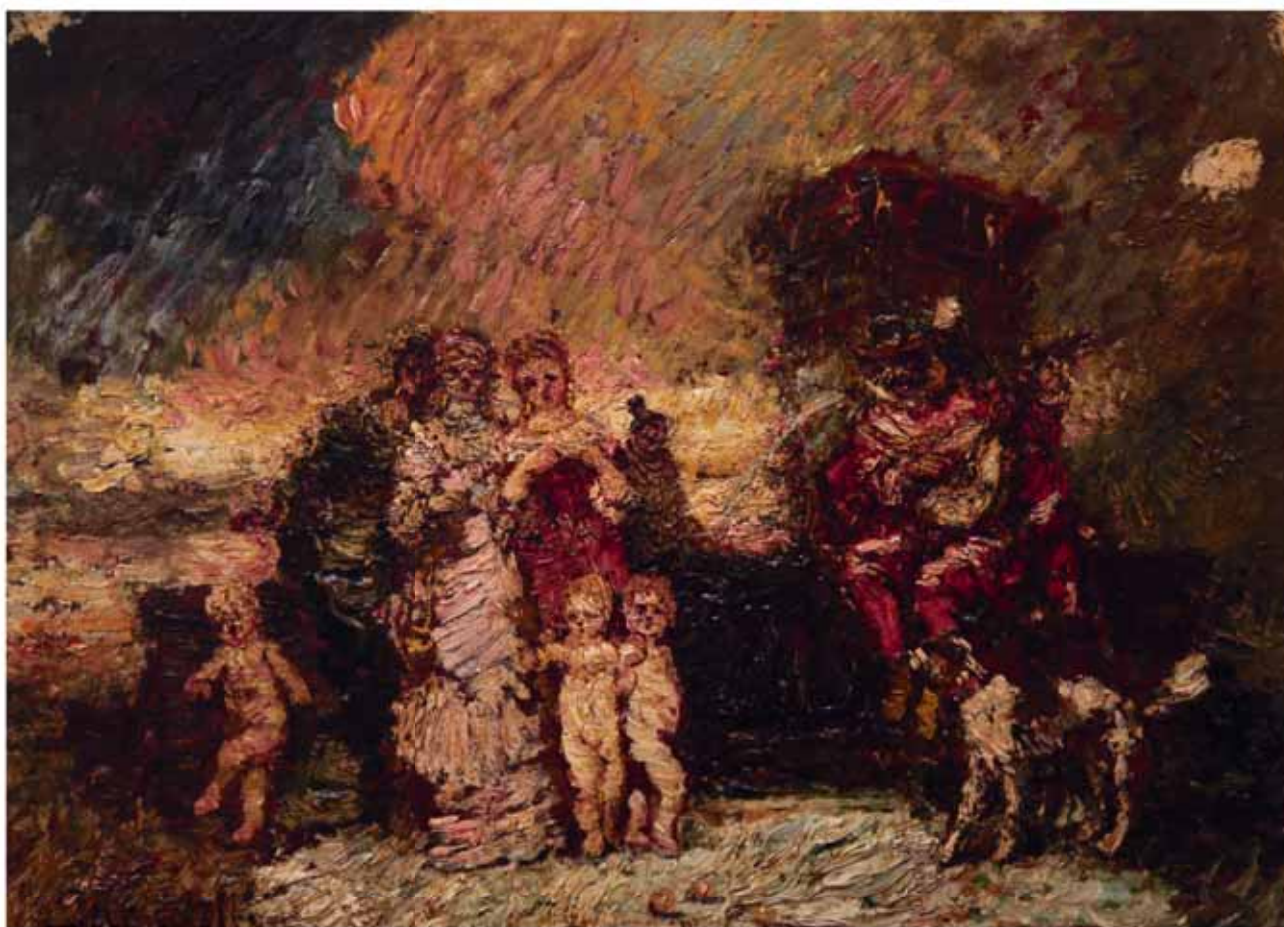
113. Adolphe Joseph Thomas MONTICELLI (1824 – 1886)