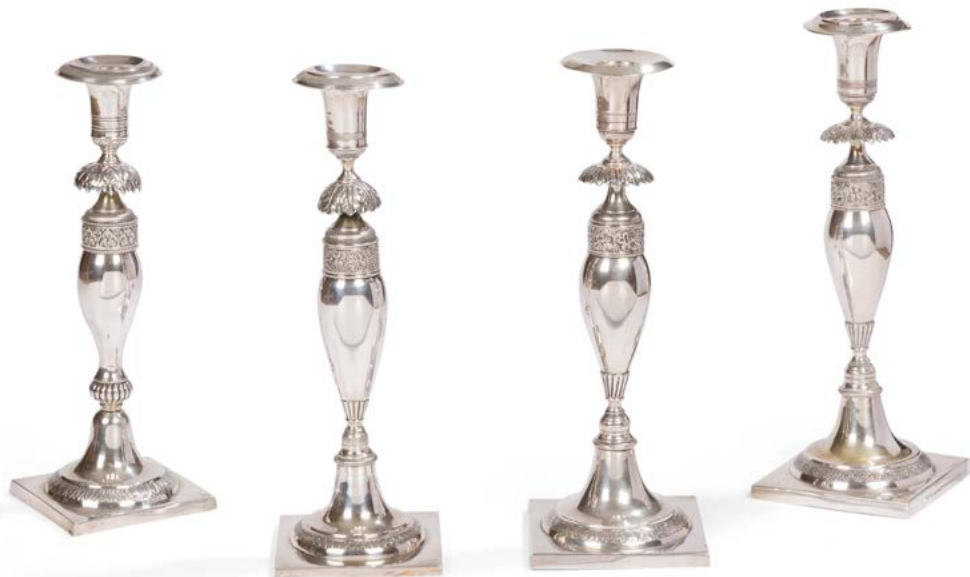
206 # ALLEMAGNE XIX e SIÈCLE Suite de quatre bougeoirs en argent deuxième titre et quatre bobèches. Ils reposent sur une base carrée, le départ du fût est circulaire rehaussé d'une frise d'enroulements, la collerette du fût d'une frise de vignes. Orfèvre : WH, non identifié Poids : 980 g - hauteur : 26 cm - base carrée : 8,8 cm 600 / 800 €