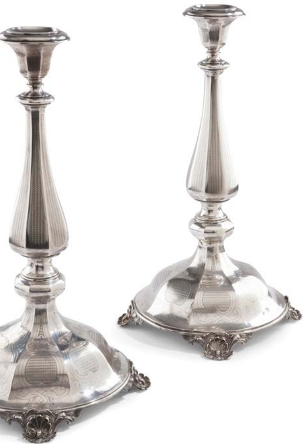
205 AUTRICHE HONGRIE ENTRE 1866 ET 1922 Paire de grands candélabres en argent deuxième titre, lestés de plâtre. Ils reposent sur quatre pieds estampés de style rocaille à décor de coquilles. Le socle en forme de cloche à huit pans en rappel sur le nœud, le fût et la bobèche. Orfèvre : VC, non identifié Poids brut : 3793 g - hauteur : 41,2 cm - diamètre du pied : 20,2 cm 1 200 / 1 500 €