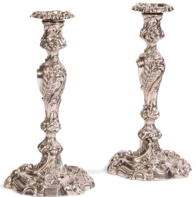
204 ANGLETERRE XIX e SIÈCLE Paire de candélabres en argent fourré et ses bobèches, modèle rocaille. Poids brut : 2671 g - hauteur : 31,8 cm 600 / 800 €