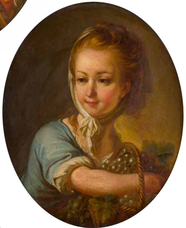
20 DANS LE GOÛT DE FRANÇOIS HUBERT DROUAI Joueur de flûte ; Jeune fille au panier de raisin Paire de toiles ovales 50 x 41,5 cm