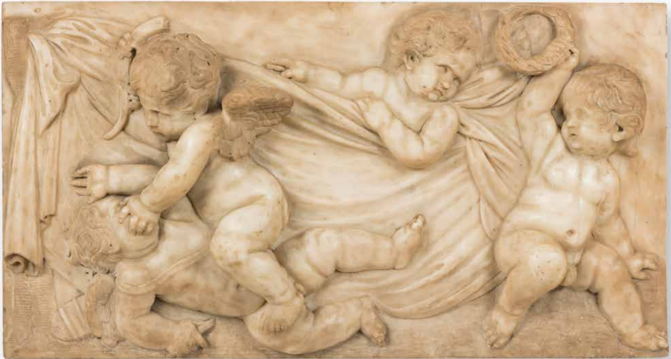
84 ÉCOLE ITALIENNE VERS 1700, D'APRÈS FRANÇOIS DU QUESNOY (1597-1643) L'Amour sacré terrassant l'amour profane Bas-relief en marbre blanc 46,5 x 87 cm Petits accidents.