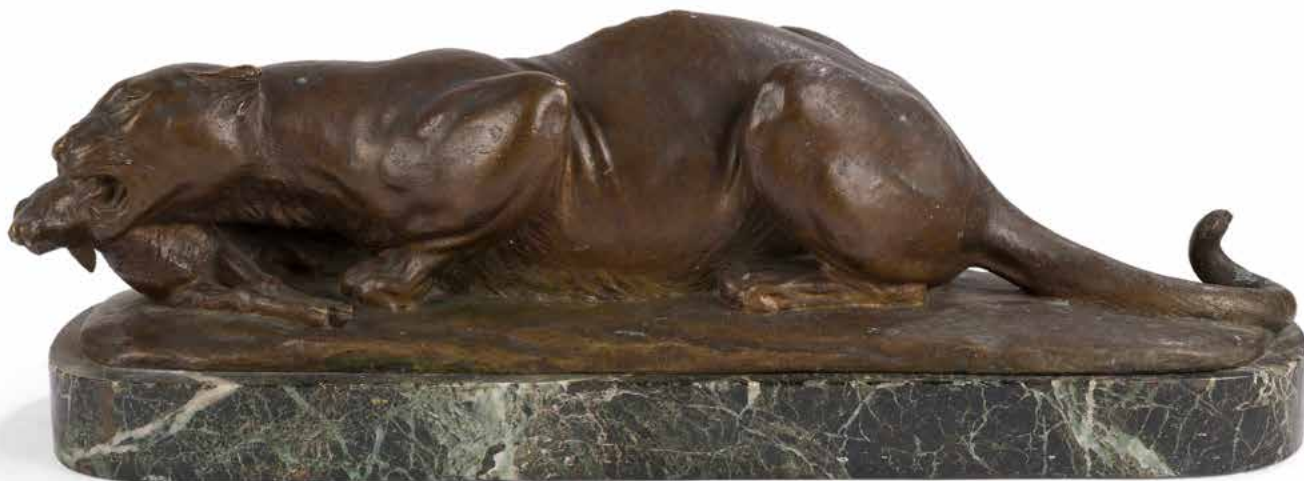
114 GEORGES GARDET (1863-1939) Lionne dévorant une antilope Épreuve en bronze patiné. Signée et gravée « 4ème ep. » sur la terrasse. Cachet « Cire perdue Hébrard ». Cachet : « Union de maîtres sculpteurs - Editions rares - 4 ». H. : 16 cm, L. : 53 cm, P. : 15 cm Socle en marbre vert de mer (éclats). 500 / 800 €