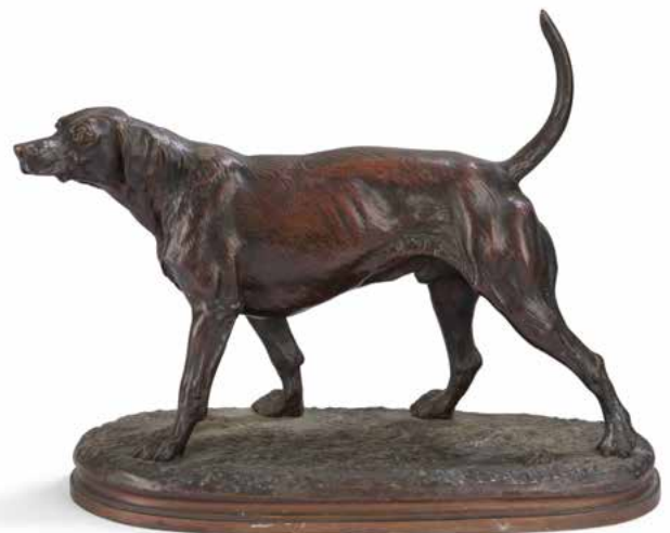
129 ARTHUR WAAGEN (1833-1898) Chien de meute Vampire à l'arrêt Épreuve en bronze patiné. Signée et titrée « Vampire » sur la terrasse, marquée « S » sur le corps. H. : 27 cm, L : 32 cm 300 / 500 €