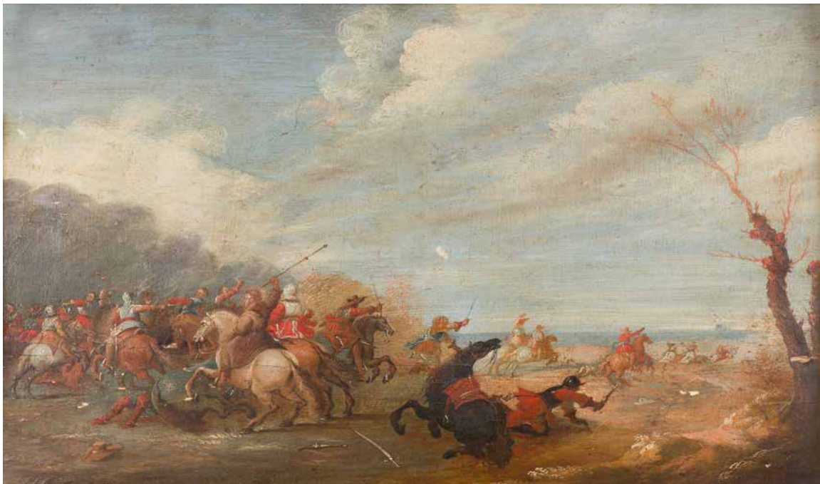
9 ÉCOLE ANVERSOISE DU XVII e SIÈCLE, ENTOURAGE DE LAMBERT DE HONDT Combat d'un saint ermite contre des cavaliers Panneau de pin, une planche, non parqueté 40,5 x 55 cm (Restaurations anciennes, accidents et manques) 800 / 1 200 €