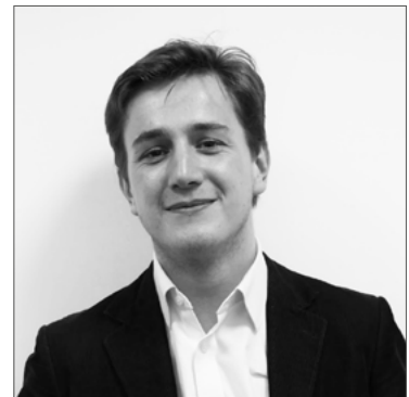
Charles BEAUSSANT Ordres d'achat

cdubois@ader-paris.fr Tél.: 01 78 91 10 06