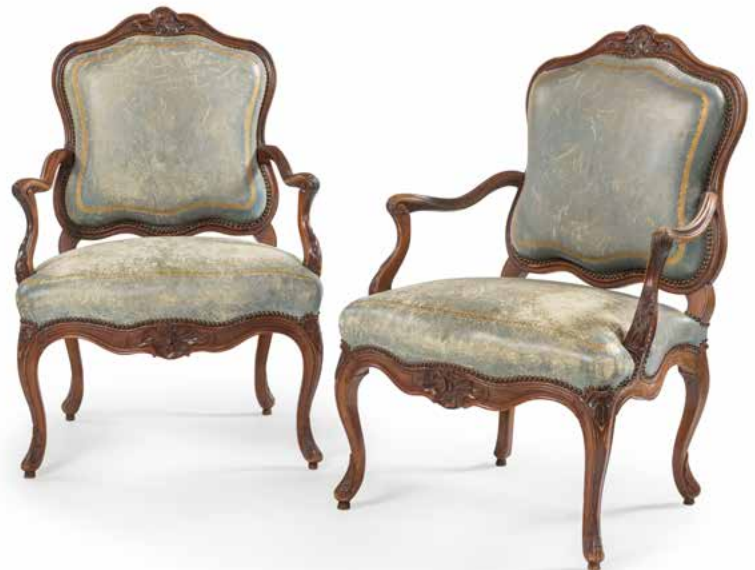
175 Paire de fauteuils en noyer mouluré et sculpté, de forme très mouvementée, à décor de cartouche asymétrique, reposant sur des pieds cambrés ; (petits accidents ; restaurations dont rebouchages). Lyon, époque Louis XV. H : 98 cm, L : 68 cm 800 / 1 200 €