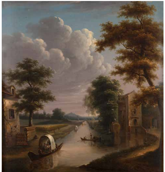
43 ÉCOLE HOLLANDAISE DU XIX e SIÈCLE Paysage au canal Toile 63 x 59 cm 400 / 600 €