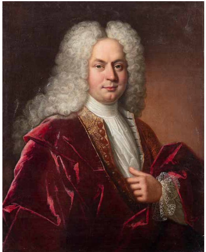
24 ATTRIBUÉ À PIERRE ERNOU DIT LE CHEVALIER ERNOU (1665 - VERS 1739) Portrait d'homme au manteau rouge Toile 81 x 65,5 cm (Restaurations anciennes) 1 200 / 1 500 €