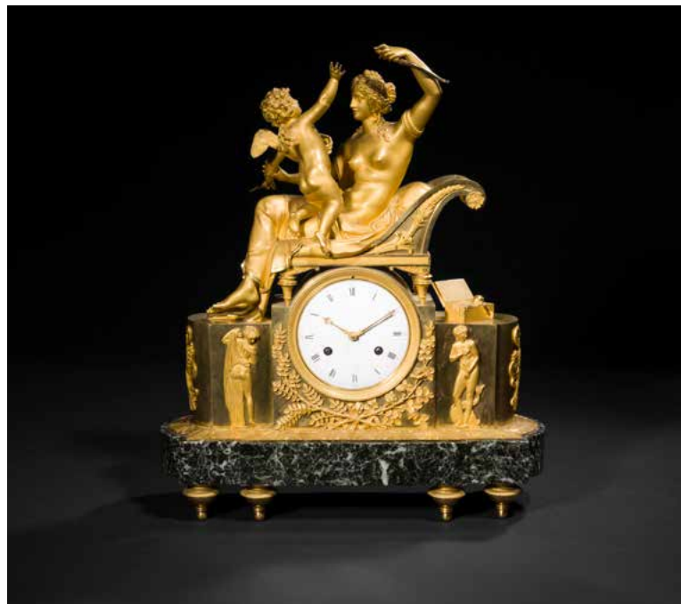
220 Pendule en bronze doré représentant Vénus désarmant l'amour, assise dans un lit de repos, le socle à figures de Vénus, rameaux d'olivier et trophées, la base en marbre vert de mer ; le cadran inscrit «à Paris» ; (petits accidents et manques). Époque Empire. H. 48 cm, L. 40 cm, P. 12,5 cm 2 500 / 3 000 €