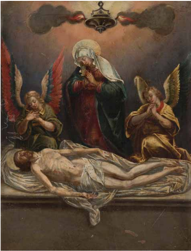
3 ÉCOLE ANVERSOISE VERS 1580 Pieta avec deux anges Cuivre 26,3 x 20,8 cm (Restaurations anciennes) 800 / 1 200 €