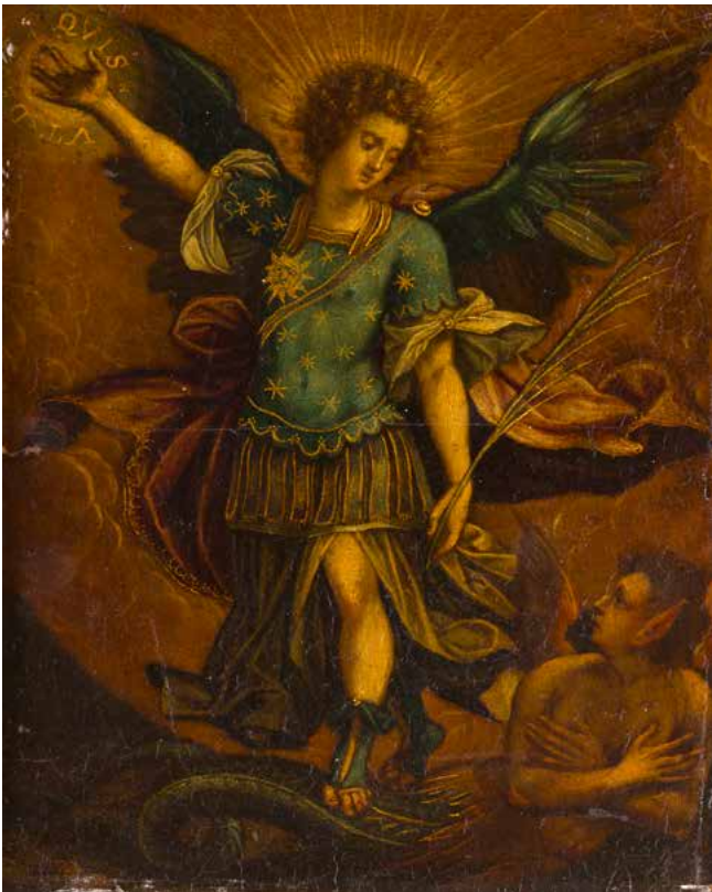
5 ÉCOLE ESPAGNOLE DU XVII e SIÈCLE L'Archange saint Michel Toile d'origine 66,5 x 47,5 cm (Restaurations anciennes et accidents) 800 / 1 200 €

Reprise de la gravure de Hieronymus Wierix d'après Martin de Vos