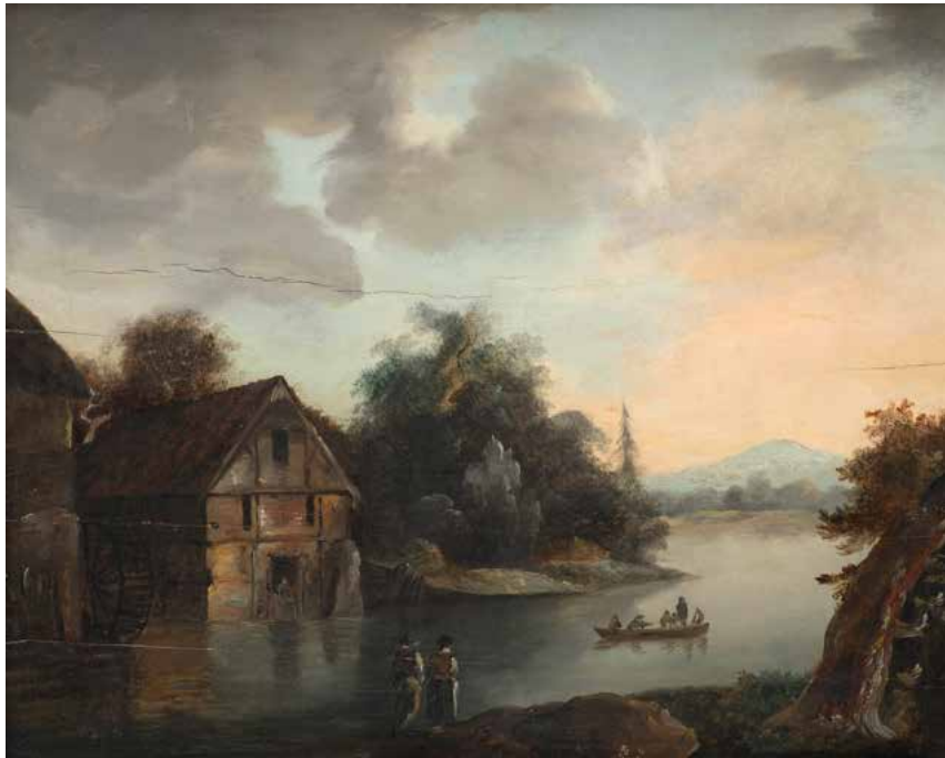
40 ÉCOLE FRANÇAISE DU XIX e SIÈCLE Paysage fluvial au pied des montagnes Panneau peint et renforcé 56 x 46 cm (Fentes)