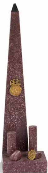
212 Obélisque en porphyre, avec des fûts de colonne en ruine à ses pieds, et deux médaillons à profil. XIX e siècle. H : 37 cm 600 / 800 €