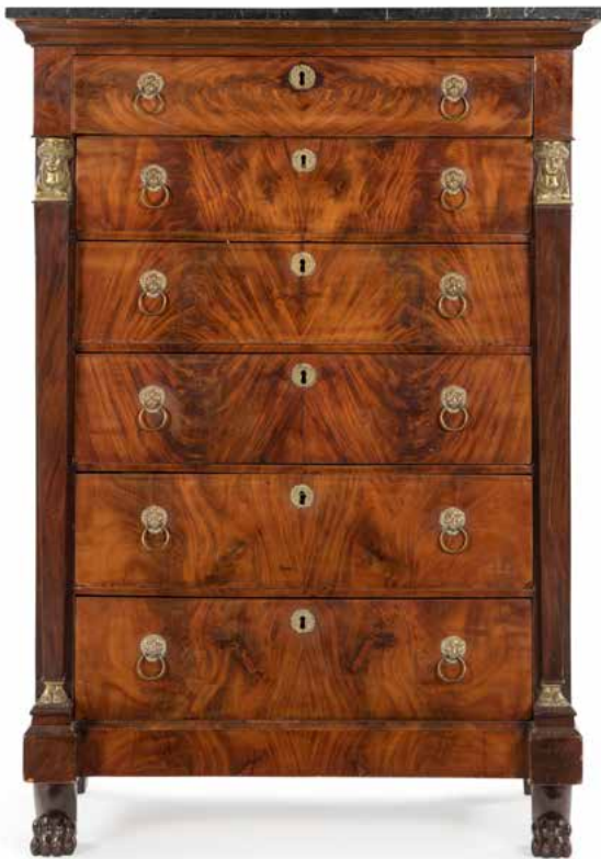
176 Chiffonnier en acajou flammé ouvrant à six tiroirs, le dessus de marbre noir de Belgique reposant sur des montants en pilastre à buste de femme antique, reposant sur des pieds en griffe ; (accidents et restaurations ; usures). Époque Restauration. H : 153 cm, L : 106 cm, P : 50 cm 500 / 700 €