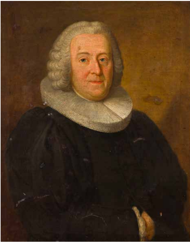
23 ÉCOLE FRANÇAISE DE LA PREMIÈRE MOITIÉ DU XVIII e SIÈCLE Portrait d'homme à la fraise Toile d'origine 85 x 67 cm (Restaurations anciennes) 300 / 400 €