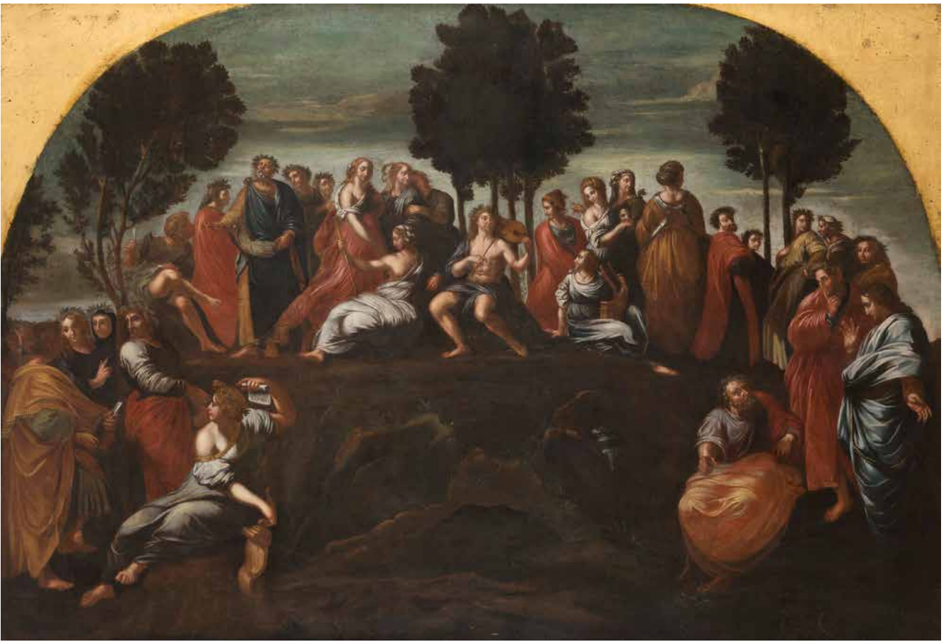
1 ÉCOLE FRANÇAISE DU XVII e SIÈCLE, D'APRÈS RAPHAËL Apollon et les Muses au Parnasse Toile 119 x 176 cm (Restaurations anciennes) 800 / 1 200 €