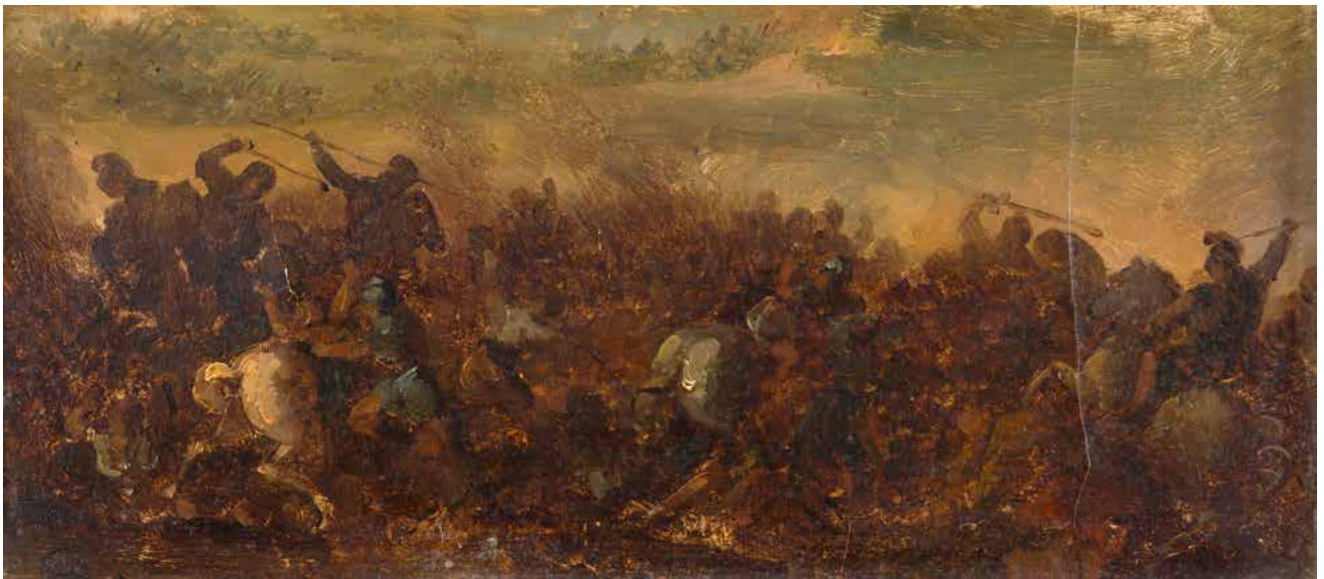
33 ÉCOLE FRANCAISE DU XIX e SIÈCLE Choc de cavallerie Toile 15 x 34 cm (Enfoncement)