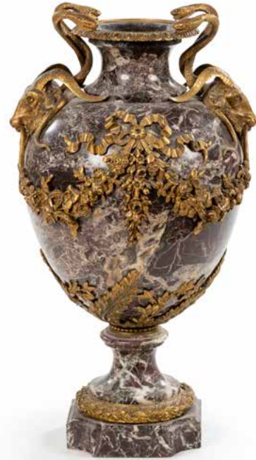
174 Grand vase en marbre Campan, de forme balustre, à monture de bronzes dorés à décor de serpents, têtes de bélier, guirlandes et nœud de ruban, reposant sur un piédouche à frise de feuilles de laurier. Style Louis XVI, XIX e siècle. H. 58 cm 1 200 / 1 500 €