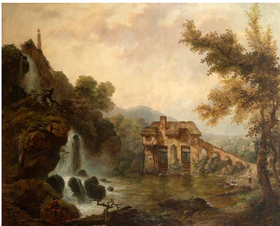
36 DANS LE GOUT D'HUBERT ROBERT Les lavandières