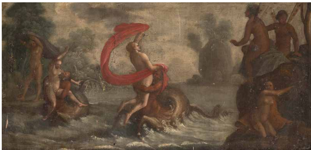
2 ÉCOLE DE VENITIENNE VERS 1600 Tritons et néréides Toile 44 x 87 cm Porte une inscription au revers « 1671.C » (Manques et restaurations anciennes) 1 000 / 1 500 €