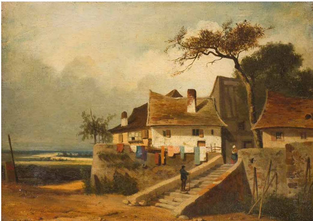
38 ALEXANDRE GABRIEL DECAMPS (1803 - 1860) Vue de village Toile d'origine Porte un monogramme et une date en bas à gauche « DC / 1841 » 33 x 46 cm Traces d'inscriptions au revers de la toile 1 200 / 1 500 €