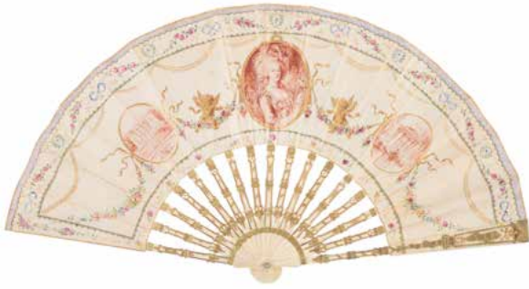
173 Éventail de mariée. Fin du XIXème siècle. Monture en nacre et feuille en Duchesse de Bruges. Dans une boîte de la maison Royer de Fraene . (Accident à une flèche, accident à la boîte) 80 / 120 €