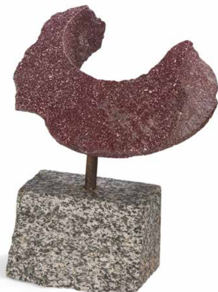
213 Composition en porphyre rouge et granit gris (fragments ; composite). H : 34 cm 800 / 1 200 €