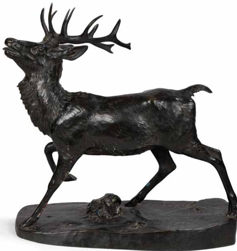
118 ANTOINE LOUIS BARYE (1796-1875) Cerf debout

Bronze à patine brune Signé « BARYE » à l'avant droit de la terrasse Dim. : 45 x 49,8 x 21 cm Petites usures et accidents à la patine