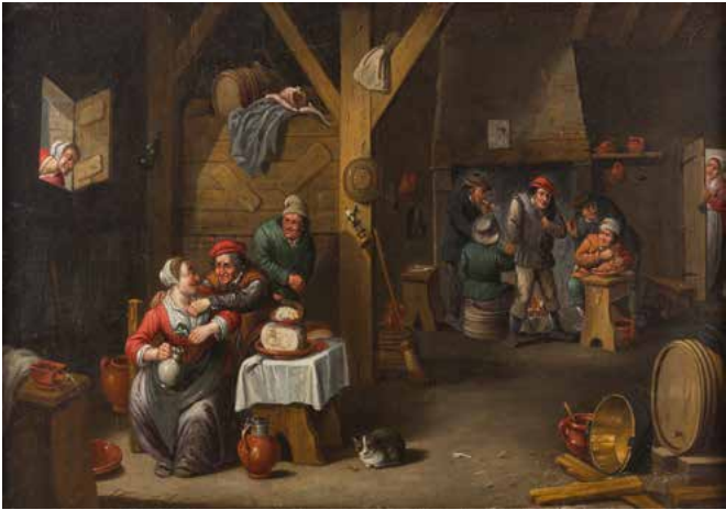
14 ÉCOLE FLAMANDE DU XVIII e SIÈCLE, SUIVEUR DE DAVID TENIERS Intérieurs d'auberge Paire de toiles 58 x 83 cm