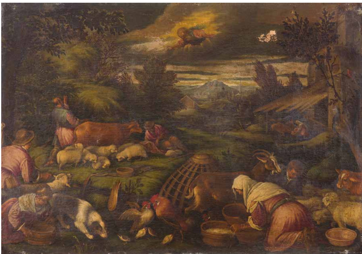
12 ÉCOLE ITALIENNE DU XVII e SIÈCLE, SUIVEUR DE BASSANO L'annonce aux bergers Toile d'origine 74 x 107 cm (Restaurations anciennes et accidents) 800 / 1 200 €