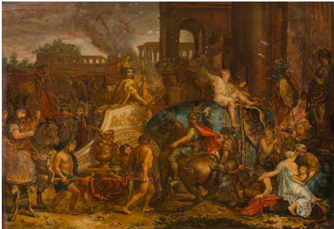
10 ÉCOLE FRANÇAISE DU XIX e SIÈCLE, D'APRÈS CHARLES LE BRUN Le triomphe d'Alexandre Panneau de chêne, une planche, non parqueté 25 x 35 cm (Restaurations anciennes et manques) 300 / 400 €