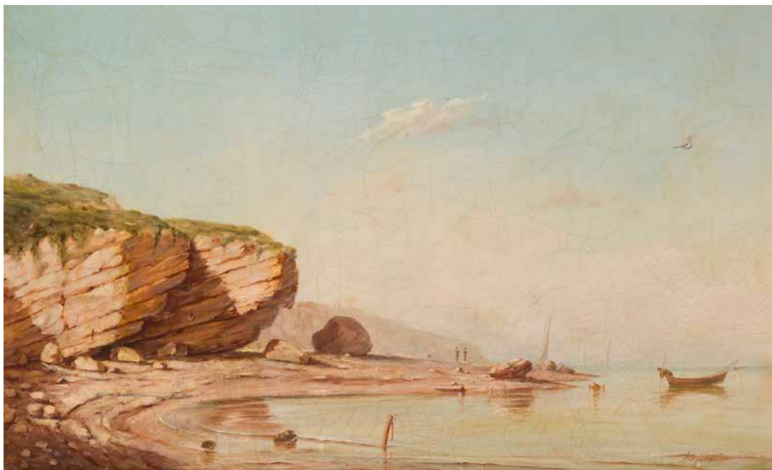
39 DELATTRE*** Paysage de bord de mer Toile d'origine Porte une trace de signature en bas à droite «...Delattre » (?) 45,5 x 74 cm (Accidents) 400 / 600 €