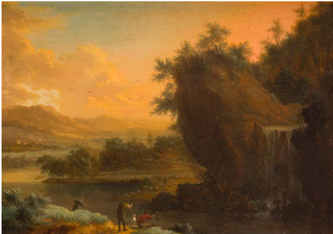
41 JOHANN CHRISTIAN VOLLERDT (LEIPZIG, 1708 - DRESDE, 1769) Paysans près d'un chemin boisé Panneau, une planche, non parqueté Signé en bas à gauche et daté 1754. 18 x 25,5 cm Au dos, un cachet de douane et une ancienne attribution à Verboom. 600 / 800 €