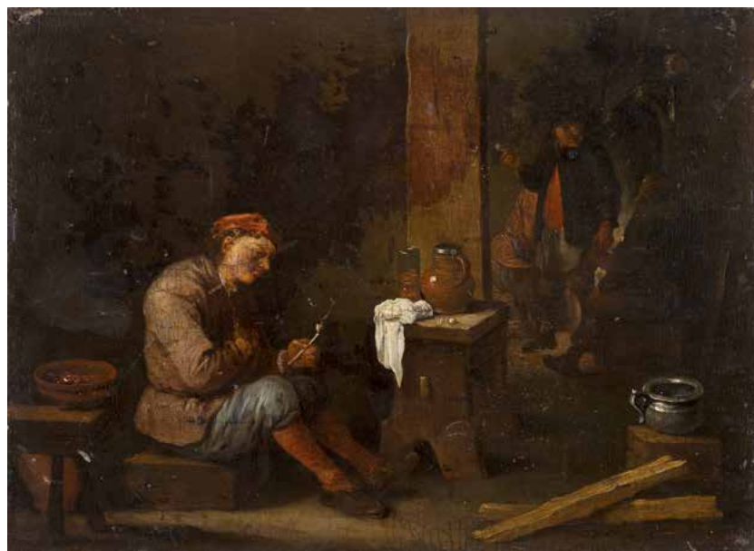
13 ÉCOLE FLAMANDE DU XVII e SIÈCLE, ENTOURAGE DE DAVID TENIERS Fumeurs dans un intérieur Panneau de chêne, une planche, non parqueté Porte une inscription en bas à droite « D. Teniers » 23 x 31 cm 800 / 1 200 €