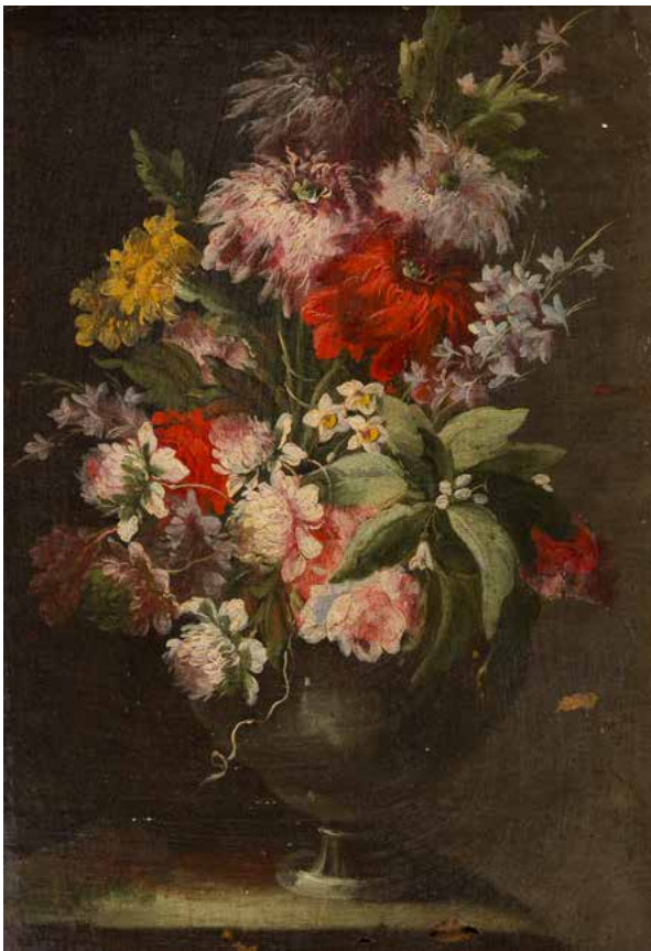
27 ÉCOLE FRANCAISE DU XVIII e SIÈCLE, ENTOURAGE DE JEAN BAPTISTE MONNOYER Bouquet de fleurs sur un entablement Toile 24 x 17 cm (Restaurations anciennes et accidents)