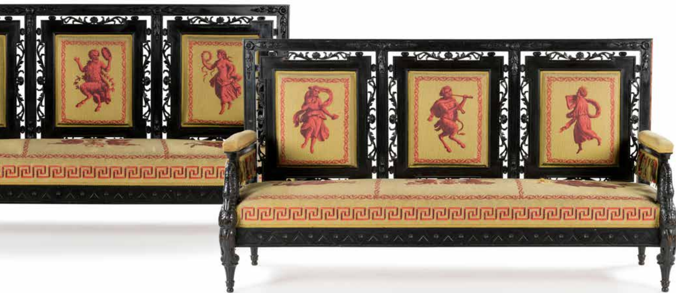
214 Paire de grandes banquettes d'applique en bois noirci, à décor de cols de cygne, feuillages stylisés, et motifs géométriques ; (accidents et manques). Milieu du XIX e siècle. H : 110 cm, L : 100 cm, P : 63 cm 2 000 / 3 000 €