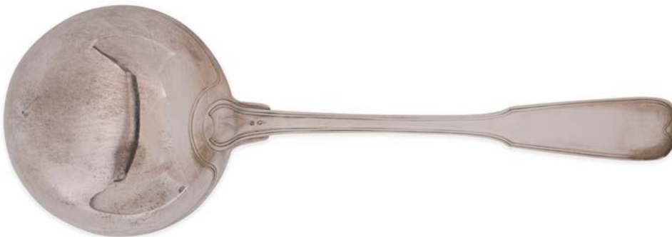
22 VALENCIENNES 1787 Louche en argent modèle filet, cuilleron bordé. Poinçon de Bernier Poids : 262 g - longueur : 32 cm 200 / 250 €