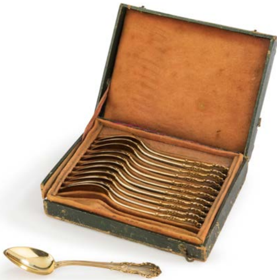
32 FRANCE MILIEU DU XIX e SIECLE Douze cuillers à thé en argent pour partie vermeillée, modèle rehaussé sur la spatule intérieure d'un guilloché dans un encadrement feuillagé, dans un écrin endommagé en cuir vert. Orfèvre : indéterminé Poinçon minerve Poids : 195 g - longueur : 14,6 cm 120 / 150 €