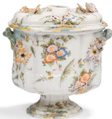
74 Sassuolo Rafrichissoir couvert en faïence de forme cylindrique sur piedouche à côtes en relief, à décor polychrome de branches fleuries, les anses en forme de branches et fleurs en relief. XVIII e siècle. H. : 24 cm Accidents au piedouche. 300 / 500 €