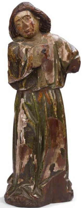
114 Ange en noyer sculpté et polychromé, dos ébauché. Bourgogne XV e siècle H. : 47 cm (manques dont les ailes et aux bras) 400 / 600 €