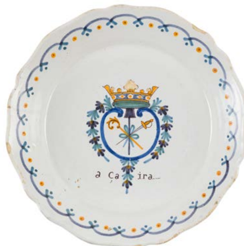
82 Nevers Assiette à bord contourné en faïence à décor polychrome révolutionnaire au centre d'un homme tenant une banderole portant l'inscription vivre libre ou mourir. XVIII e siècle, période révolutionnaire. D. : 23 cm 80 / 120 €