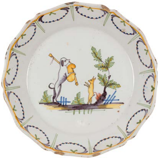
84 Nevers Assiette à bord contourné en faïence à décor polychrome au centre d'un chien jouant de la cornemuse et un lièvre dansant. XVIII e siècle. D. : 23 cm Eclats. 60 / 80 €