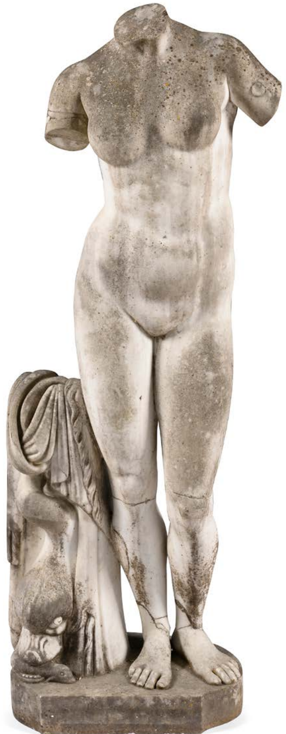
109 France, début du XX e siècle Amphitrite Statue en marbre blanc H. : 145 cm Accidents, manques et restaurations (notamment dans les parties inférieures) 1000 / 1500 €