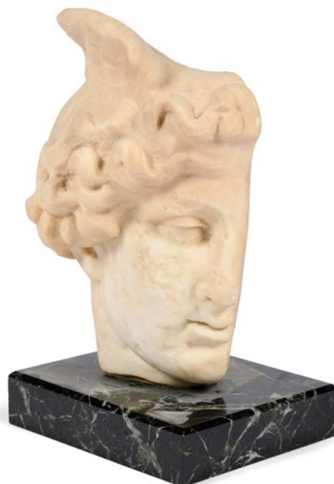
103 École moderne Profil d'Hermès Marbre blanc sur une base en marbre vert de mer H. : 27 cm