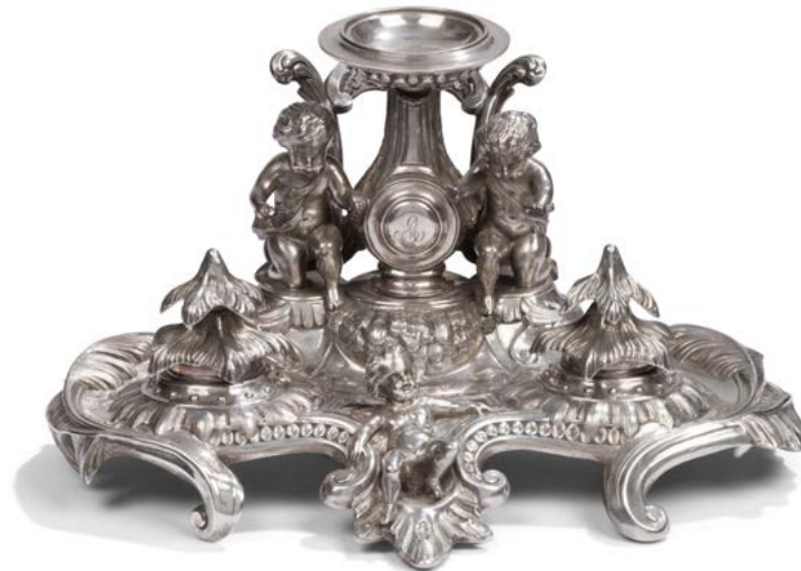
34 PARIS 1864 - 1874 Encrier de bureau en argent de style Louis XV reposant sur une base polylobée rehaussée d'enroulements feuillagés, complet de ses bouchons. La prise centrale figure une vasque balustre encadrée de deux putti semblant pousser un troisième putto ayant glissé à leurs pieds. Poinçon tête de mercure d'exportation de 1840 à 1879 Orfèvre : DEBAIN & FLAMANT Poids : 731 g - longueur : 31 cm - largeur : 23 cm - hauteur : 18 cm 400 / 600 €