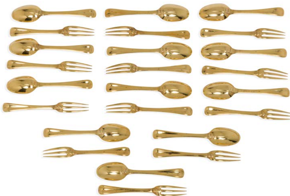
51 PARIS CIRCA 1930 - 1940 Ensemble de douze couverts à entremets en vermeil, modèle MAZARIN. Poinçon minerve Orfèvre : Emile PUIFORCAT Poids : 1542 g