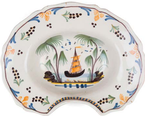
86 Nevers Plat à barbe ovale à bord contourné en faïence à décor polychrome au centre d'un violier sur les flots entre des palmiers. XIX e siècle. L. : 31 cm 80 / 120 €