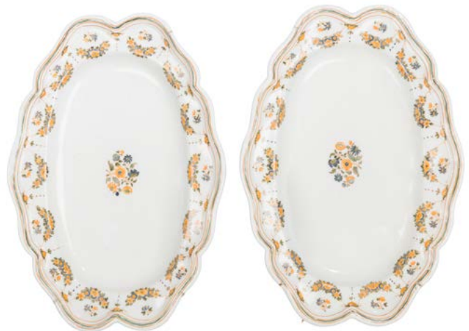
87 Moustiers Deux plats ovales à bord contourné en faïence à décor polychrome de bouquets de fleurs et guirlandes de fleurs suspendues et une assiette à bord contourné à décor polychrome de fleurs ; XVIII e siècle. L. : 36,5 cm et D. 24 cm On y joint une assiette dans le style de Moustiers du XIX e siècle. 150 / 200 €