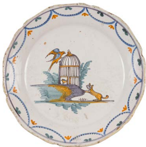
80 Nevers Assiette à bord contourné à décor polychrome au centre d'un oiseau posé sur une cage ouverte observé par un renard. XVIII e siècle. D. : 23 cm Eclats restaurés. 40 / 60 €