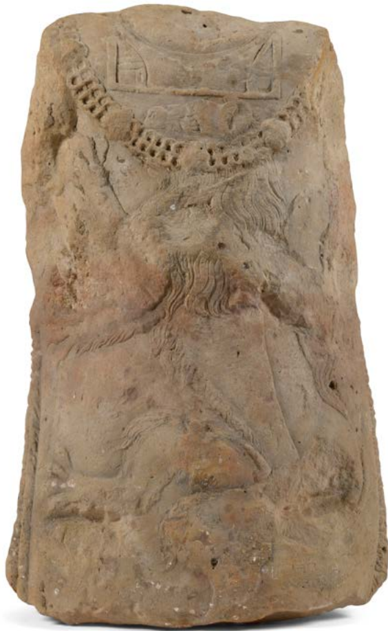
110 France, XVI e siècle Cuirasse de chevalier orné du collier de l'Ordre de Saint Michel et d'un lion passant Pierre Usures et accidents H. : 76 cm 600 / 800 €