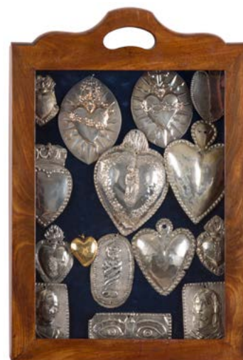
9 ITALIE Ensemble de trois cadres contenant des ex-voto en argent estampé premier titre : 1/ Dix figurant des cœurs enflammés, dont l'un formant reliquaire et un profil de sainte femme, poids : 148 g 2/ Onze figurant des cœurs de différentes inspirations dont l'un en argent doré, deux profils, yeux, bébé emmailloté, poids : 149 g 3/ Quinze figurant des cœurs, une jambe et un cheval au galop de profil, poids : 423 g Dimensions pour deux : hauteur : 47,7 cm - largeur : 32,5 cm, le troisième : hauteur : 60,5 cm - largeur : 42 cm 800 / 1000 €