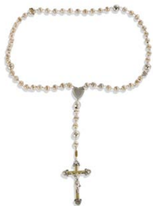
7 Chapelet en argent deuxième titre (sans poinçon) complet de ses cinq dizaines alternées de boules reliées par un cœur et terminé par un Christ en croix (croix en argent doré). Poids : 62 g - longueur : 67 cm 80 / 100 €