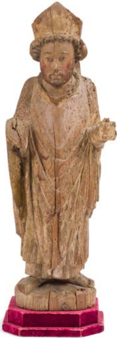
112 Évêque en bois de résineux sculpté avec restes de polychromie XV e siècle H. : 63 cm (restaurations, manques et accidents) 200 / 300 €