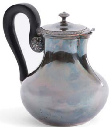
28 PARIS 1819 - 1838 Verseuse marabout en argent piriforme, bec pris sur pièce, le couvercle mouluré d'une frise de godrons tors, prise toupie. Orfèvre : illisible Poids brut : 419 g - hauteur : 16 cm 150 / 180 €