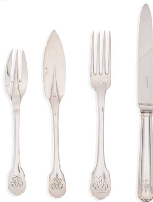
53 PARIS CIRCA 1950 Partie de ménagère en argent, modèle queue de rat polylobé comprenant 48 pièces, gravée d'un chiffre de lettre entrelacées sur la spatule. - 12 fourchettes de table, - 12 couteaux de table, - 12 fourchettes à poisson, - 12 couteaux à poisson Poinçon minerve Orfèvre : Emile PUIFORCAT Poids : 3683 g