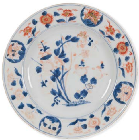
72 Chine Assiette en porcelaine à décor bleu, rouge et or Imari d'arbuste fleuri. XVIII e siècle. D. : 22,5 cm 50 / 60 €