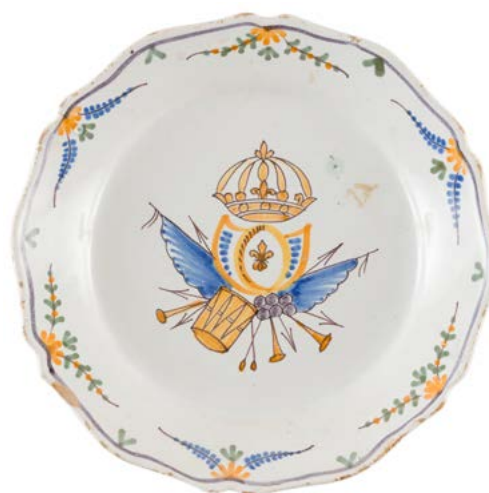
83 Nevers Assiette à bord contourné en faïence à décor polychrome au centre d'une fleur de lis dans un écu sous une couronne royale fermée encadré de drapeaux, tambour, fifres, boulets. XVIII e siècle. D. : 23 cm 40 / 60 €