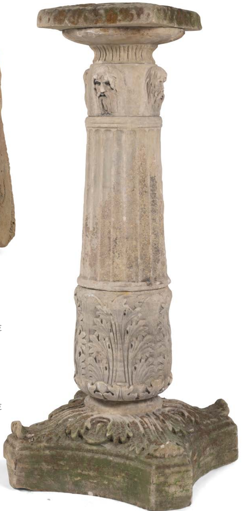
111 École française du XVIII e siècle Colonne en pierre calcaire recomposée de cinq éléments dont des morceaux de fût ornés de mascarons, cannelures et feuilles d'acanthes H. : 183 cm Usures et accidents 2000 / 3000 €