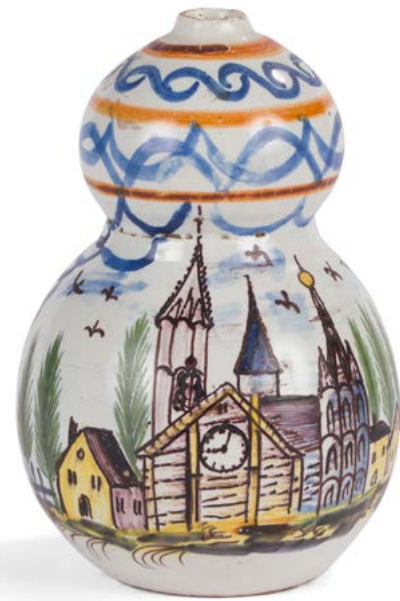
85 Nevers Bouteille à double renflement en faïence à décor polychrome d'une vue de village avec église et motifs d'écaillés imbriquées au revers. XVIII e siècle. H. : 16 cm 150 / 200 €