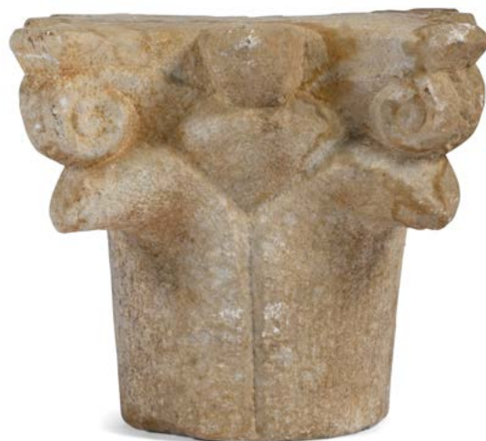
101 Chapiteau en marbre à décor de volutes et feuilles de lotus dans le goût de l'Orient. H. : 28 cm