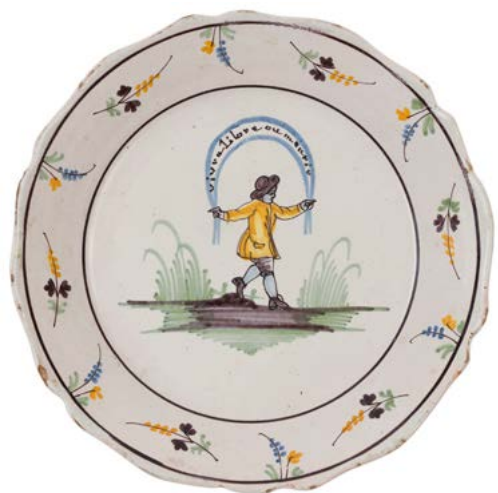
81 Nevers Assiette à bord contourné à décor polychrome révolutionnaire au centre de la réunion des trois ordres : une crosse, une épée et une bêche dans un médaillon sous une couronne surmontant l'inscription à ça ira. XVIII e siècle, période révolutionnaire. D. : 23 cm Une fleur de lis de la couronne grattée, éclats. 80 / 120 €