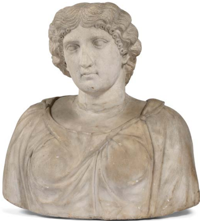
108 École italienne du XVIII e siècle Buste de femme romaine Marbre blanc H. : 60 cm Restaurations au cou et nez, usures 1500 / 2000 €