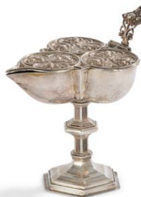
8 HOLLANDE FIN DU XIX e DEBUT XX e SIECLE Navette à encens en argent figurant une nef repoussée de trois médaillons circulaires simulant des vitraux tripartites. Elle repose sur une base à six pans en rappel sur la tige. Orfèvre : JANSSENS & Co TILLBURG Poids brut (base lestée) : 366 g - hauteur : 17,5 cm Etat : fente dans un des pans du nœud 200 / 300 €