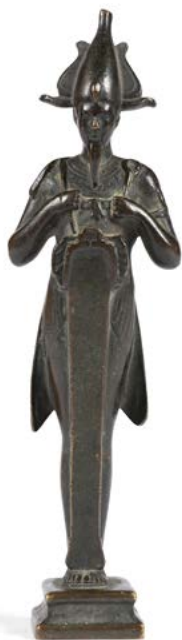
100 École française vers 1900 Osiris Statuette en bronze à patine brune H. : 31 cm