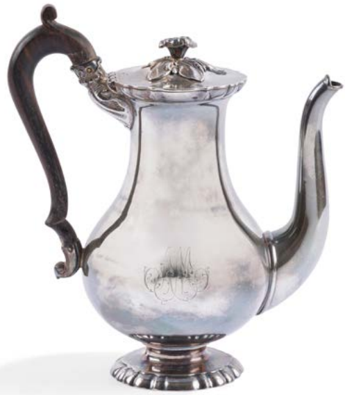
33 PARIS MILIEU DU XIX e SIECLE Verseuse en argent sur piédouche polylobé en rappel sur la bordure du couvercle, le couvercle sommé d'une fleur sur sa terrasse de feuilles. Anses en bois à double point d'accroche. Gravé d'un chiffre de lettres entrelacées. Poinçon minerve Orfèvre ODIOT dans un losange et en toutes lettres situé A PARIS Poids brut : 467 g - hauteur : 20 cm 150 / 180 €