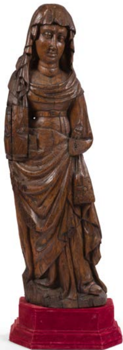
113 Sainte femme en bois sculpté Dans le style du XV e siècle H. : 91 cm