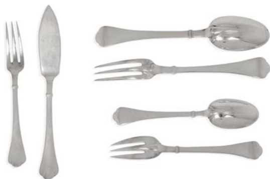
52 PARIS 1930 - 1940 Ménagère en argent, modèle RICHELIEU composée de 70 pièces : - 18 fourchettes de table, - 6 cuillers de table, - 12 fourchettes à entremets, - 11 cuillers à entremets - 11 fourchettes à poisson, - 12 couteaux à poisson, - 1 pelle à gâteaux Poinçon minerve Orfèvre : Emile PUIFORCAT Poids : 5003 g