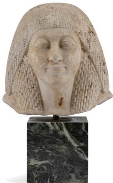
102 Époque moderne Tête égyptienne Marbre H. : 23 cm sur une base cubique en marbre Usures