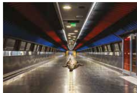
DROIT DE PASSAGE