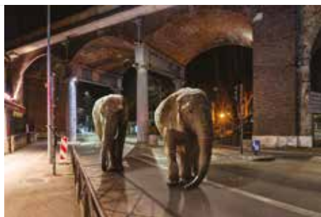
LA BALADE DES PACHYDERMES