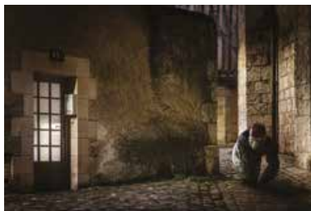
GARE AU GORILLE