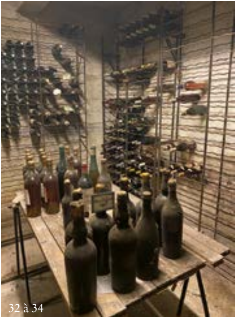
32 à 34