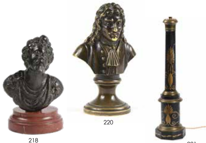
220 Petit bronze à patine doré représentant Molière en buste sur un pied douche.