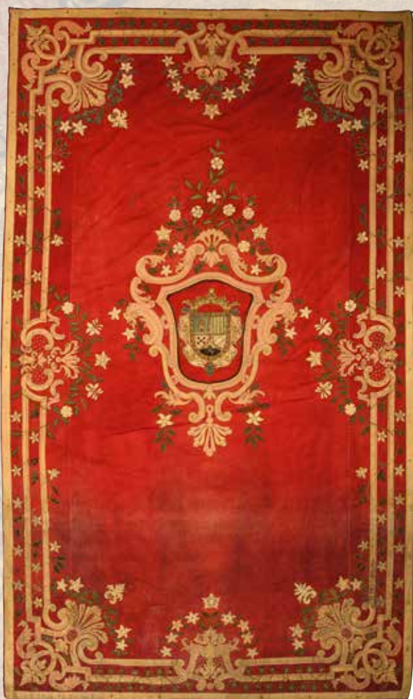
192 Tenture cramoisie à décor polychrome appliqué et brodé de galons, palmettes, rinceaux fleuris et d'armoiries. Probablement Espagne, XIX e siècle. 327 x 191 cm. (Taches, usures)