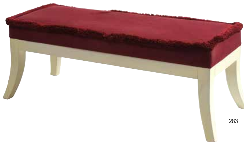
283 Banquette rectangulaire en bois laqué crème à pieds sabres. Couverture de tissu rouge à franges. Probablement BAKER. H. 44 cm. L. 113 cm. P. 44 cm. 300 / 700 €