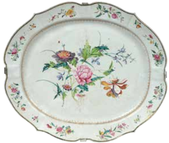
239 Grand plat ovale à bords chantournés, à décor polychrome de fleurs. Etiquette au dos Nicolier Expert, Art céramique ancien. Chine, compagnie des indes, fin du XVIII e siècle. 43 x 50 cm