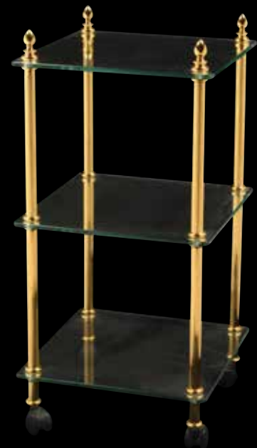
294 Sellette , les montants en bronze doré et cannelé reposant sur des roulettes, trois tablettes en verre. 68 x 33 cm