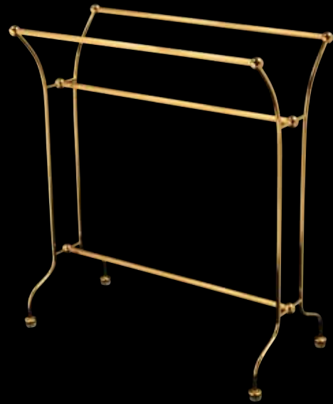
289 Porte-serviette en métal doré en partie cannelé. 69 x 60 x 30 cm