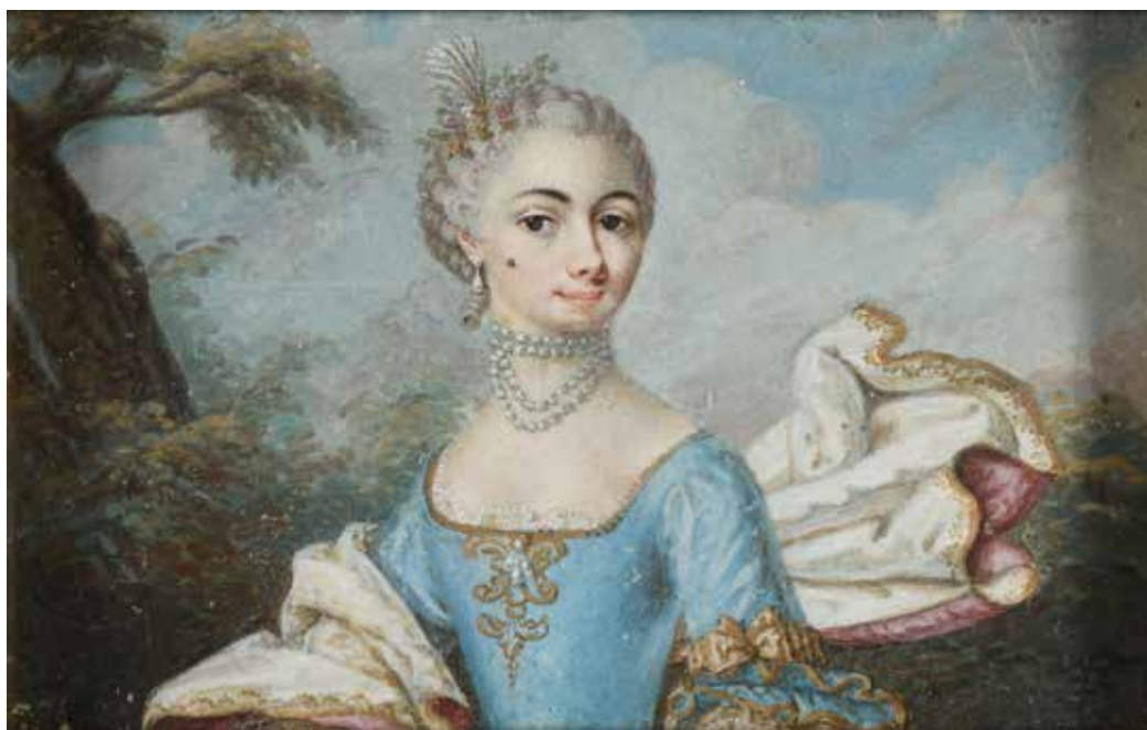
48 ÉCOLE FRANÇAISE, Deuxième Tiers du XVIII e siècle Portrait d'une jeune femme de qualité à la coiffure poudrée, une mouche sur sa joue droite, un collier de perles à deux rangs autour du cou, dans une robe bleue ornée de rubans aux manches, sur fond de parc. Gouache de forme rectangulaire. H. 5,3 - L. 8,7 cm

Provenance : Au revers du carton de support un ancien texte à la plume et encre brune : « Ce portrait m'a été donné par ma mère à Bléville près le Havre, le 19 novembre 1823. Après dit.....qu'il avait été fait à Paris dans le mois d'aout 1759. E. COSTE. / Ma mère est née en avril 1736 ».