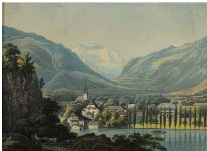
26 ÉCOLE FRANÇAISE du XX e siècle Paysages de villes au bord de l'eau Paire d'aquarelles et gouaches sur papier. 11,5 x 15,5 cm à vue. 150 / 200 €