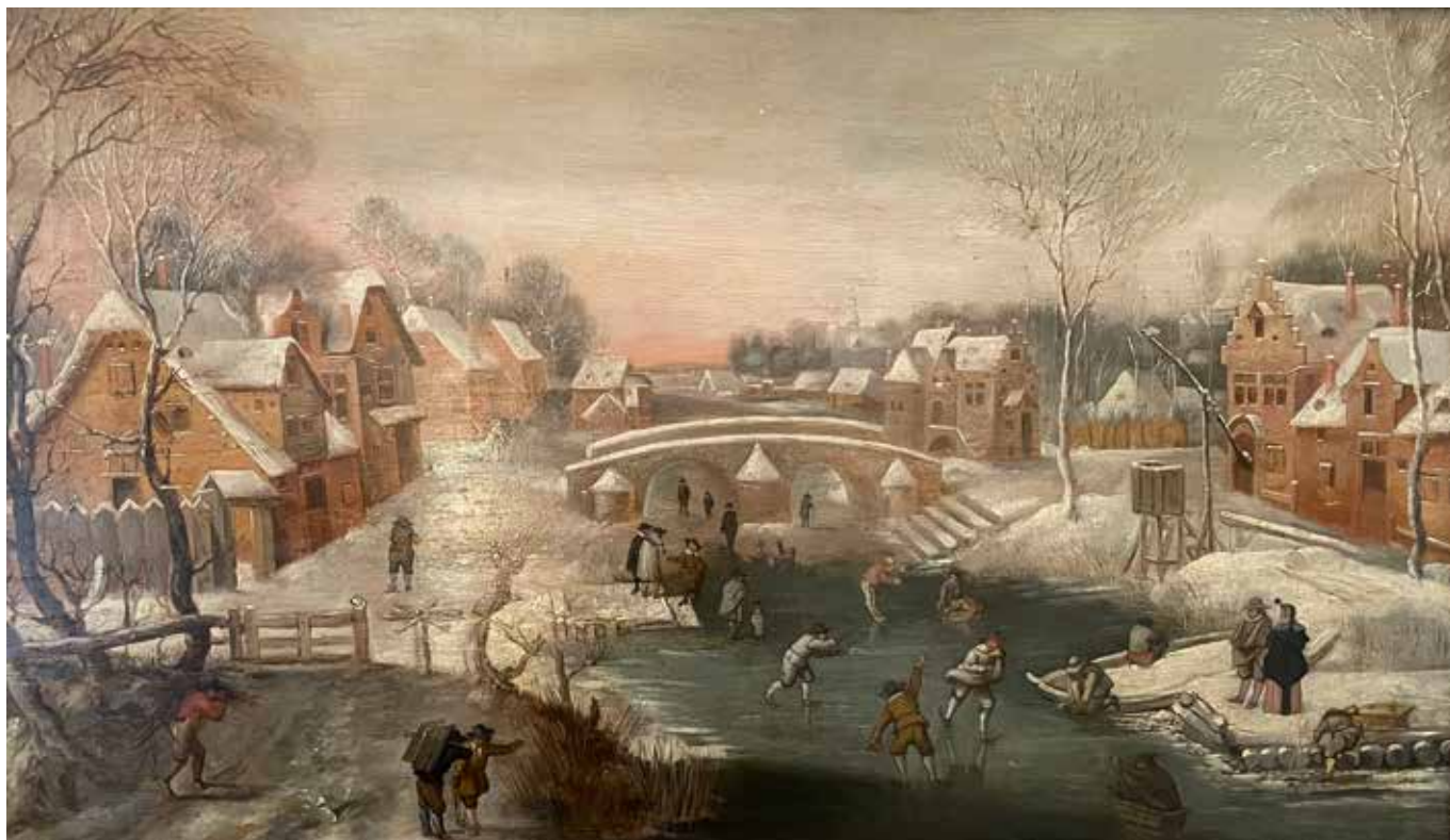
33 Denis VAN ALSLOOT (1570/1628), attribué à Paysage sous la neige Huile sur panneau. 70 x 40 cm