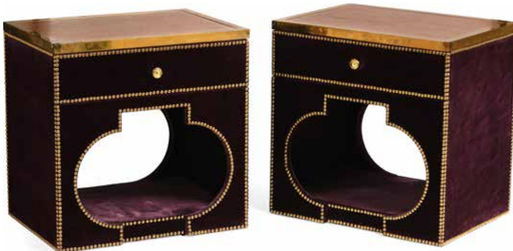
282 Paire de bouts de canapé formant niche recouverts de velours violet clouté, souligné de laiton, ouvrant par un tiroir et un guichet cintré. Jacques GARCIA. H. 66 cm. L. 65 cm. P. 48 cm