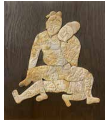
240 bis CHINE. Bas-relief érotique en néphrite céladon blanche. 29 x 26,5 cm