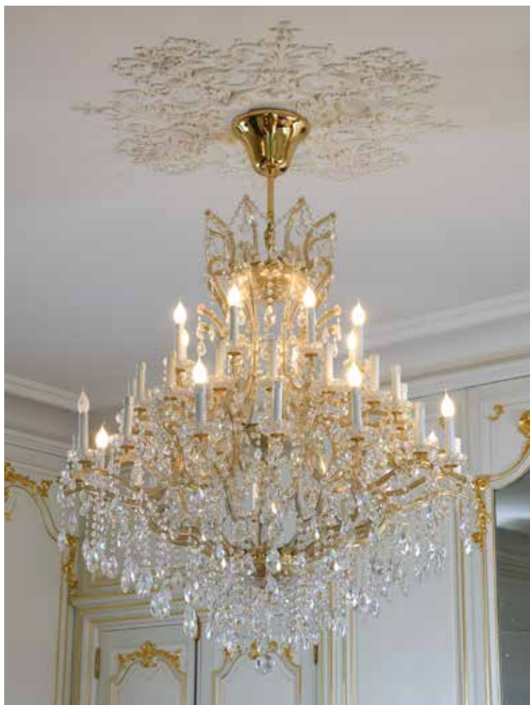
251 Important lustre en laiton doré et cristaux à 45 bras lumières sur 2 rangs. BEBY Italy. H. 190 cm. D. 120 cm 3 000 / 5 000 €