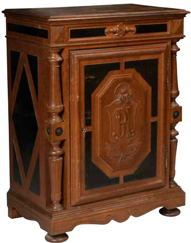
219* Meuble à hauteur d'appui en bois naturel et noirci, les montants à colonnes détachées. Il ouvre par un tiroir en ceinture et un ventail, sculpté d'une coquille et monogrammé HR. Style Napoléon III. 110 x 80 x 50 cm