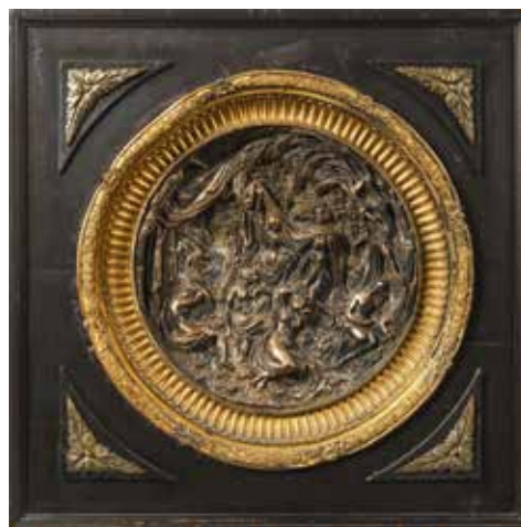
217 École française du XIX e siècle

Nymphes au bain Bas-relief circulaire en bronze argenté dans un encadrement doré à décor de canaux et guirlandes de feuilles.