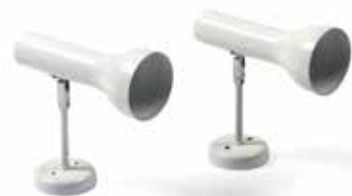
320 SWISSLAMPS INTERNATIONAL Paire d'appliques et une lampe de bureau en métal laqué blanc à bras coulissant pour la lampe. Applique longueur : 21 cm – Lampe hauteur : 57 cm