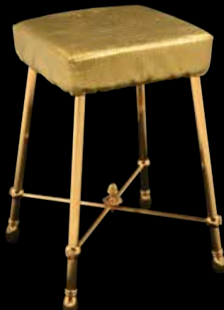
293 CRISTAL & BRONZE Tabouret de salle de bain et métal et bronze doré. L'assise carrée, piètement en bronze doré cannelé réuni par une entretoise surmontée d'une pomme de pin. Assise en skai doré à l'imitation du python. 49 x 31 cm