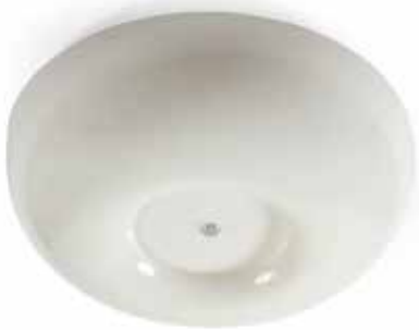
319 SWISSLAMPS INTERNATIONAL Plafonnier hémisphérique à cache ampoule en perspex blanc, structure en métal. Porte son étiquette d'origine et n° 13500. Diam. 49 cm