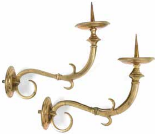
97 Paire de petites appliques en bronze. Italie, XVII e siècle. Long : 21 cm.