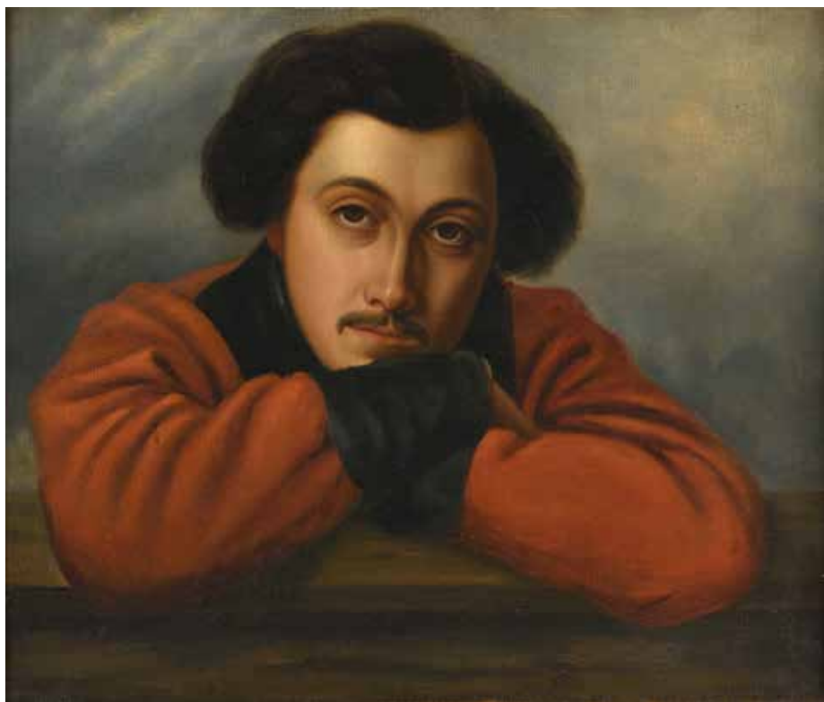
40 ÉCOLE FRANÇAISE du XIX e siècle Personnage accoudé en redingote rouge Huile sur toile. 45,5 x 56 cm Cadre doré.