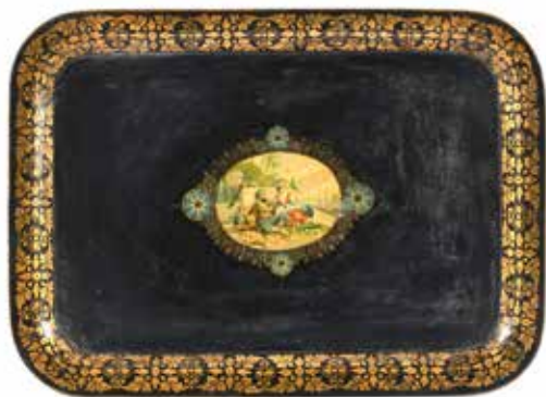
216 Plateau rectangulaire en tôle laqué noir et à décor au centre d'une scène orientaliste, rehauts dorés. Deuxième moitié du XIX e siècle 70 x 50 cm