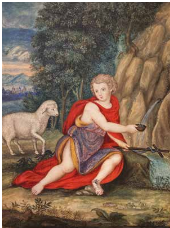
47 ÉCOLE FRANÇAISE Seconde moitié du XVII e siècle Saint Jean-Baptiste à l'agneau près de la source Miniature à la gouache contrecollée sur panneau. H. 14,7 - L. 10,5 cm