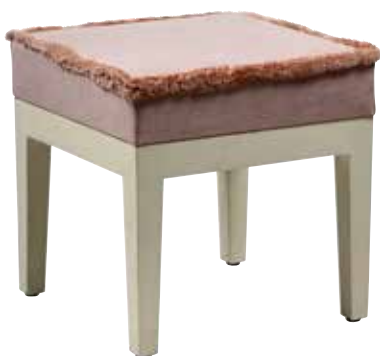
284 Tabouret carré en bois laqué crème à pieds fuselés. Couverture de tissu texturé beige à franges. Probablement BAKER. H. 47 cm. L. 48 cm. P. 48 cm