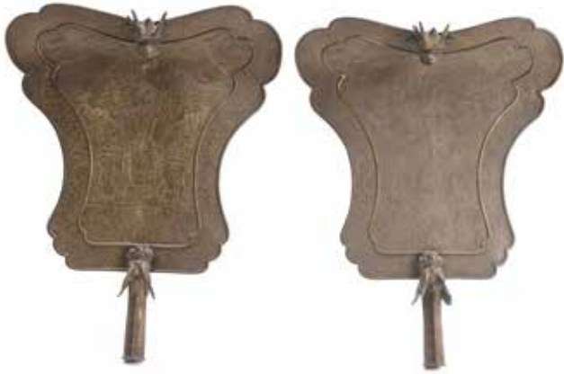
238 Deux éléments d'ornement de trône en cuivre finement ciselé et orné d'un dragon et phénix. Le cartouche en forme de rouleau à décor de calligraphie. Chine du sud, XX e siècle Dim. 57 x 44 cm