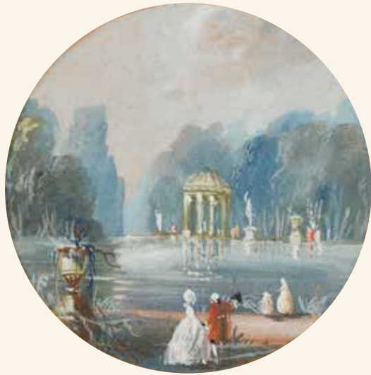
3 École dans le gout du XVIII e siècle Les promenades au parc Paire de gouaches circulaires sur papier. Diamètre : 9,5 cm à vue.