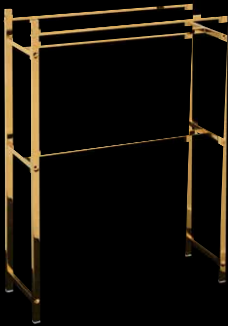
288 Porte serviette en métal doré lisse. 79 x 57,5 x 19,5 cm