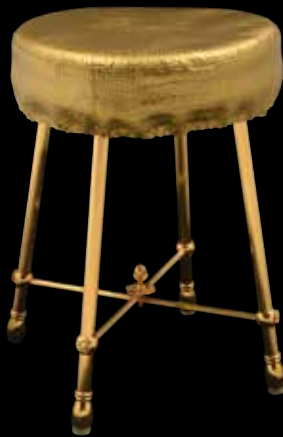
292 CRISTAL & BRONZE Tabouret de salle de bain et métal et bronze doré. L'assise circulaire, piètement en bronze doré cannelé réuni par une entretoise surmontée d'une pomme de pin. Assise en skai doré à l'imitation du python. 49 x 34,5 cm