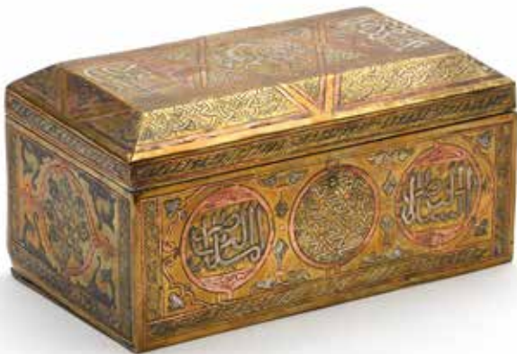
240 Boîte à Coran en laiton et cuivre repoussé à décor d'inscriptions. L'intérieur en marqueterie de paille et de nacre. 12 x 20,5 x 11,5 cm