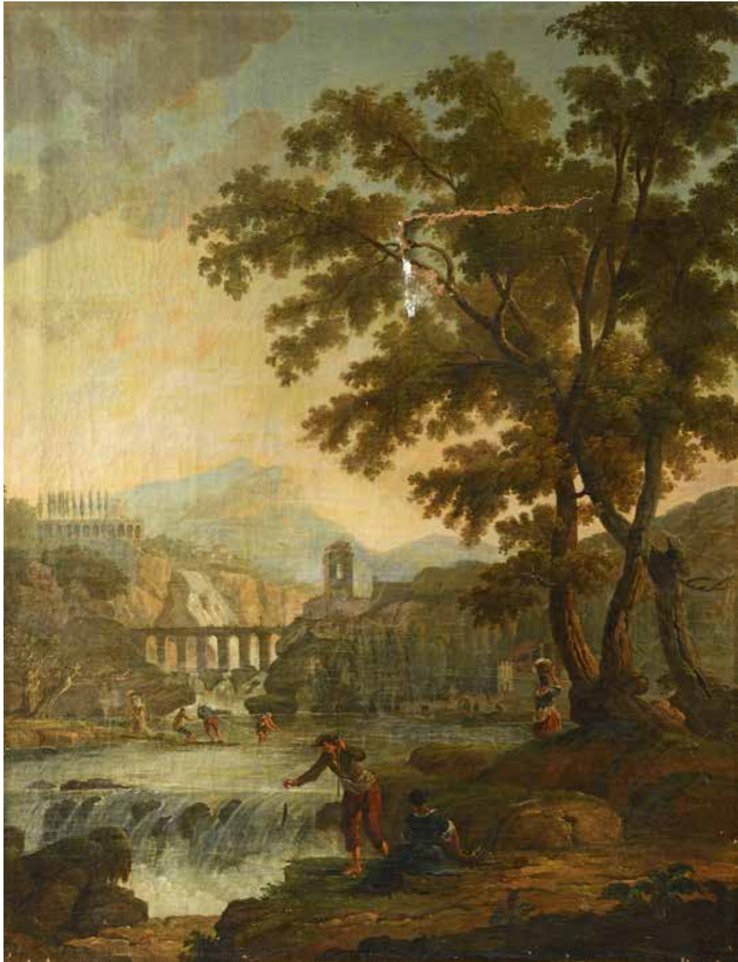
46 Vernet Claude Joseph (1714-1789), suite de Pêcheur à Tivoli Huile sur toile. H. 185 – L. 141,5 cm (Accident en haut à droite)