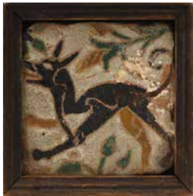
101 Carreau de faïence à décor polychrome d'un chien dans un cadre en bois naturel. Tolède, XVI e siècle. 11,5 x 11,5 cm