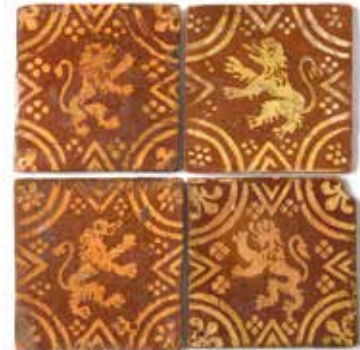
102 Quatre carreaux de pavement à décor de lion dressé. Flandres, XVII e siècle. Chaque : 14 x 14 cm