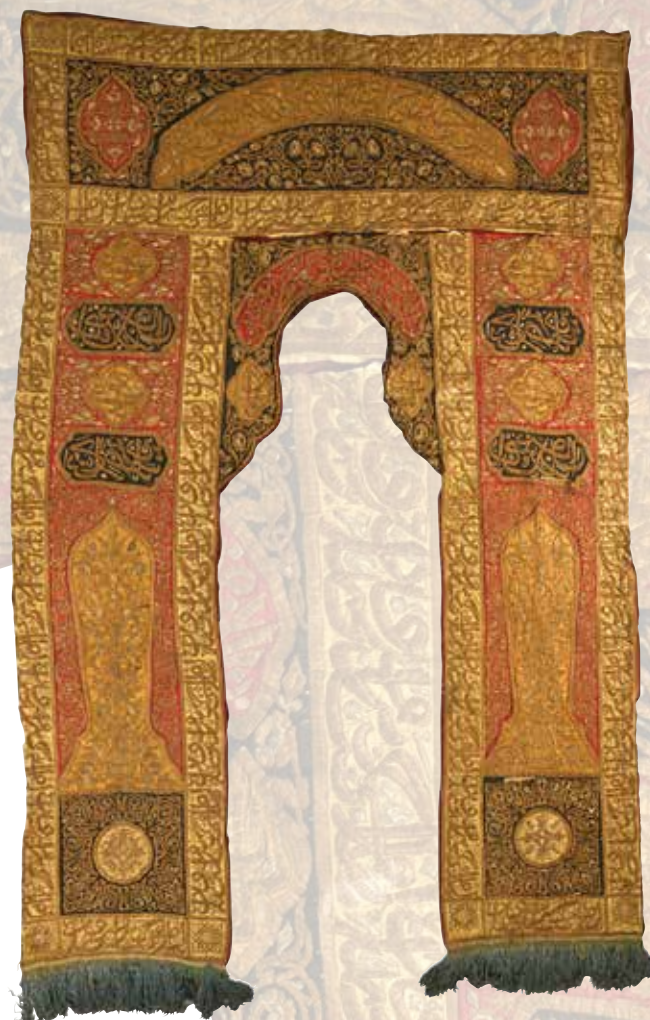
193 Portière de mosquée en satin rouge, ivoire et noir brodé d'inscriptions et rinceaux en fils dorés. Un cintre surmonte des cartouches et deux arcatures sur fond de rinceaux. Doublure de coton rouge et franges bleues en partie basse. Turquie ottomane, fin du XIX e -début du XX e siècle. 320 x 200 cm (Usures et manques)