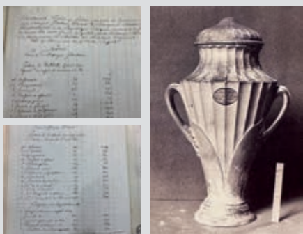
Photographie du plâtre original et documents, provenant de la Manufacture de Sèvres