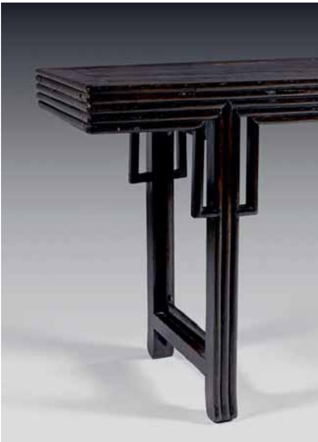
137 CHINE - XX e siècle Importante console en bois laqué noir, la ceinture à l'imitation de cinq tables gigognes. (Accidents et manques). H. 86 cm - L. 285 cm - P. 47,5 cm 2 000 / 3 000 €