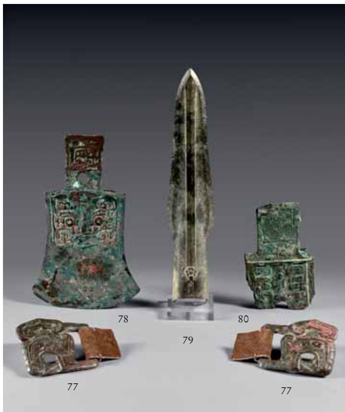
Figure dans l'inventaire de Monsieur J.-C. Moreau-Gobard en date du 1 er juillet 1965, Chine - Terres cuites , p. 3, n°28.