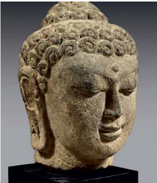
203 INDONÉSIE, Java central - Dans le style de Borobudur Grande tête de bouddha en andésite, les yeux mi-clos, le front orné de l'urna, la coiffe bouclée et surmontée de l'ushnisha. H : 34 cm 1 000 / 1 500 €