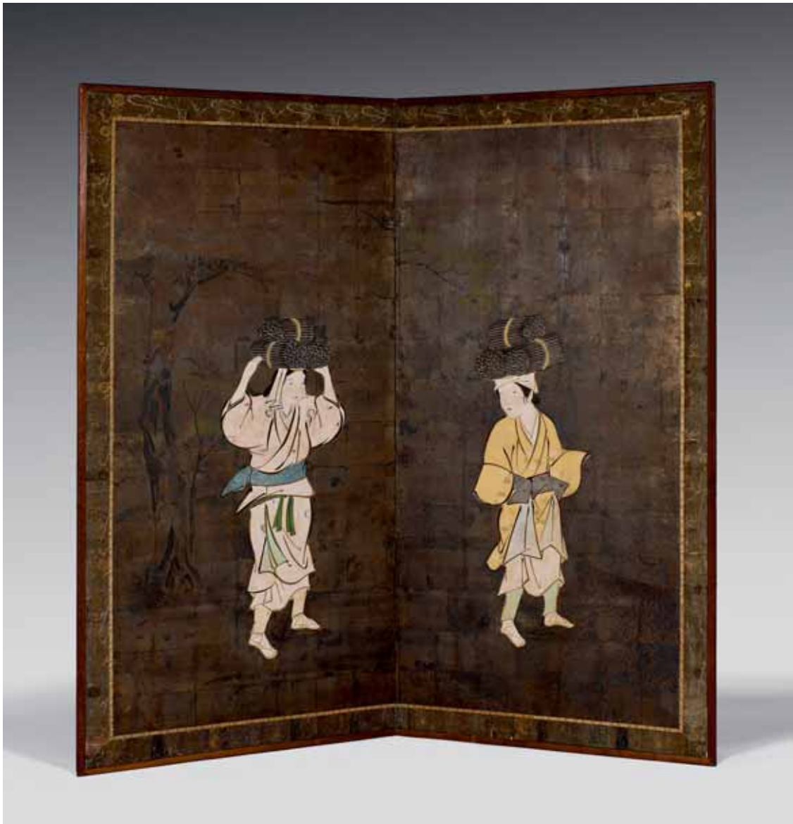
139 JAPON - Époque Edo (1603-1868), XVIII e siècle Paravent à deux feuilles, encre et polychrome sur fond de feuille d'argent, deux porteuses de bois debout, chacune portant un fagot sur sa tête. (Accidents et restaurations). H. 87 cm - L. d'une feuille 174 cm