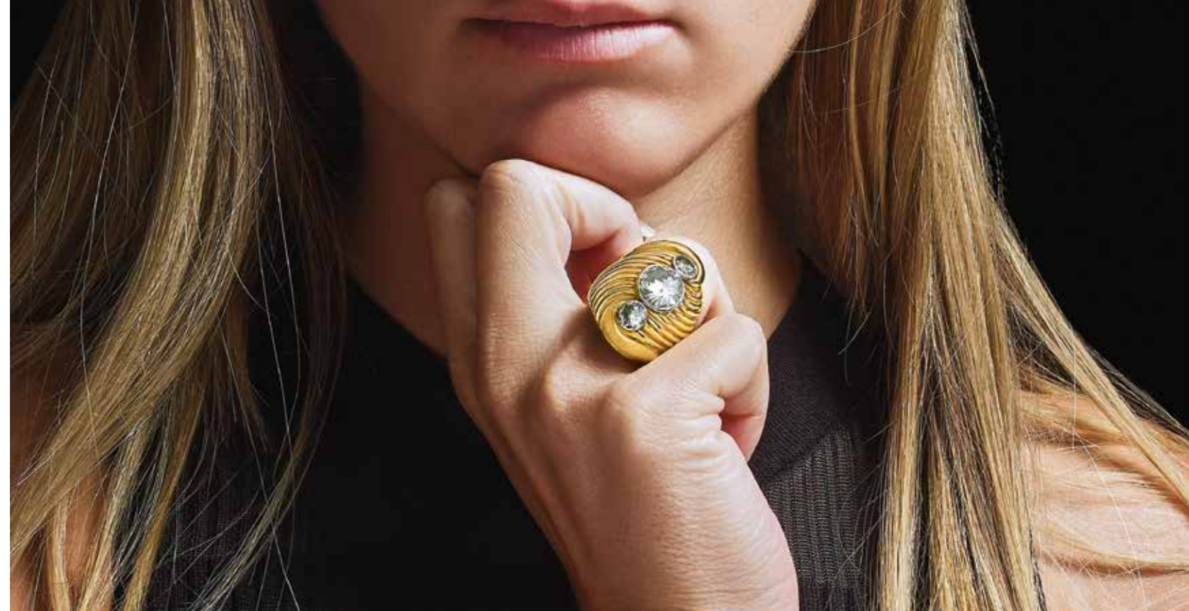
Suzanne Belperron. Bague « Tourbillon godronné ». Vendue 68 900€ en octobre 2023