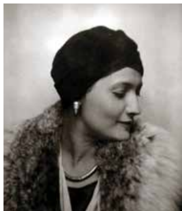
Suzanne Belperron, 1920.

Une personnalité, un caractère... Une figure emblématique du monde de la joaillerie moderne