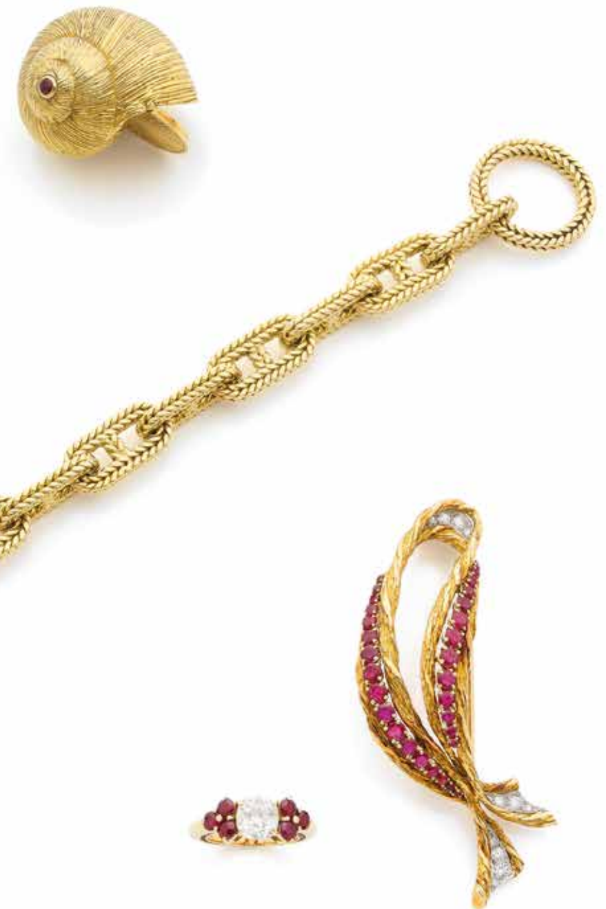
110 MAUBOUSSIN CLIP « FEUILLE » Rubis, diamants Or 18k (750), platine (950) Signé, poinçon de maître Dim.: 8 x 2.5 cm env. - Pb.: 28.7 g A ruby, diamond, gold and platinum clip, signed Mauboussin 2 500 - 3 500 €