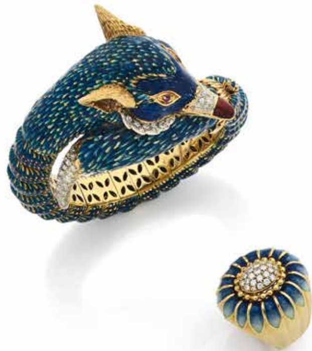
99 FRASCAROLO BRACELET « RENARD » Émail, rubis et diamants taille huit-huit Or 18k (750) Signé Tour de poignet : 16 cm env. - Pb. : 136.3 g An enamel, ruby, diamond and gold bracelet, signed Frascarolo 5 000 - 7 000 €