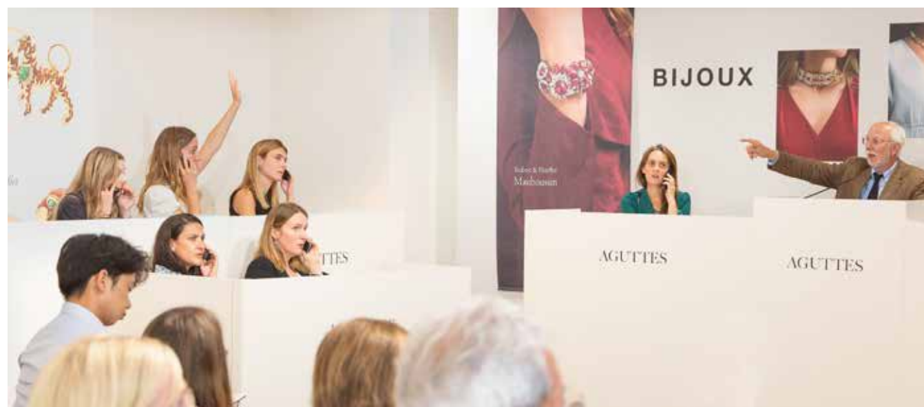
Vente Bijoux ayant totalisé plus de 2 millions d'euros en juillet 2023