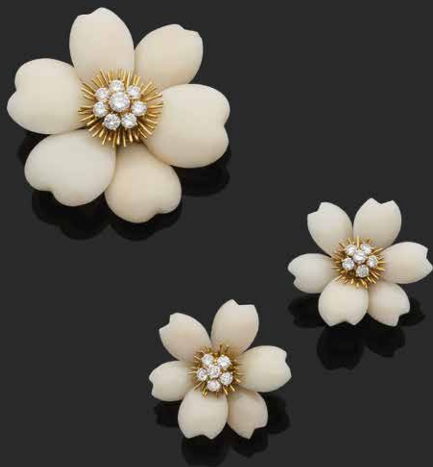
92 VAN CLEEF & ARPELS ENSEMBLE « ROSE DE NOËL » Clip et paire de clips d'oreilles Diamants ronds taille brillant Or 18k (750) Signés et numérotés - Poinçon de maître Vers 1970 Écrin Dim. broche : 5 cm env. - Dim. clips : 3 cm env. Pb. : 50.1 g Diamond and gold earrings and clip, signed Van Cleef & Arpels 20 000 - 25 000 €