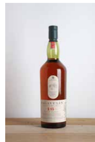
Lot 548 - 1 B Whisky Lagavulin - 16 yo (vintage)

L'ABUS D'ALCOOL EST DANGEREUX POUR LA SANTÉ, À CONSOMMER AVEC MODÉRATION