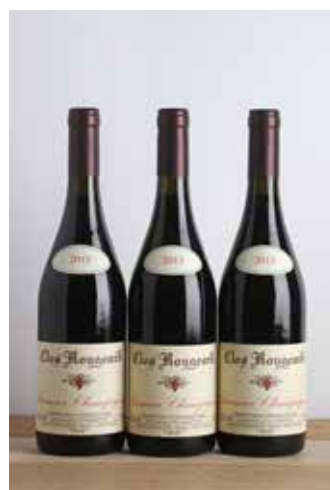
Lot 146 - 3 B Saumur-Champigny Le Clos - 2015 - Clos Rougeard