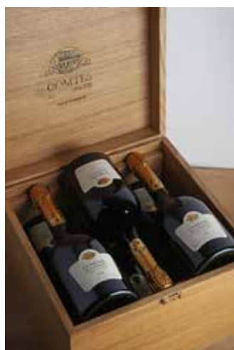
Lot 34 - 6 B Comtes de Champagne - 2006 - Taittinger