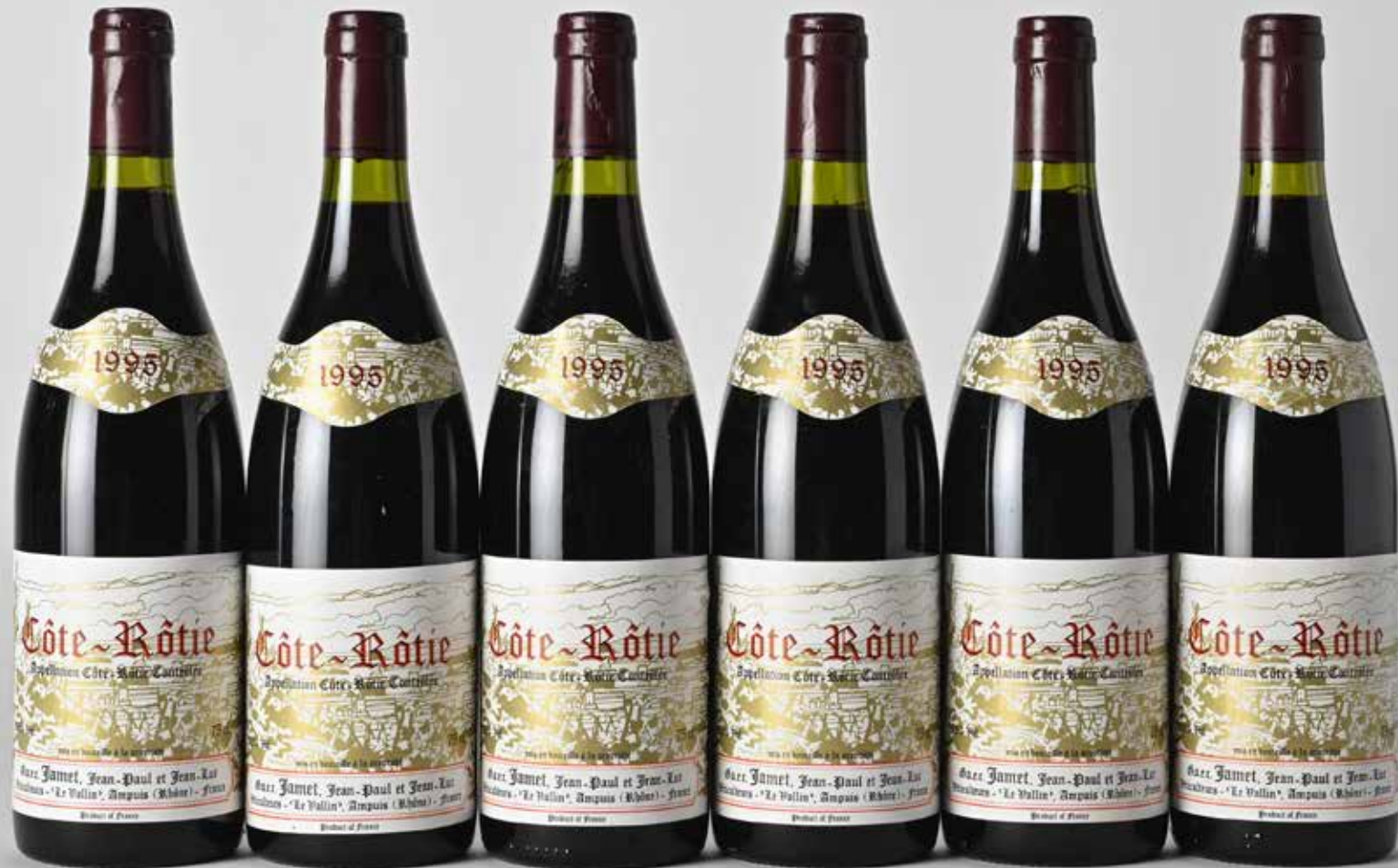
Lot 609 - 6 B Côte-Rôtie - 1995 - Domaine Jamet