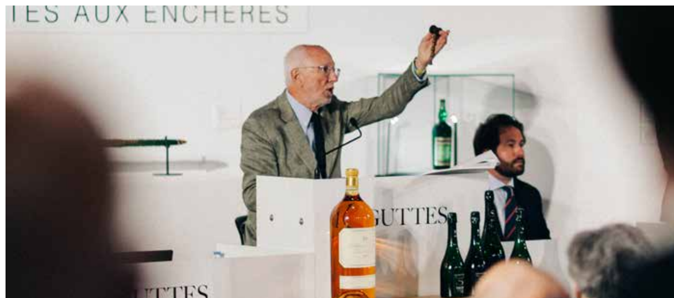
Vente officielle du Tour Auto 2021 ayant totalisé plus de 2 millions d'euros