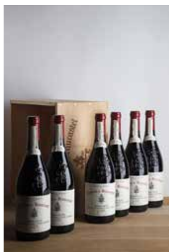
Lot 94 - 6 B CDP Rouge - 2010 - Château de Beaucastel