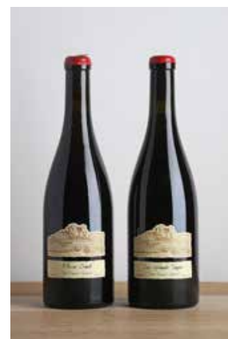
Lot 458 - 2 B Côtes du Jura - Domaine Ganevat