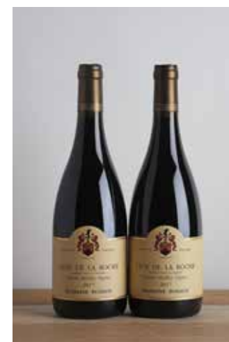
Lot 509 - 2 B Clos de La Roche GC cuvée VV - 2017 - Domaine Ponsot