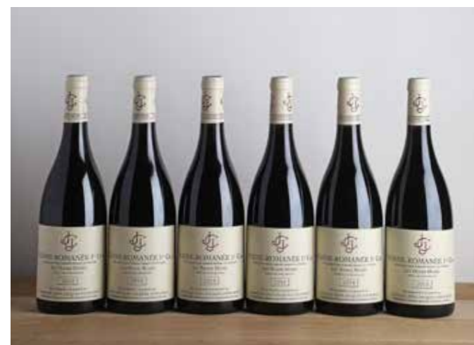
Lot 516 - 6 B Vosne-Romanée Les Beaux Monts 1 er Cru - 2014 - Domaine J.-J. Confuron