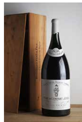
Lot 486 - 1 Mathuzalem Beaune-Grèves Vigne de l'Enfant Jésus 1 er Cru 2004 - Bouchard PF