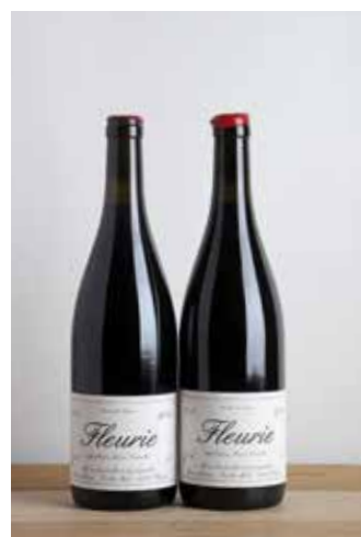
Lot 180 - 2 B Fleurie - 2015 - Domaine Yvon Métras