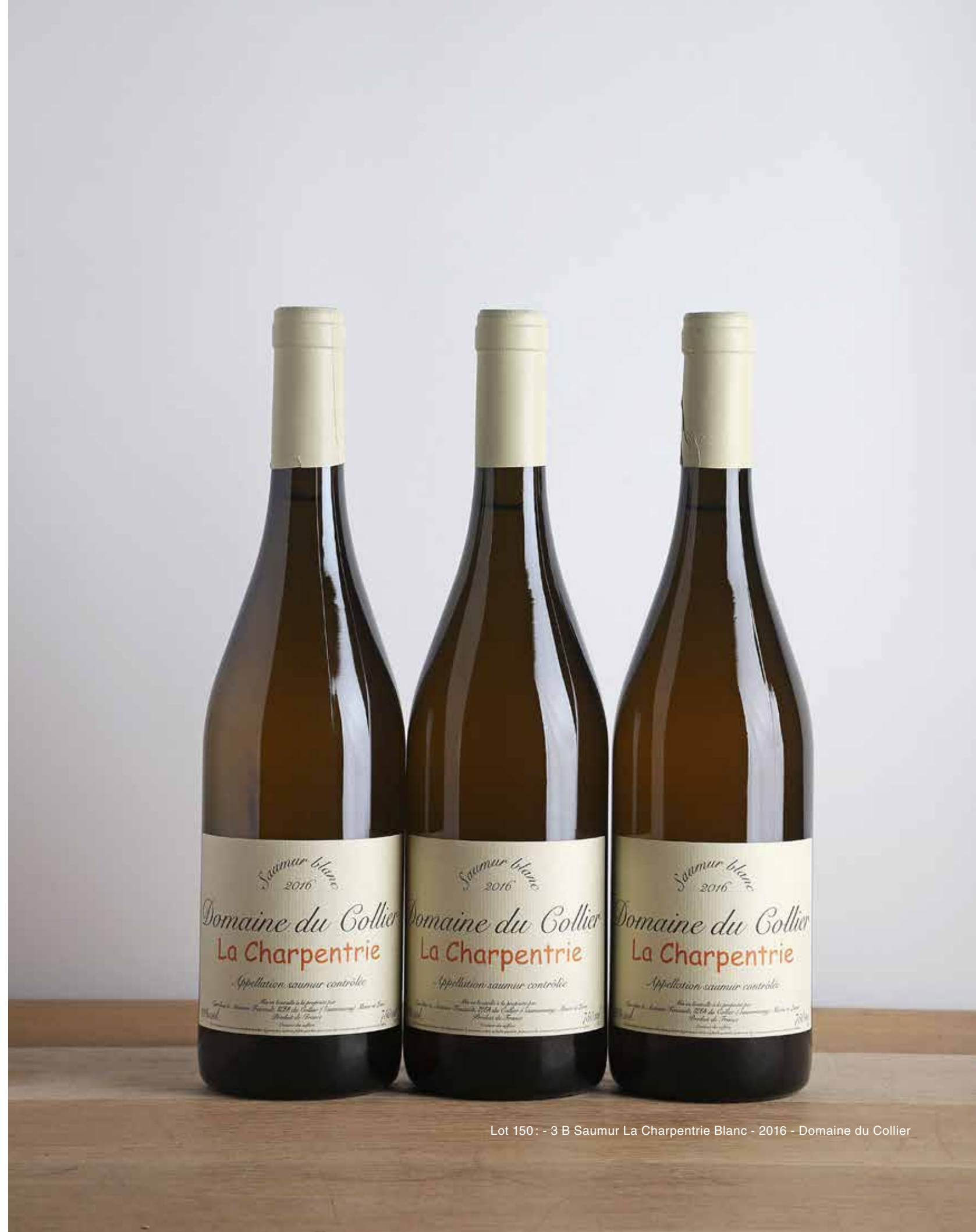
Lot 150 : - 3 B Saumur La Charpentrie Blanc - 2016 - Domaine du Collier

L'ABUS D'ALCOOL EST DANGEREUX POUR LA SANTÉ, À CONSOMMER AVEC MODÉRATION