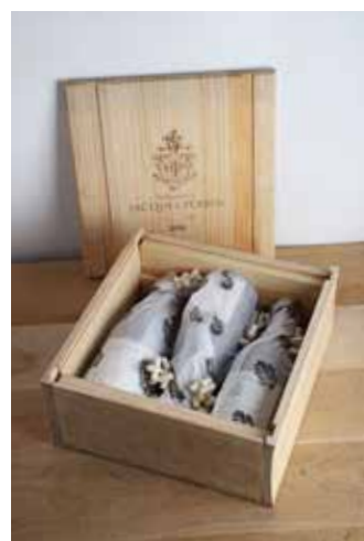
Lot 83 - 3 B CDP Hommage à Jacques Perrin - 2016 - Château de Beaucastel