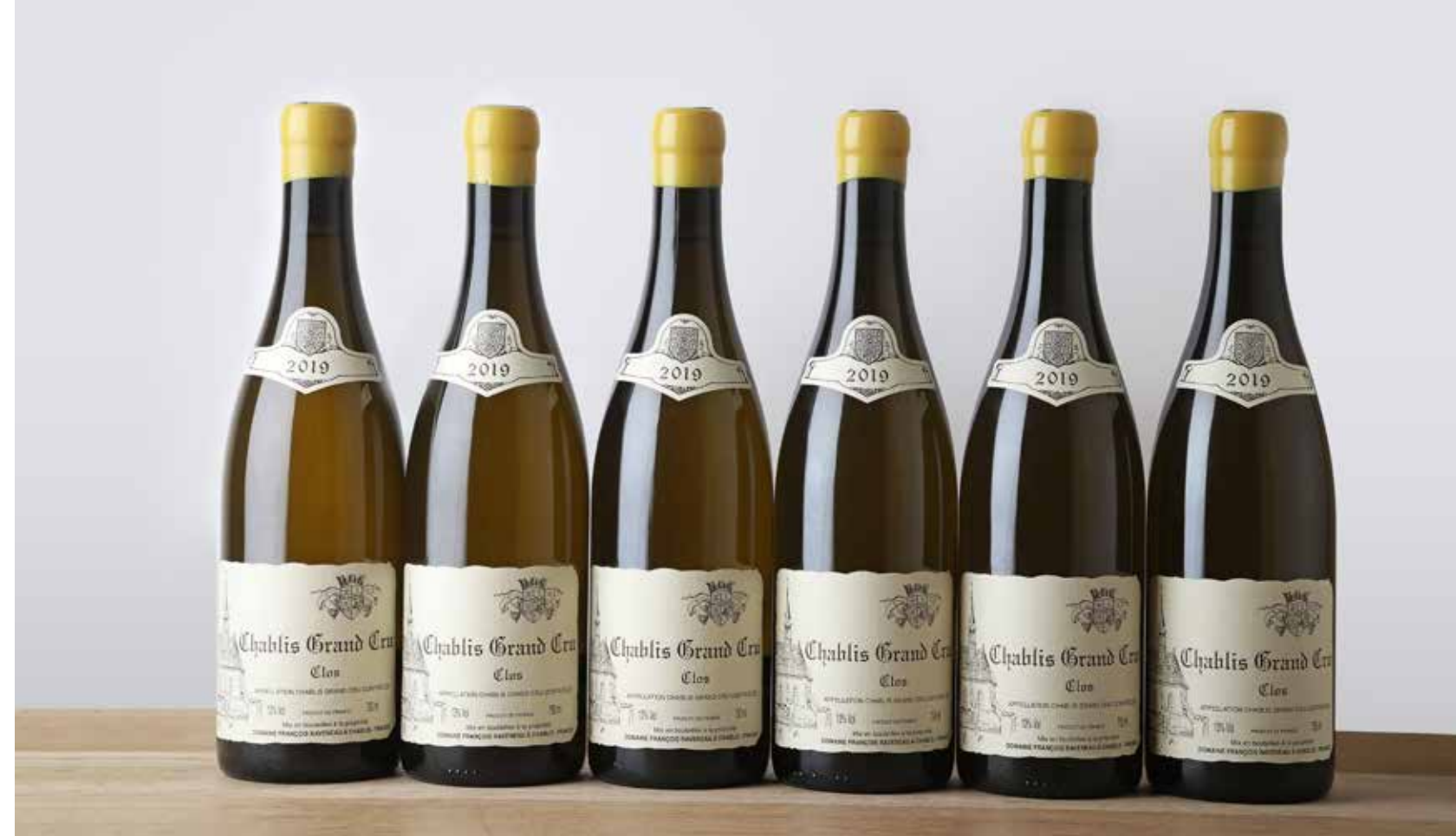
6 B CHABLIS LES CLOS (Grand Cru) - 2019 - Domaine Raveneau. Vendue 7 800€. Prochaine vente en préparation : 27 juin 2024