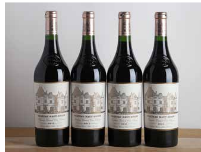
Lot 319 - 4 B Château Haut-Brion - 2015 - GCC1 Graves