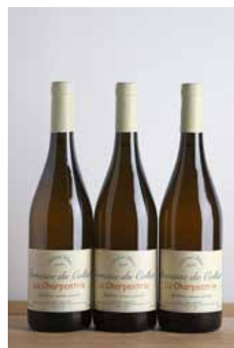
Lot 150 - 3 B Saumur La Charpentrie Blanc - 2016 - Domaine du Collier