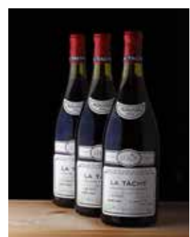
a. 12 bouteilles Chambertin Clos de Bèze (Grand Cru) – 1991 – Domaine Armand Rousseau. VENDUES 117 000€ . b. 1 bouteille Macallan 50 years old Anniversary Malt 1928. VENDUE 86 800€ . c. Caisse assortiment 12 bouteilles – Millésime 2000 – Domaine de la Romanée-Conti. VENDUE 45 800€ . d. 1 bouteille Chartreuse Jaune La Tarragone du Siècle – Pères Chartreux. VENDUE 4 000€ . e. 3 magnums La Tâche (Grand cru) – 1982 – Domaine de la Romanée-Conti. VENDUS 39 400€