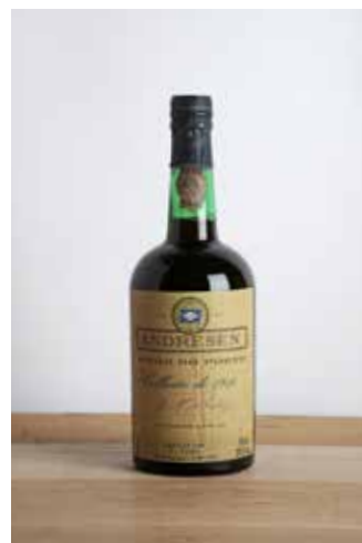
Lot 196 - 1 B Porto Colheita - 1910 - Andresen