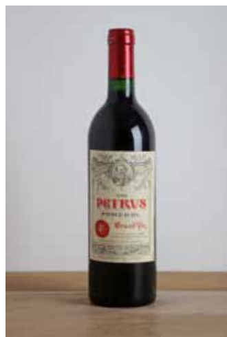
Lot 10 - 1 B PETRUS - 1988 - Pomerol