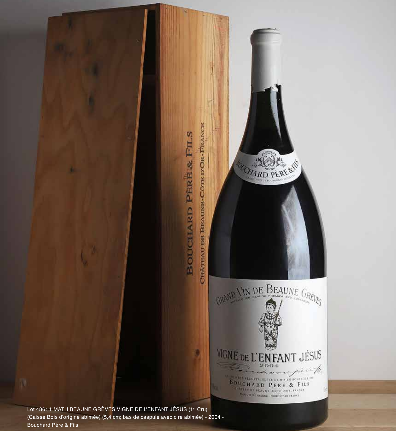
Lot 486: 1 MATH BEAUNE GRÈVES VIGNE DE L'ENFANT JÉSUS (1 er Cru) (Caisse Bois d'origine abimée) (5,4 cm; bas de caspule avec cire abimée) - 2004 - Bouchard Père & Fils