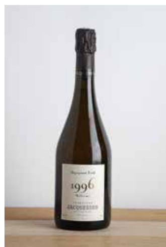
Lot 47 - 1 B Extra-Brut dégorgement tardif - 1996 - Jacquesson