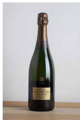
Lot 51 - 1 B Extra-Brut R.D. - 1996 - Bollinger