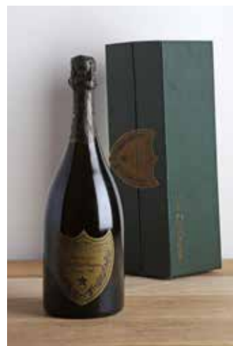
Lot 27 - 1 B Dom Pérignon - 1982 - Moët & Chandon