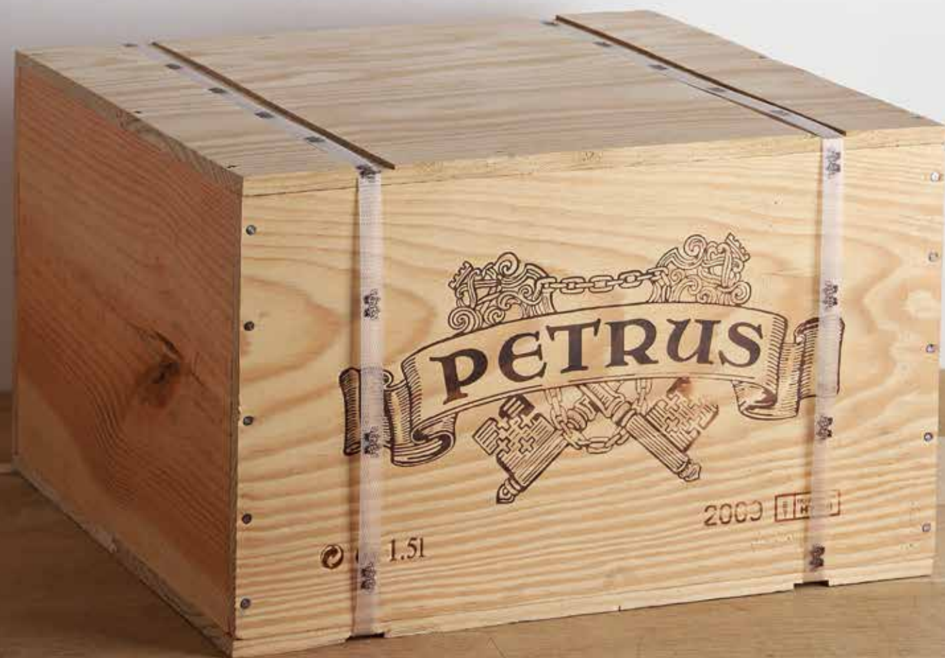
Lot 807 - CBO 6 Magnum Petrus - 2009 - Pomerol