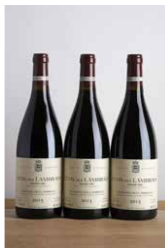
Lot 512 - 3 B Clos des Lambrays GC - 2015 - Domaine des Lambrays