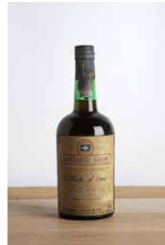
Lot 197 - 1 B Porto Colheita - 1966 - Andresen