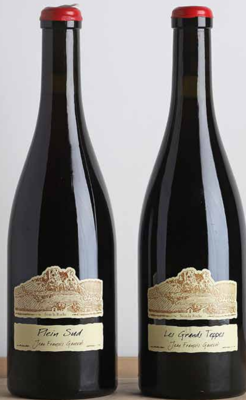
Lot 458 : - 2 B Côtes du Jura - Domaine Ganevat

L'ABUS D'ALCOOL EST DANGEREUX POUR LA SANTÉ, À CONSOMMER AVEC MODÉRATION