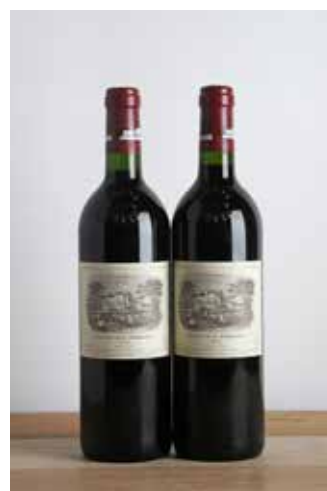
Lot 365 - 2 B Château Lafite Rothschild 1998 - GCC1 Pauillac