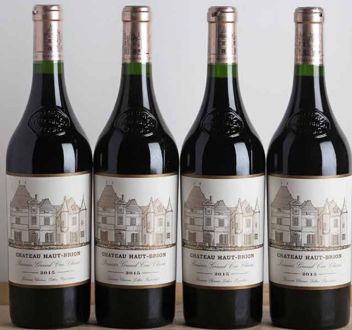
Lot 319: - 4 B Château Haut-Brion - 2015 - GCC1 Graves