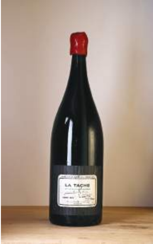
42 1 Jéroboam La Tâche Grand Cru - 1974 Domaine de la Romanée Conti Estimation : 8 000 - 10 000 €