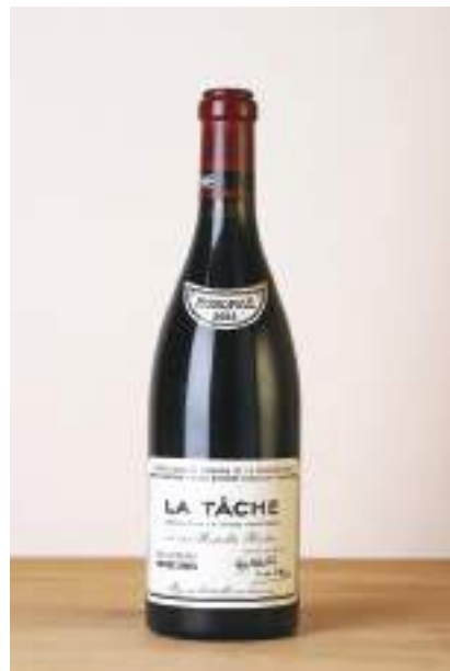
80 1 bouteille La Tâche Grand Cru - 2003 Domaine de la Romanée Conti Estimation : 2 500 - 2 800 €