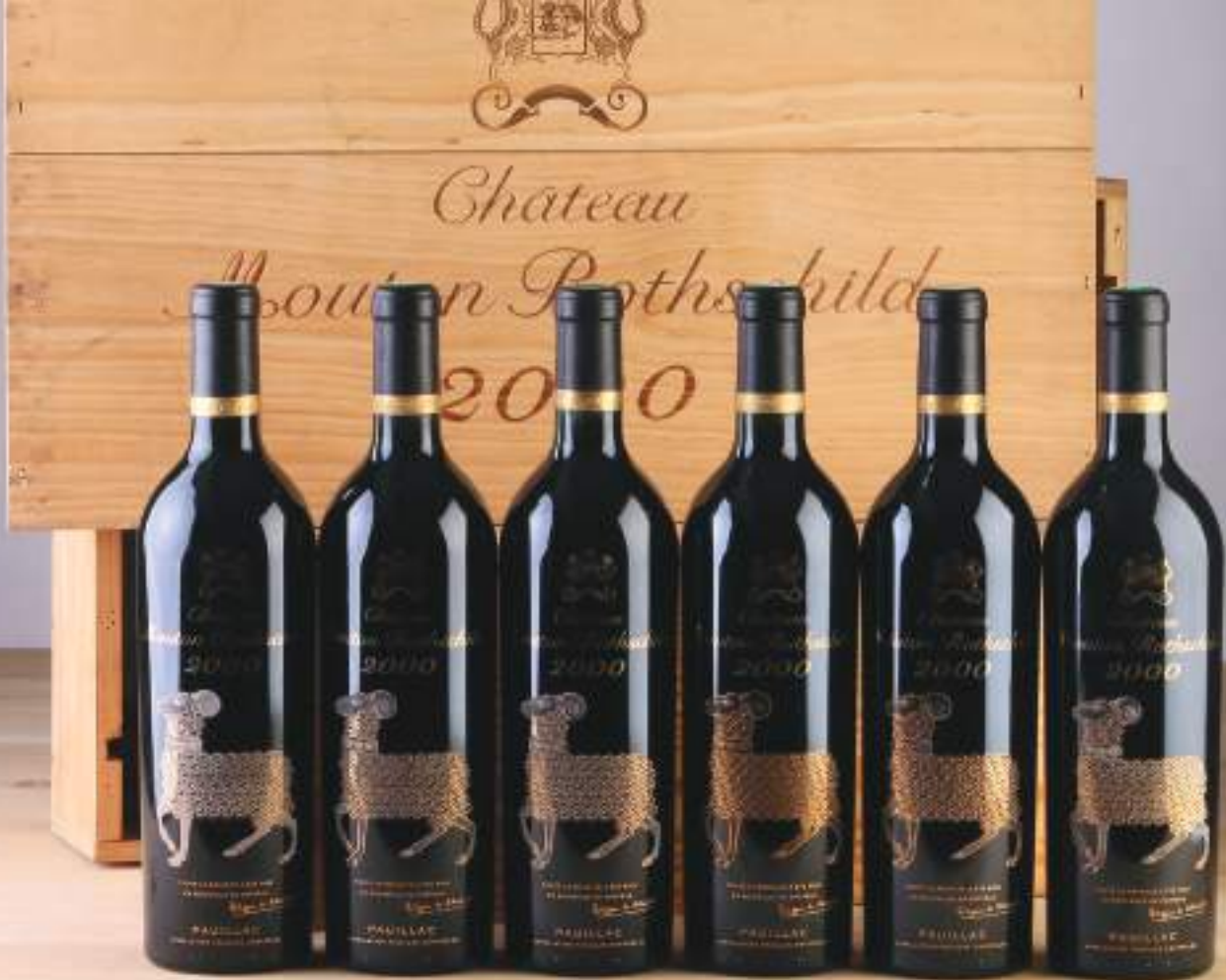
6 bouteilles Château Mouton-Rothschild 2000, 1er GCC Pauillac. Adjugées 10 044 € TTC