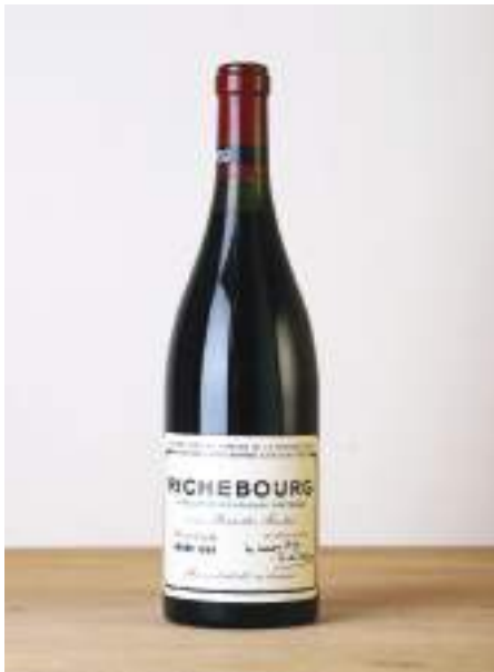
55 1 bouteille Richebourg Grand Cru - 1989 Domaine de la Romanée Conti Estimation : 1 500 - 1 700 €