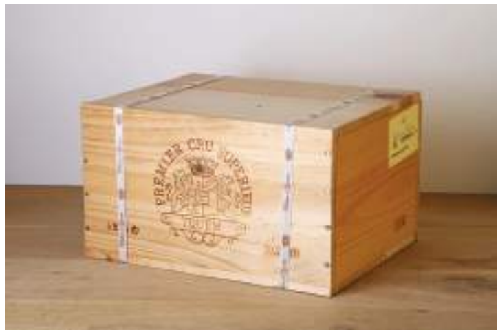
231 6 bouteilles Château d'Yquem - 2007 - C1 Supérieur Sauternes Estimation : 1 380 - 1 500 €

RENDEZ-VOUS DÈS À PRÉSENT SUR AGUTTES.COM POUR DÉCOUVRIR LA LISTE COMPLÈTE DES LOTS, LES PHOTOS ET LES CONDITIONS DE VENTE.