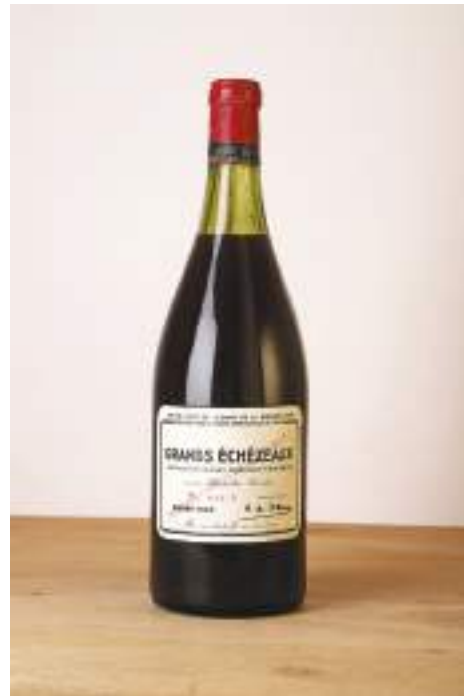
173 1 Magnum Grand-Échézeaux Grand Cru - 1969 Domaine de la Romanée Conti Estimation : 1 600 - 1 800 €