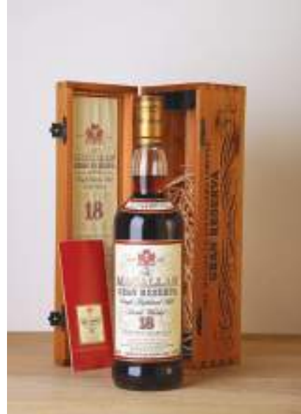
156 1 bouteille Whisky Macallan Single Highland Malt « Gran Reserva » - 18 ans d'âge (distillé en 1979; mise en bouteille en 1997) Estimation : 2 800 - 3 200 €