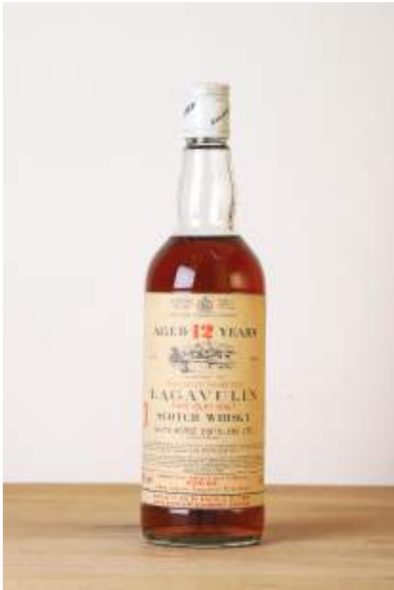
168 1 bouteille Whisky Pure Islay Malt Speciality Selected 12 ans d'âge 75 Cl 43% (embouteilleur White Horse Distillers; importateur Corima) - NM - Lagavulin Estimation : 2 000 - 2 200 €