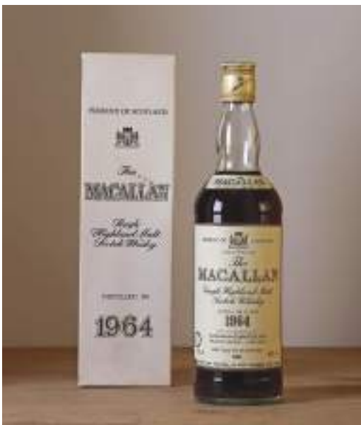
75 1 bouteille Whisky Macallan Single Highland Malt 1964 « Special Selection » - 18 ans d'âge (mise en bouteille en 1982) importateur Corade Estimation : 2 500 - 2 800 €