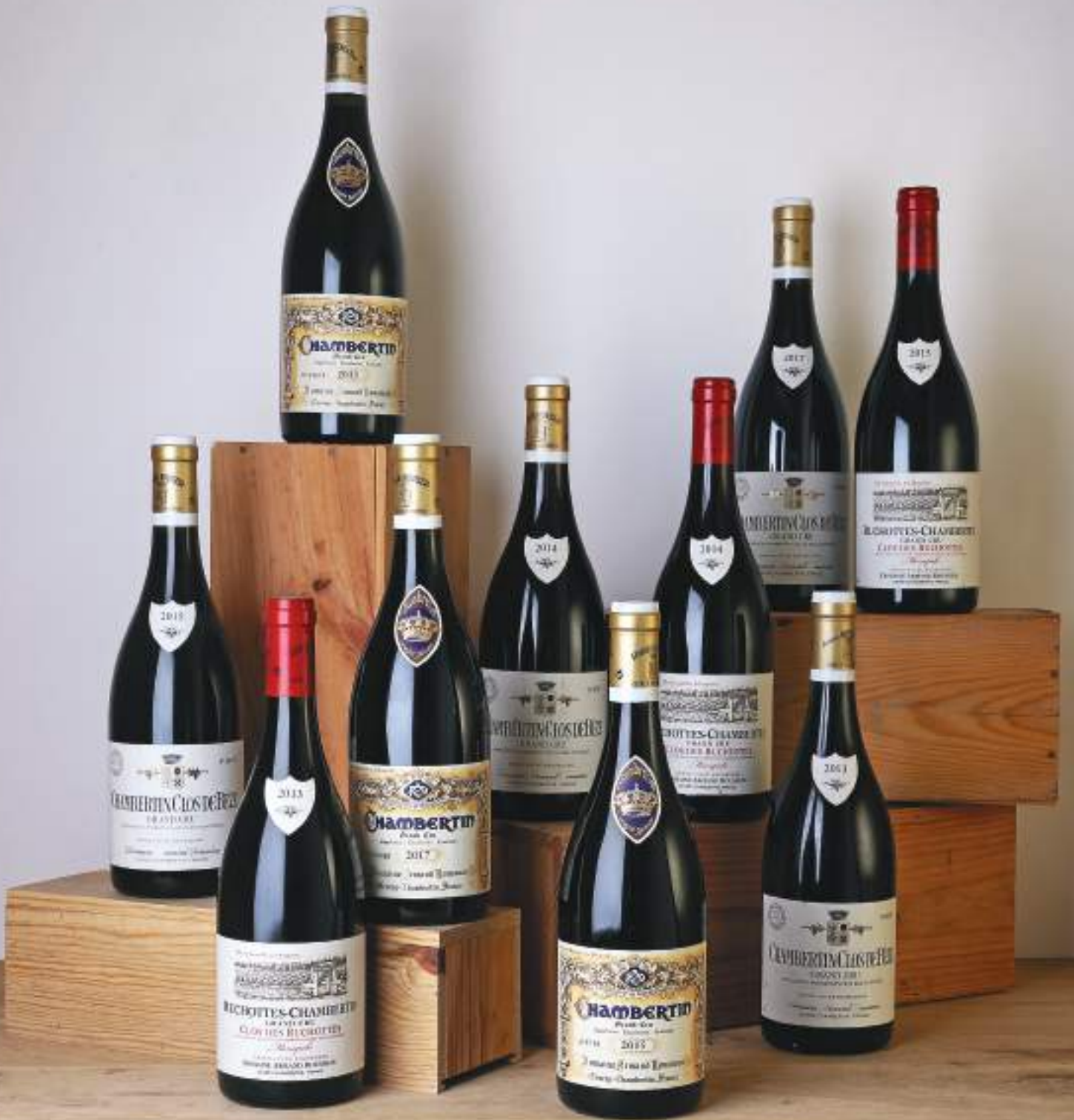
Vue d'ensemble des lots n°43 à 55, issus du Domaine Armand Rousseau.