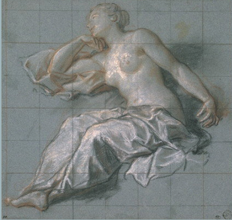
Antoine Coytel, Nymphe , étude pour La Descente d'Enée aux Enfers , 1715-17, musée du Louvre.

Les personnages qui peuplent la partie inférieure du dessin sont observés sous différents angles, et certains sont représentés en fort raccourci tandis que d'autres sont dessinés parallèlement au plan du dessin, faisant pleinement face au regardeur. Dans la partie supérieure de la feuille, Coytel complète le ciel par de petits groupes d'angelots joufflus qui rééquilibrent habilement l'arrière-plan moins dense, orné de nuées rendues par des hachures enlevées à la pierre noire. Le traitement virtuose de l'espace dans le dessin imprime la force du mouvement plus que le sentiment de profondeur, et la scène resplendit par sa capacité à créer un univers parfaitement imaginaire.