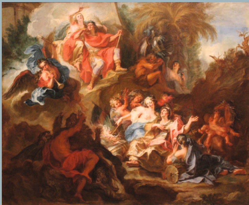
Antoine Coypel, Louis XIV couronné par la Gloire après la Paix de Nimègue en 1678 , musée Fabre, Montpellier.

Ce dessin est archétypal de l'art de Coypel à son apogée : la composition, poussée par un souffle ascendant, est construite suivant une ligne diagonale par rapport au plan du dessin. La scène transmet une sensation de dynamisme et de densité créée par les grappes de personnages pris dans un mouvement tourbillonnant autour du noyau central. La richesse formelle des tons est offerte par la technique des trois crayons (typique de la dernière étape, la plus finie, des dessins préparatoires de Coypel) et par la lumière centrale prodiguant une chaleur à l'ensemble. Elle trouve également un écho dans la richesse iconographique symbolisée par la corne d'abondance tenue par le personnage du coin inférieur gauche, ainsi que par la multitude de guirlandes fleuries et la superposition des drapés majestueux.