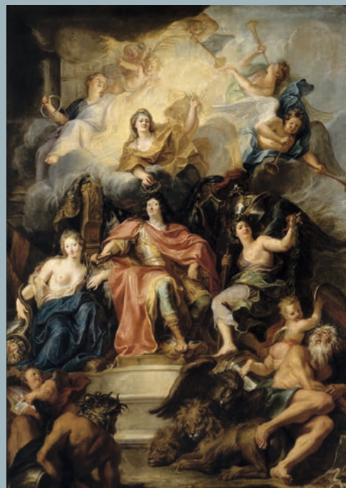
Antoine Coypel, Allégorie à la gloire de Louis XIV (allusion à la Trêve de Ratisbonne signée le 15 août 1684), Musée du Château de Versailles et du Trianon.