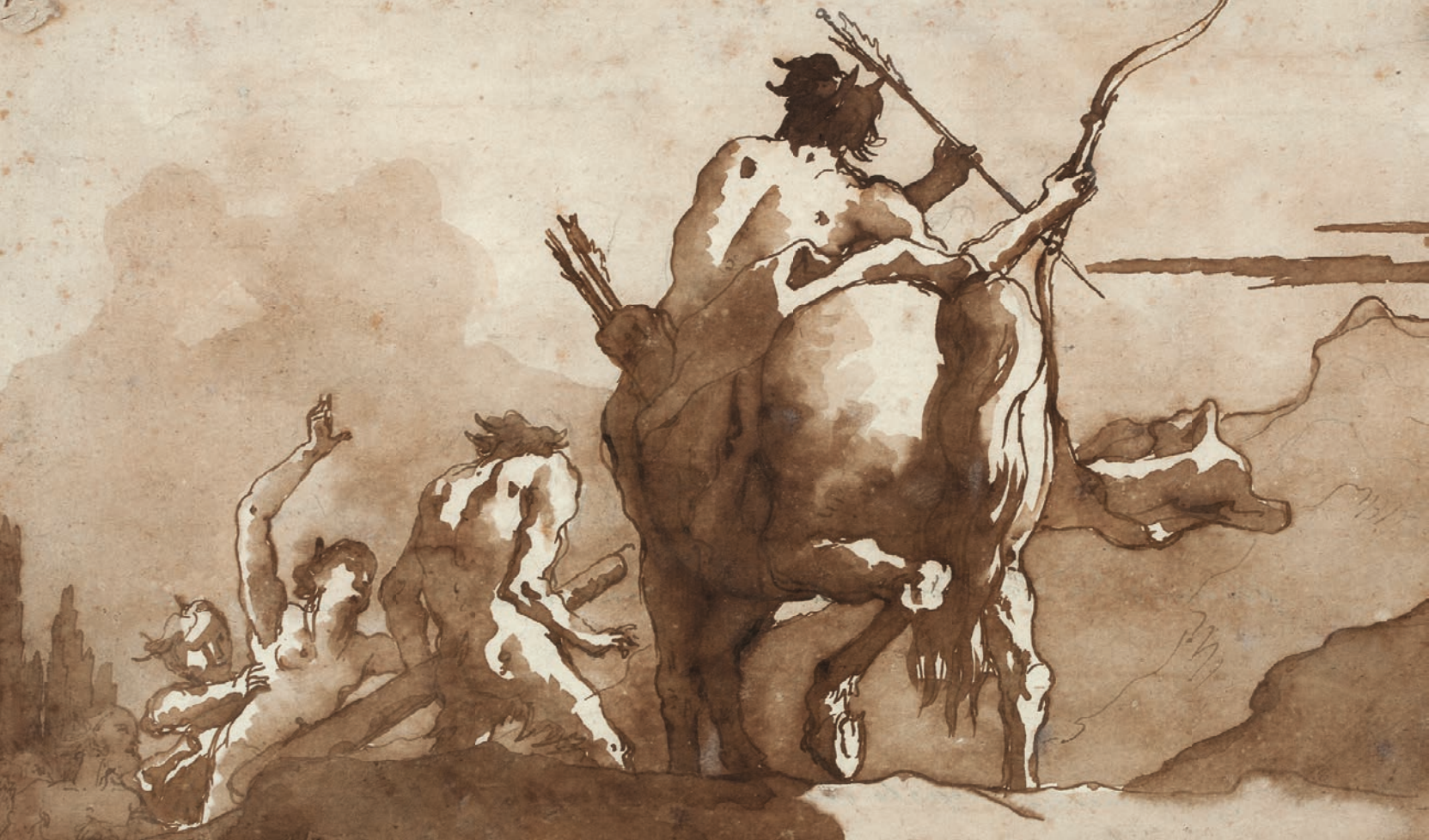
Giovanni Domenico Tiepolo (Venise 1727 - 1804). Centaure et faunes enlevant une nymphe . Adjudé 28 600 € TTC