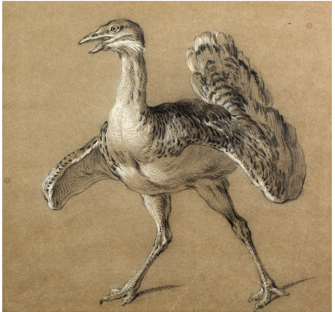
140 JEAN-BAPTISTE OUDRY (PARIS, 1686 – BEAUVAIS, 1755)