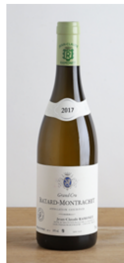
Lots 238 à 243