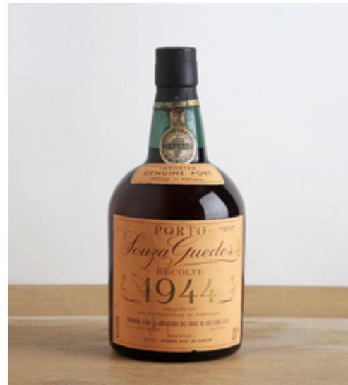
Lots 670 & 671