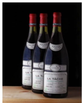
a. 12 bouteilles Chambertin Clos de Bèze (Grand Cru) – 1991 – Domaine Armand Rousseau. VENDUES 117 000 € . b. 1 bouteille Macallan 50 years old Anniversary Malt 1928. VENDUE 86 800 € . c. Caisse assortiment 12 bouteilles – Millésime 2000 – Domaine de la Romanée-Conti. VENDUES 45 800 € . d. 1 bouteille Chartreuse Jaune La Tarragone du Siècle – Pères Chartreux. VENDUE 4 000 € . e. 3 magnums La Tâche (Grand cru) – 1982 – Domaine de la Romanée-Conti. VENDUS 39 400 €

Prochaines ventes en préparation 1 er octobre et 28 novembre 2024