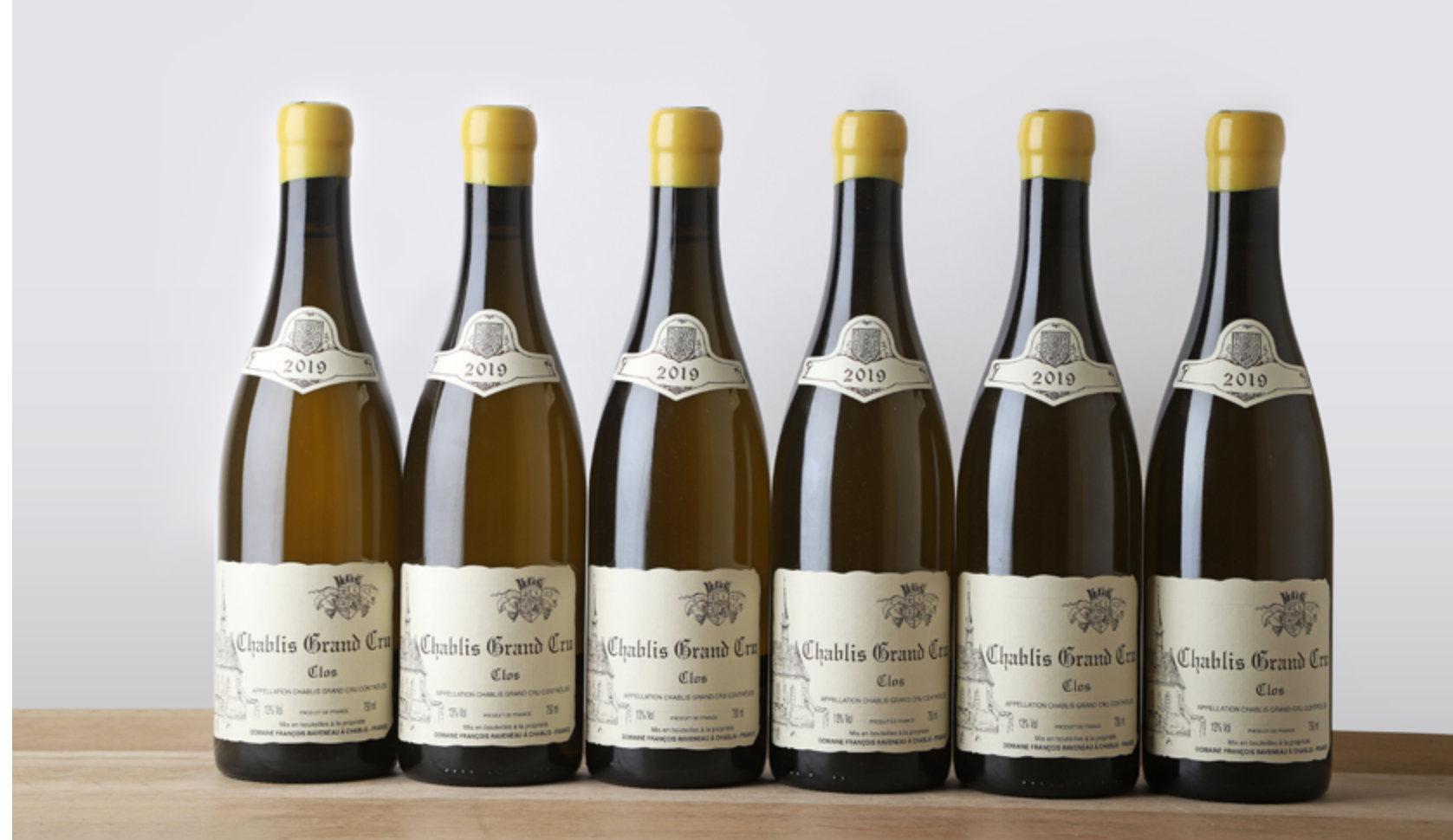
6 B CHABLIS LES CLOS (Grand Cru) - 2019 - Domaine Raveneau. Vendue 7 800 €. Prochaine vente en préparation : 27 juin 2024