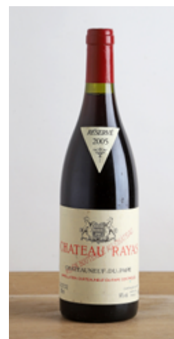
Lots 231 & 232