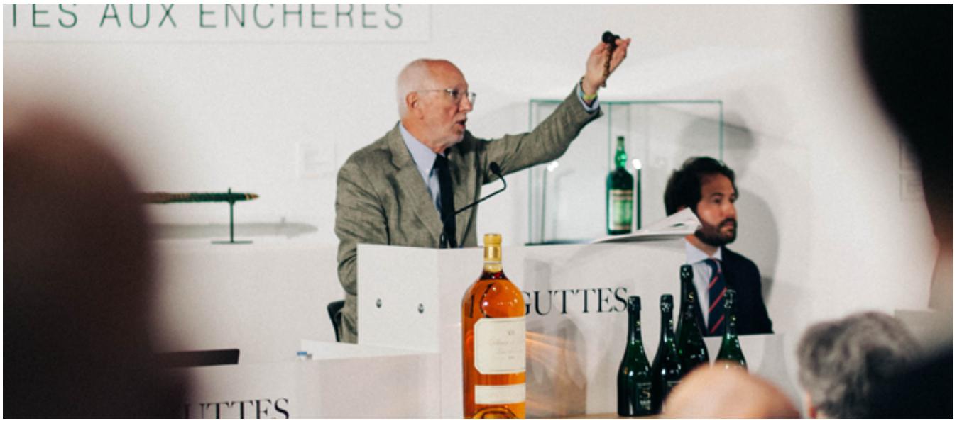
Vente officielle du Tour Auto 2021 ayant totalisé plus de 2 millions d'euros