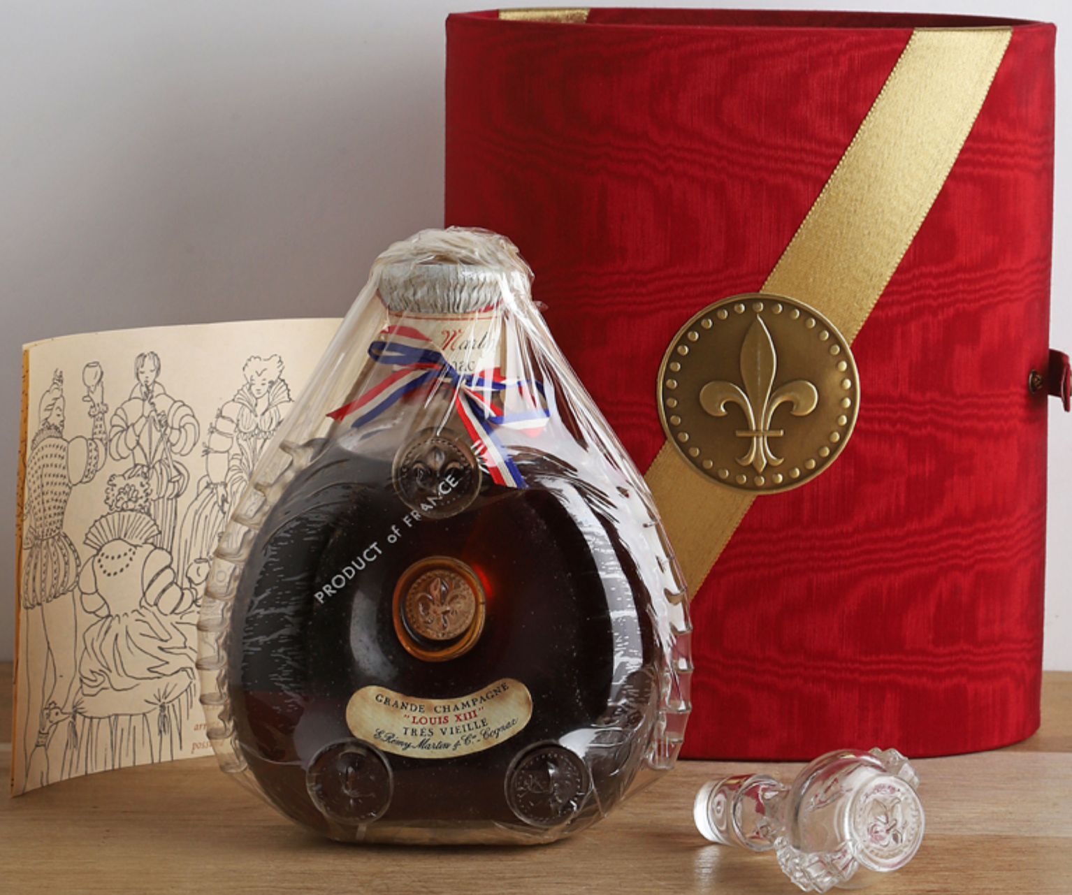
Lot 509 - 1 B COGNAC TRÈS VIEILLE GRANDE CHAMPAGNE LOUIS XIII 70 cl 40% (Coffret d'origine) - NM - Remy Martin