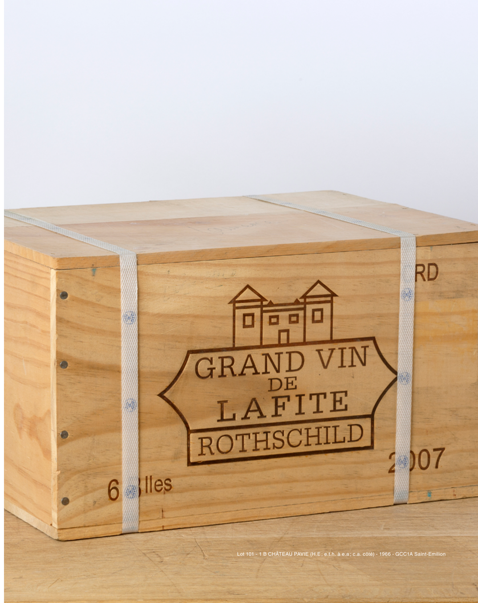
Lot 101 - 1 B CHÂTEAU PAVIE (H.E; e.t.h. à e.a; c.a. côté) - 1966 - GCC1A Saint-Emilion

L'ABUS D'ALCOOL EST DANGEREUX POUR LA SANTÉ, À CONSOMMER AVEC MODÉRATION