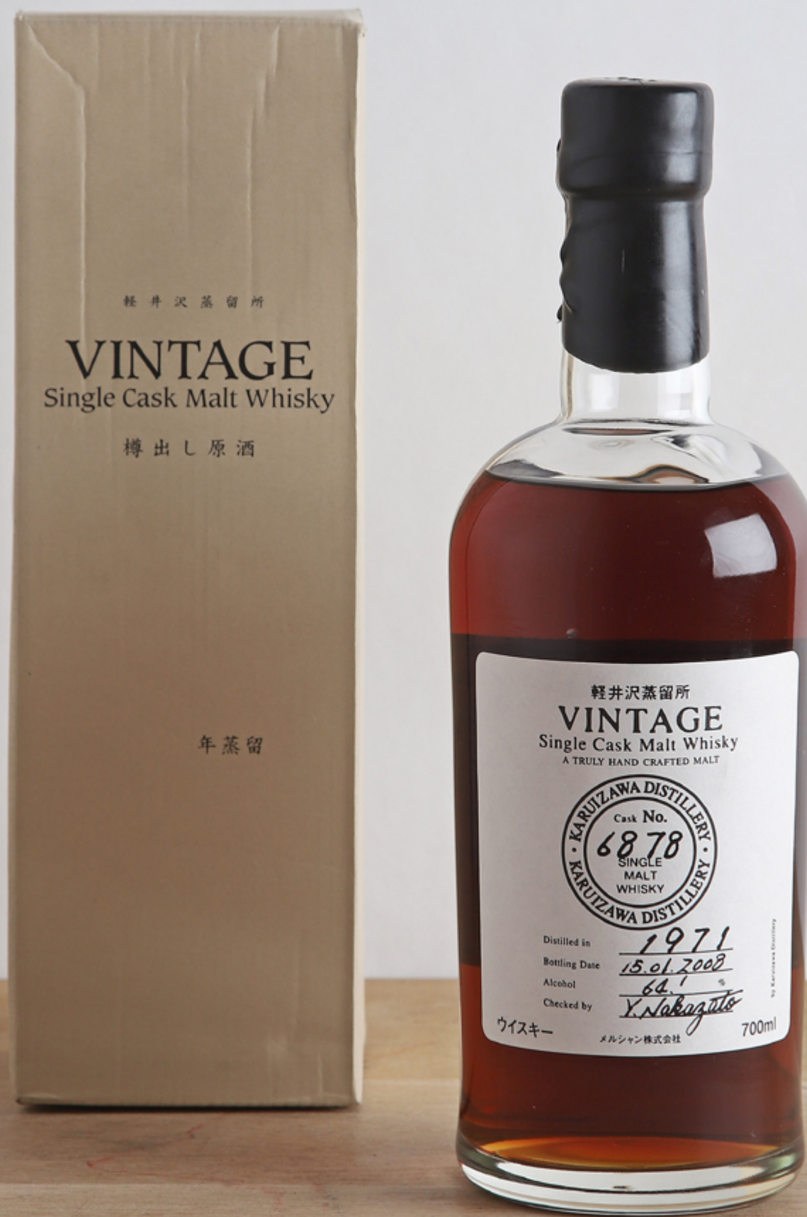
Lot 484 - 1 B JAPANESE VINTAGE SINGLE CASK MALT WHISKY - CASK #6878 - 37 ANS D'ÂGE (70cl; 64%; étui d'origine; distillé en 1971; mise le 15 janvier 2008) - Karuizawa

L'ABUS D'ALCOOL EST DANGEREUX POUR LA SANTÉ, À CONSOMMER AVEC MODÉRATION