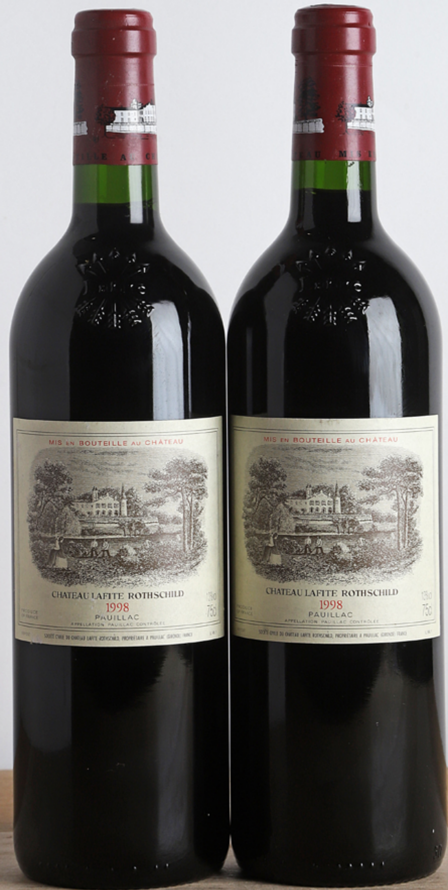
Lot 313 - 2 B CHATEAU LAFITE ROTHSCHILD - 1998 - GCC1 Pauillac