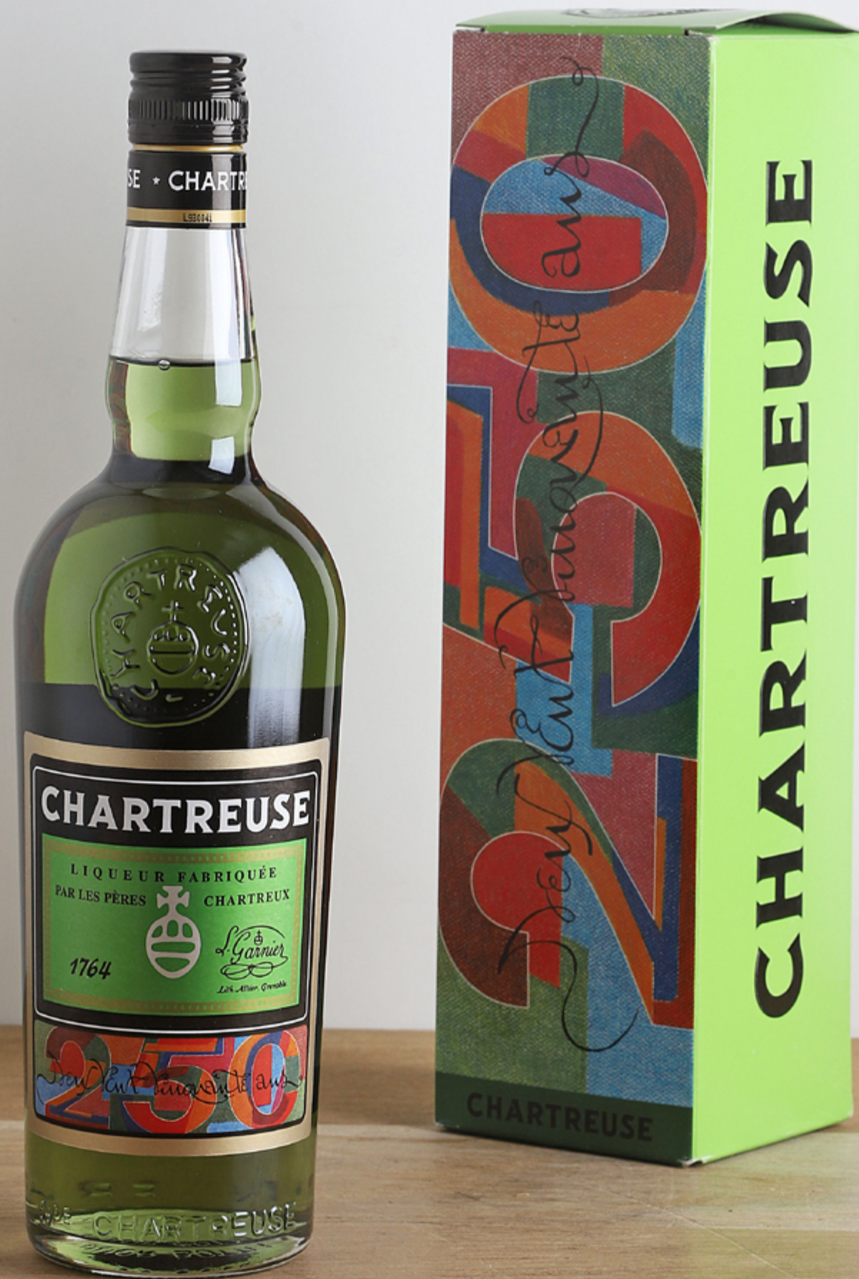
Lot 201 - 1 B CHARTREUSE VERTE VOIRON 250° ANNIVERSAIRE 1764-2014 70 cl 55% (étui d'origine) - NM - Pères Chartreux