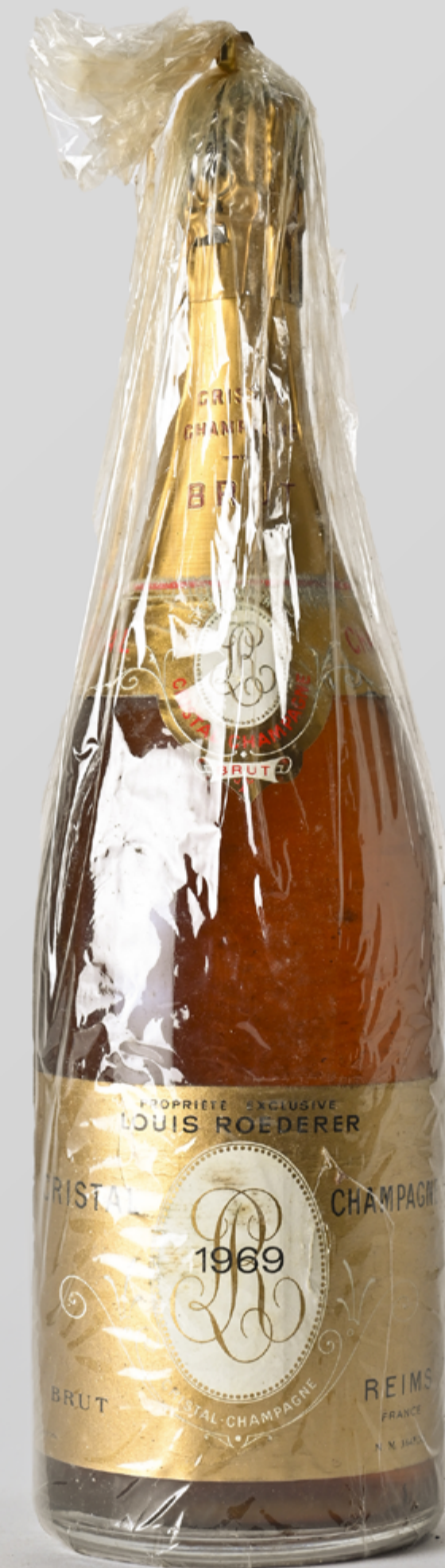
Lot 428 - 1 Mag CHAMPAGNE BRUT CRISTAL (Coffret d'origine abimé) (coiffe corrodée et abimée) - 1969 - Louis Roederer

L'ABUS D'ALCOOL EST DANGEREUX POUR LA SANTÉ, À CONSOMMER AVEC MODÉRATION