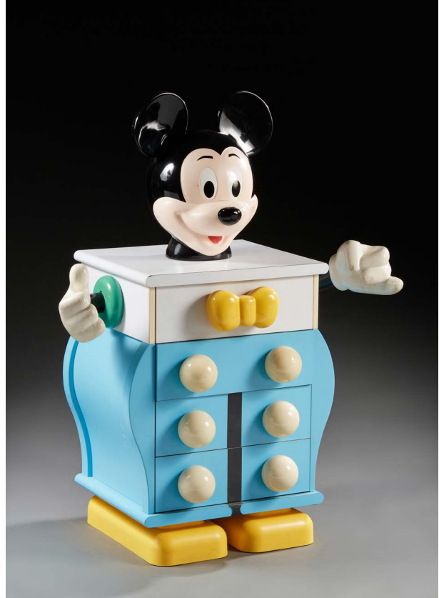
78. Pierre COLLEU (né en 1948) & STARFORM (éditeur) Mickey Mouse bleu », modèle créé circa 1980. Commode pour enfant en bois stratifié et plastique coloré ouvrant par quatre tiroirs en façade. Signé sur une plaque au dos « Disney par Starform ». Haut. : 118 cm - Long. : 90 cm - Prof. : 49 cm 600 / 800 €