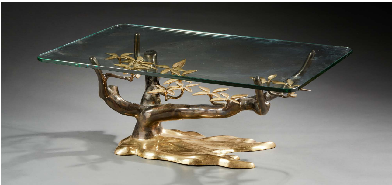
79. Willy DARO (attribuée à) Table basse « Bonsaï » en bronze doré et patiné canon de fusil à décor d'arbres et de feuilles à plateau en verre blanc rectangulaire et angles arrondis. Haut. : 42 cm - plateau : 110 x 70 cm 600 / 800 €