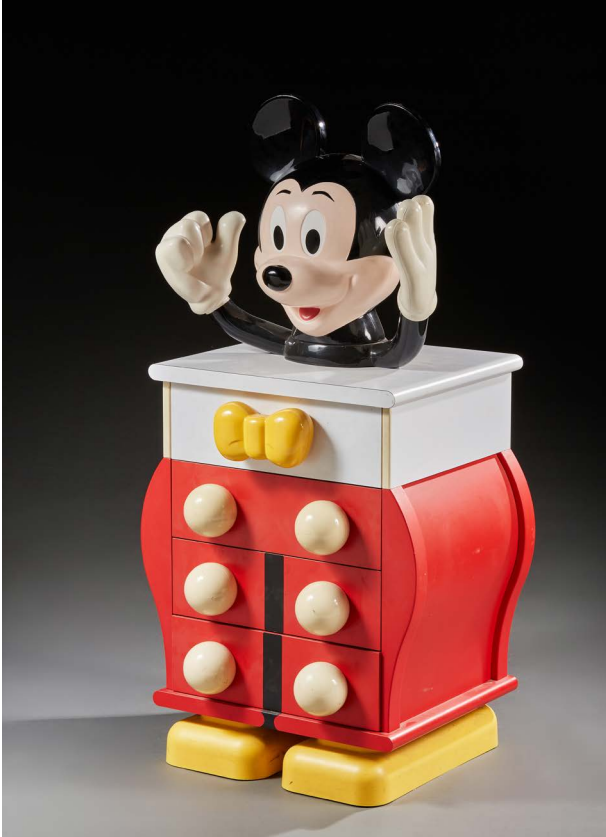
77. Pierre COLLEU (né en 1948) & STARFORM (éditeur) Mickey Mouse rouge », modèle créé circa 1980. Commode pour enfant en bois stratifié et plastique coloré ouvrant par quatre tiroirs en façade. Signé sur une plaque au dos « Disney par Starform ». Haut. : 118 cm - Long. : 90 cm - Prof. : 49 cm 600 / 800 €