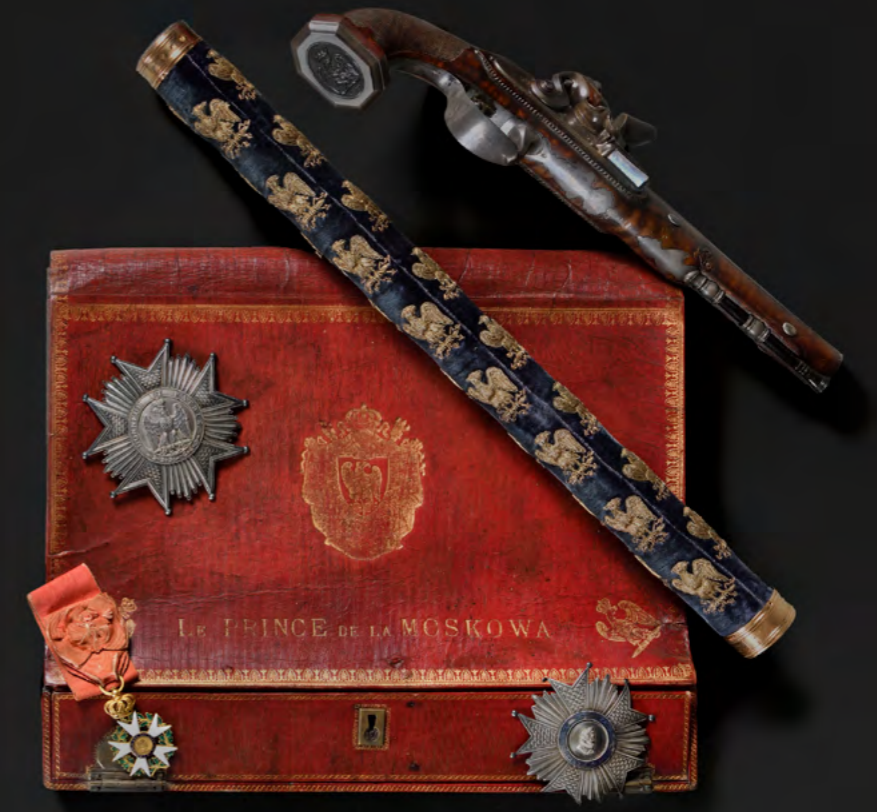
Souvenirs du Maréchal Michel Ney