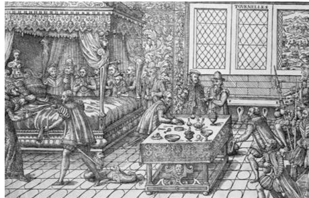
Mort du roi Henri II à la suite d'une joute

CHARLES IX est né le 27 juin 1550 au château royal de Saint-Germain-en-Laye et mort le 30 mai 1574 au château de Vincennes. Roi de France du 5 décembre 1560 au 30 mai 1574. Il est le quatrième roi de la famille des Valois-Angoulême. Fils d'Henri II et de Catherine de Médicis, il succède à son frère François II à l'âge de 10 ans et meurt sans enfant mâle légitime à l'âge de 24 ans. Sous son règne, le royaume est déchiré par les guerres de Religion, malgré tous les efforts déployés par sa mère Catherine pour les empêcher. Après plusieurs tentatives de réconciliation, son règne débouche sur le massacre de la Saint-Barthélemy.