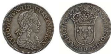
111. LOUIS XIII 1610 – 1643 Même type. ♦ Dy 1351 ; Gad 48 Quart d'écu d'argent du 2 e poinçon 1643 ( deux points ) D = Lyon. (6,85 g) Très bel exemplaire. 450 / 500 €