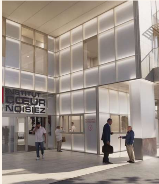
Institut du cœur Jean Louis Noisiez