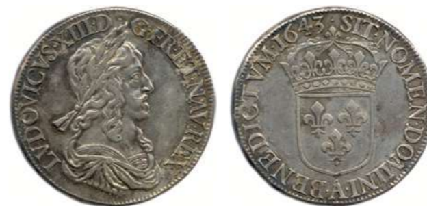
108. LOUIS XIII 1610 – 1643 Même type. ♦ Dy 1349 ; Gad 52 Écu d'argent de 60 sols du 2 e poinçon 1643 ( point ) A = Paris. (26,81 g) Patine. Très beau. 1 000 / 1 200 €