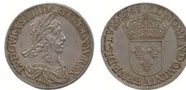
106. LOUIS XIII 1610 – 1643 Même type. ♦ Dy 1349 ; Gad 52 Écu d'argent de 60 sols du 2 e poinçon 1643 ( point ) A = Paris. (27,38 g) Jolie patine de médailleur. Superbe. 1 800 / 2 000 €