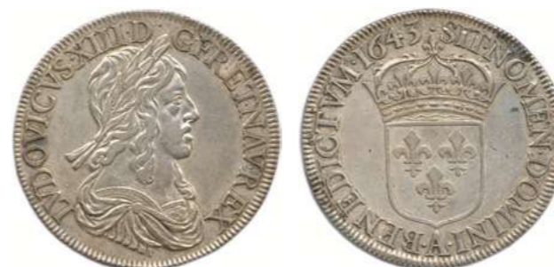
107. LOUIS XIII 1610 – 1643 Même type. ♦ Dy 1349 ; Gad 52 Écu d'argent de 60 sols du 2 e poinçon 1643 ( point ) A = Paris. (27,32 g) Tâches d'oxydation. Très beau. 1 000 / 1 200 €