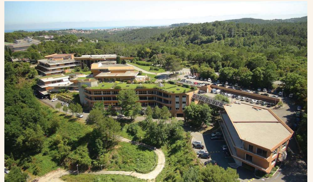
Le siège administratif du groupe GSF