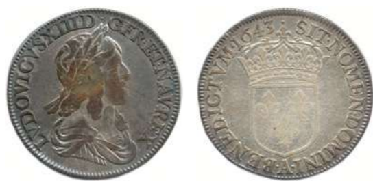
110. LOUIS XIII 1610 – 1643 Même type. ♦ Dy 1350 ; Gad 50 Demi-écu d'argent de 30 sols du 2 e poinçon 1643 ( point ) A = Paris. (13,49 g) Beau. 80 / 100 €