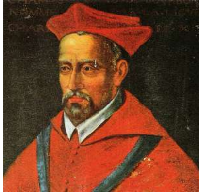
Charles X Cardinal de Bourbon Château de Beauregard

CHARLES X Charles I er de Bourbon est né le 22 septembre 1523 au Château de La Fère (Aisne) et mort le 9 mai 1590 à Fontenay le Comte (Vendée). Il était prince de sang de la maison de Bourbon, reconnu roi en 1589. Au cours de sa carrière ecclésiastique, il devient abbé commendataire de plus de vingt abbayes. L'accumulation de ces bénéfices fait de lui un des plus riches princes d'Europe. Bien que dénué de caractère et d'intelligence, il fut l'un des personnages importants des guerres de religion. En 1585, la Ligue catholique l'imposa au roi Henri III comme héritier de la couronne de France à la place de son neveu protestant le futur Henri IV. Lors des États généraux de 1588 à Blois, il est arrêté sur ordre du roi. À la mort de ce dernier, alors qu'il est toujours séquestré, il est reconnu par les ligueurs comme le seul roi de France légitime. Il est proclamé par le Parlement de Paris sous le nom de « Charles X » en 1589. Il meurt l'année suivante à l'âge de soixante-six ans. Les Ligueurs opposent une résistance acharnée au huguenot Henri de Navarre (roi légitime) à qui ils préférèrent Charles, oncle du roi, appelé Charles X. Il meurt prisonnier de son neveu en 1590. De nombreux ateliers continuèrent de monnayer au nom du roi défunt bien après sa mort. Le monnayage des Ligueurs au nom d'Henri III cessa quand Toulouse tomba entre les mains d'Henri IV, le 24 janvier 1596.