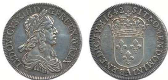
104. LOUIS XIII 1610 – 1643 Même type. ♦ Dy 1350 ; Gad 50 Demi-écu d'argent de 30 sols du 2 e poinçon 1642 ( point ) A = Paris. (27,16 g) Lustré. Superbe. 350 / 400 €