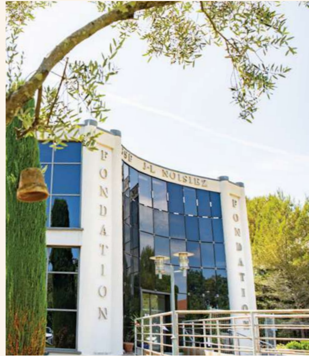
La Fondation GSF Jean Louis Noisiez