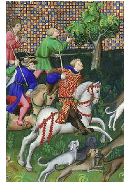
Gaston Phébus à la chasse