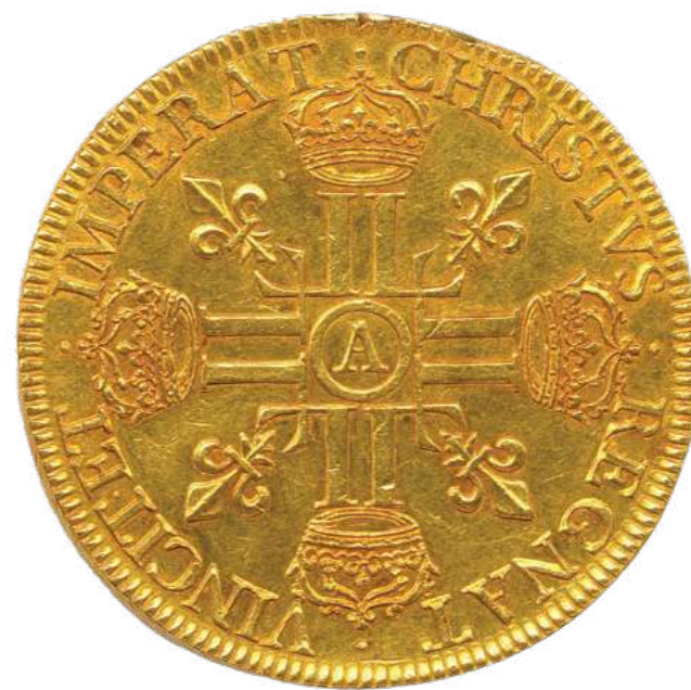
Couverture N° 85 LOUIS XIII 1610-1643