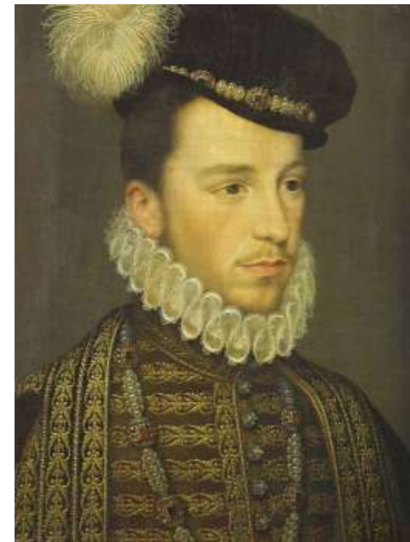
Henri III de France