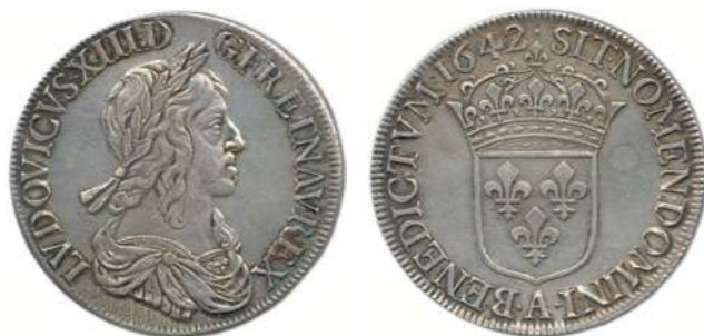
103. LOUIS XIII 1610 – 1643 Même type. ♦ Dy 1349 ; Gad 52 Écu d'argent de 60 sols du 2 e poinçon 1642 ( point ) A = Paris. (27,16 g) Trace de nettoyage et stries d'origine. T.B./Très beau. 800 / 900 €