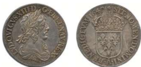
105. LOUIS XIII 1610 – 1643 Même type. ♦ Dy 1351 ; Gad 48 Quart d'écu d'argent du 2 e poinçon 1642 ( rose ) A = Paris. (6,88 g) Superbe. 350 / 400 €