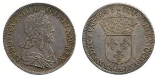
109. LOUIS XIII 1610 – 1643 Même type. ♦ Dy 1350 ; Gad 50 Demi-écu d'argent de 30 sols du 2 e poinçon 1643 ( rose ) A = Paris. (13,75 g) Superbe. 450 / 500 €