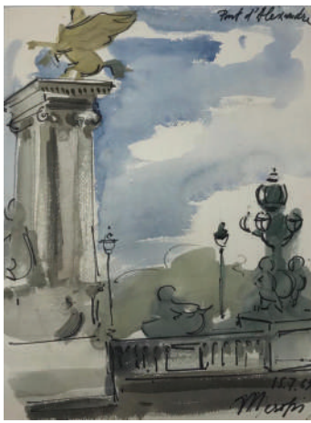
25. Pont d'Alexandre III, 15-7-63 Aquarelle et feutre 32 x 24 cm