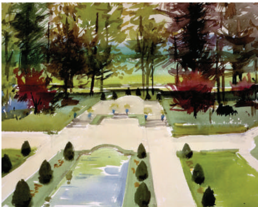
6. Le jardin du chateau Margaux, 1977 Aquarelle 32 x 41.5 cm