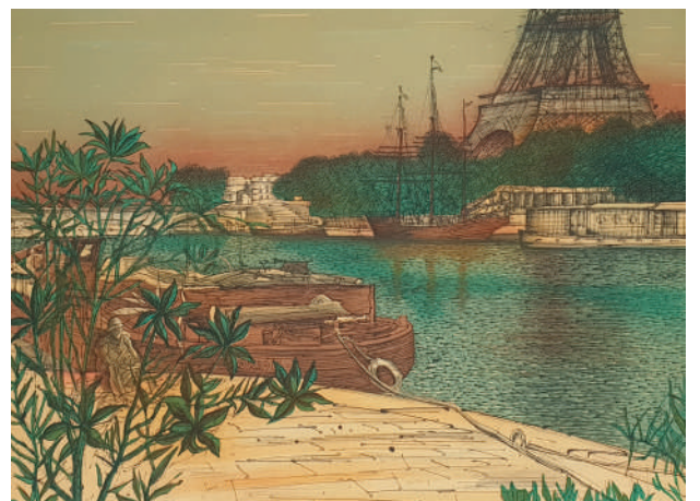
77. Quai de Passy , 1986 Lithographie 41 x 56 cm