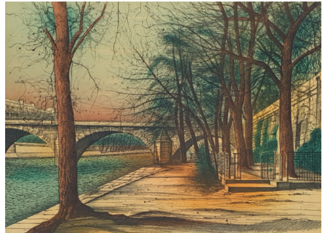
70. Le quai du Louvre , 1986 Lithographie 41 x 55.5 cm