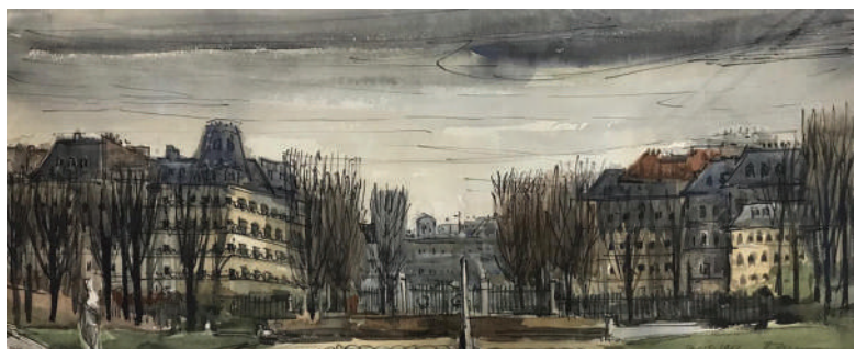
22. Le jardin du Luxembourg, 1962 Encre et aquarelle 28.5 x 63.5 cm