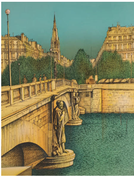
69. Le pont de l'Alma , 1984 Lithographie 65 x 49.5 cm