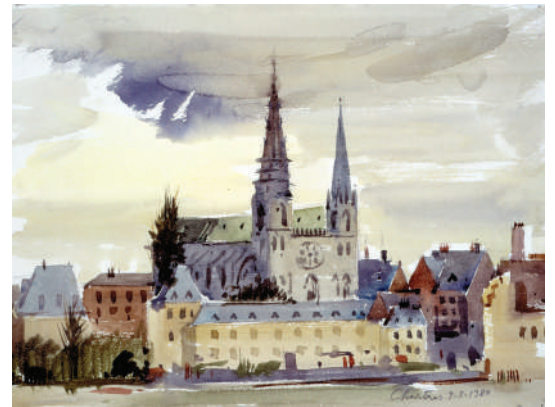
32. La cathédrale de Chartres, 9-3-1980 encre et aquarelle 22.5 x 28.5 cm