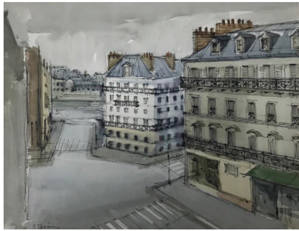
26. Rue Galilée, Paris, circa 1985 Aquarelle 25.5 x 33 cm