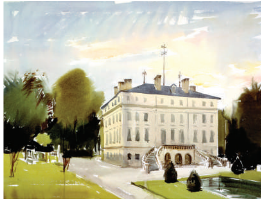
4. L'arrière du chateau Margaux, 1977 Aquarelle 48 x 63 cm