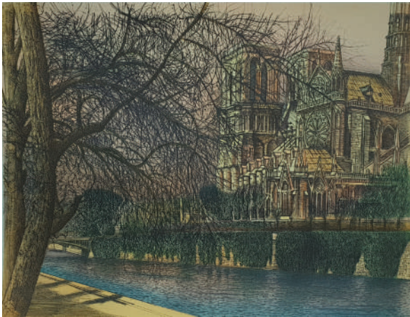
71. Vue de Notre Dame de Paris II , 1983 Lithographie 49.5 x 65 cm