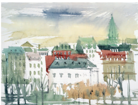
34. Bord de Loire Aquarelle 27 x 34 cm