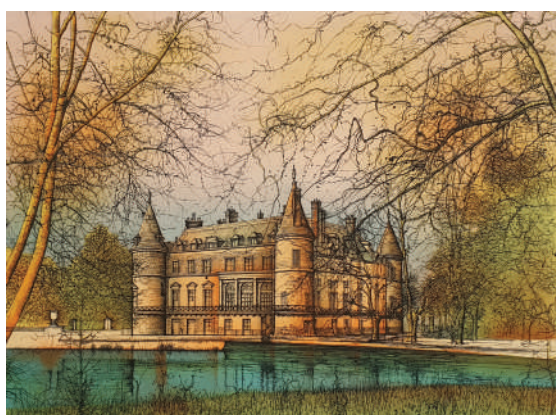
58. Rambouillet , 1984 Lithographie 53 x 69 cm