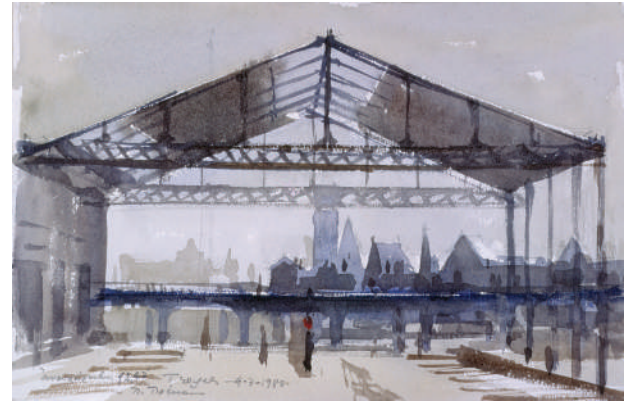
28. La gare de Troyes, 4-3-1980 Aquarelle 19 x 29 cm