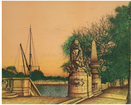
68. Le lion d'Alexandre III , 1984 Lithographie 49.5 x 65 cm