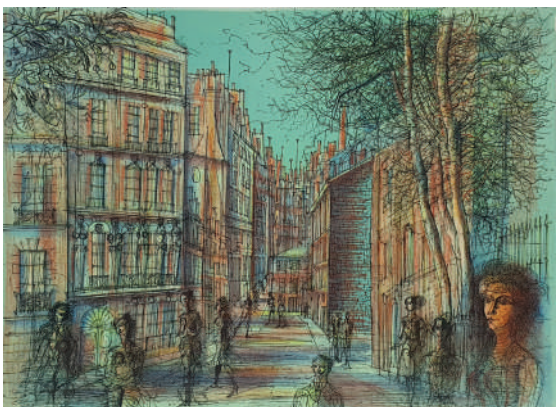
63. A Saint-Germain des Prés , 1977 Lithographie 47 x 65 cm