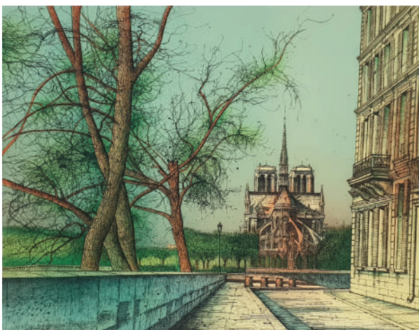
75. Vers Notre Dame , 1983 Lithographie 49.5 x 65 cm