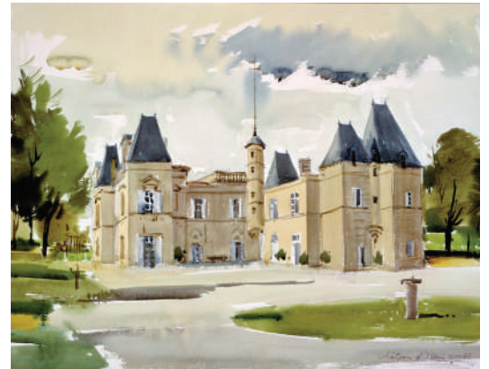
14. Chateau d'Issan, 10-10-1977 Aquarelle, 48 x 63.5 cm