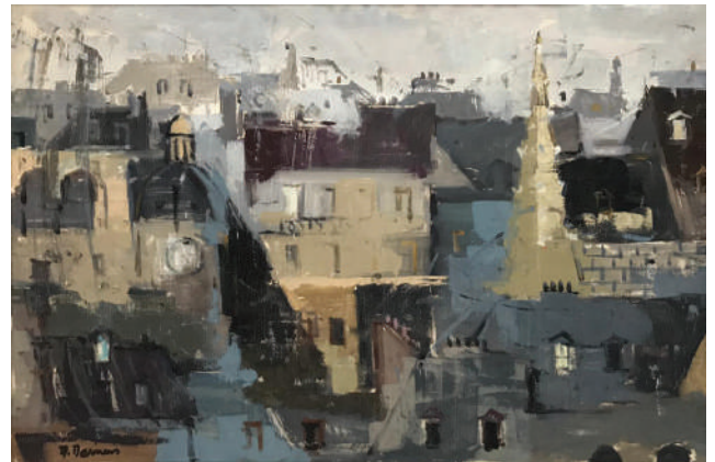
20. Paris, circa 1962 Huile sur toile 91 x 60 cm