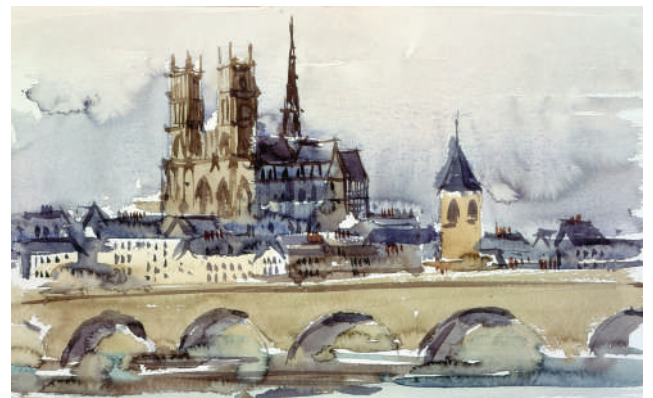
41. Orléans Aquarelle 24 x 34 cm