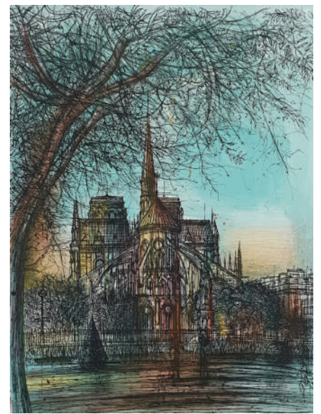
72. Le chevet de Notre Dame de Paris , 1970 Lithographie 66 x 48 cm