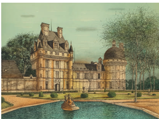
61. Valençay , 1986 Lithographie, 52 x 70 cm