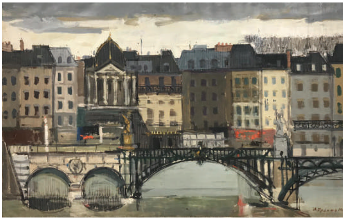
27. Paris 1963 Huile sur toile 59 x 91.5 cm