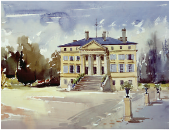
3. La facade du chateau Margaux, 1977 Aquarelle 49 x 63.5 cm