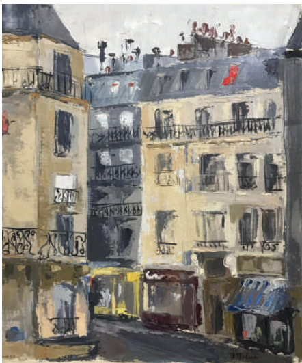
24. Quartier latin, Paris, circa 1963 Huile sur toile 55 x 46 cm