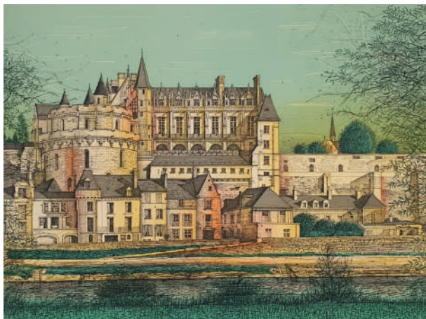
45. Amboise , 1985 Lithographie 51 x 68 cm