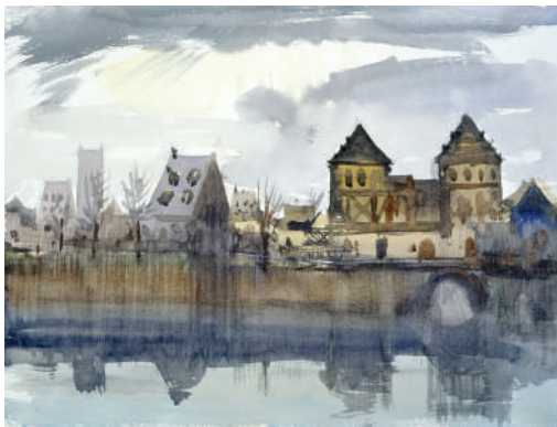
33. Bord de Loire Aquarelle 29.5 x 39.5 cm